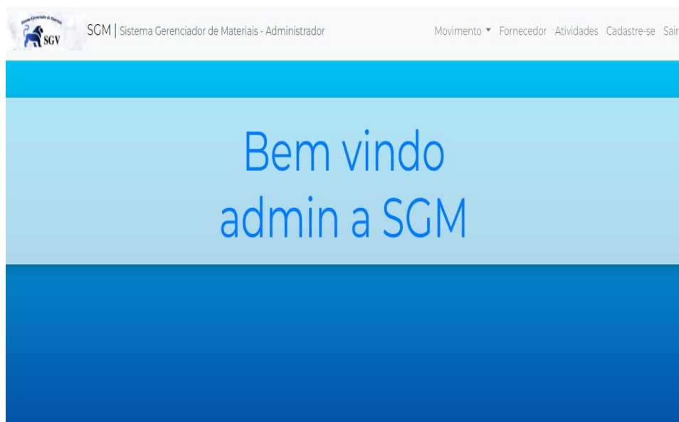
Figura 5 – Menu.

O cliente é redirecionado para esta página de menu conforme a figura 5.