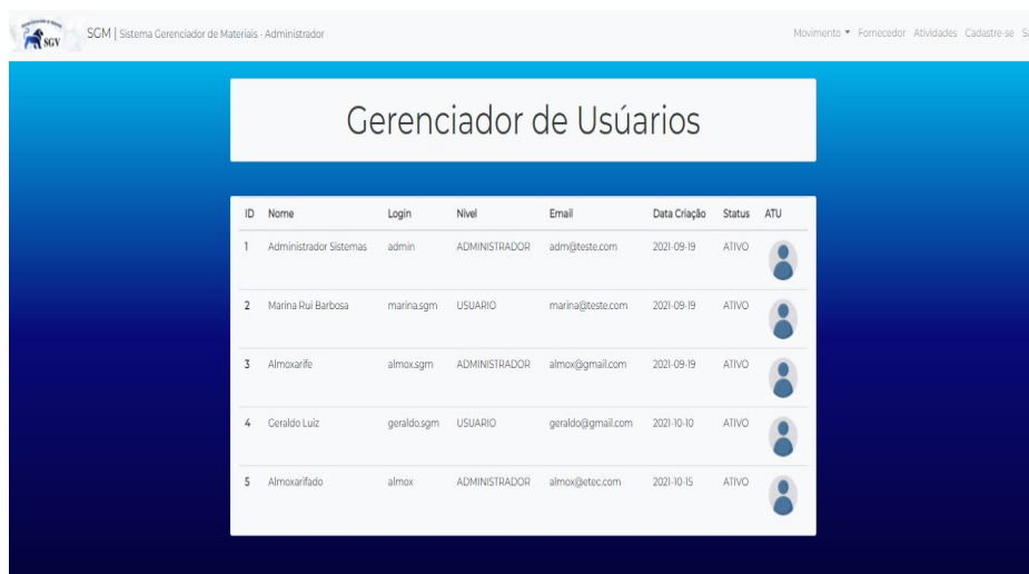
Figura 3– Gerenciador de usuários.

A tela (Gerenciador de Usuários) o administrador gerencia todos que estão cadastrados no sistema conforme a figura 3.