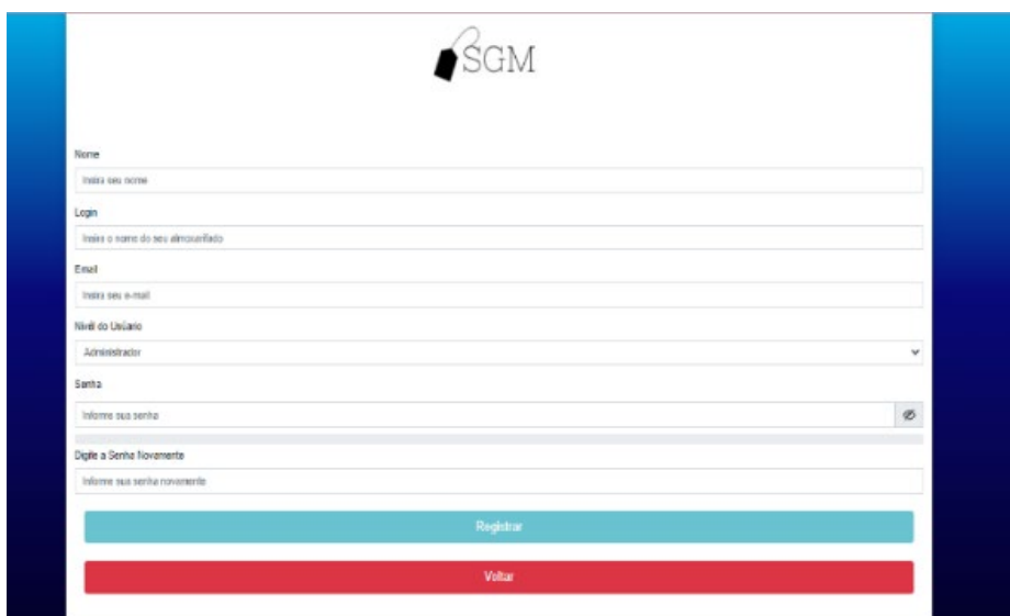
Figura 2– Cadastro de Usuário

Na tela (Cadastro de Usuário) deverá ser introduzido o nome completo do usuário assim como seus dados pessoais, digitado pelo administrador da plataforma que estará a conduzir o cadastro conforme a figura 2.