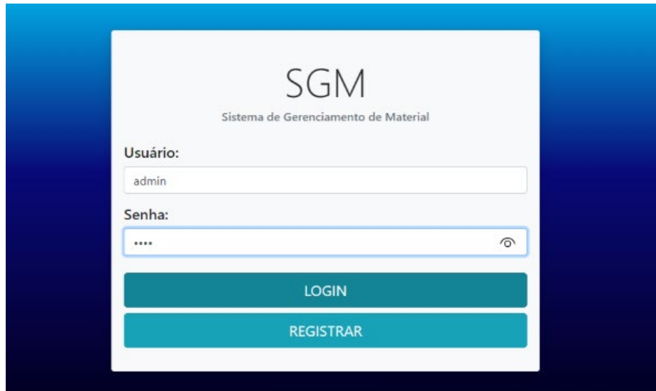
Figura 1 – Login