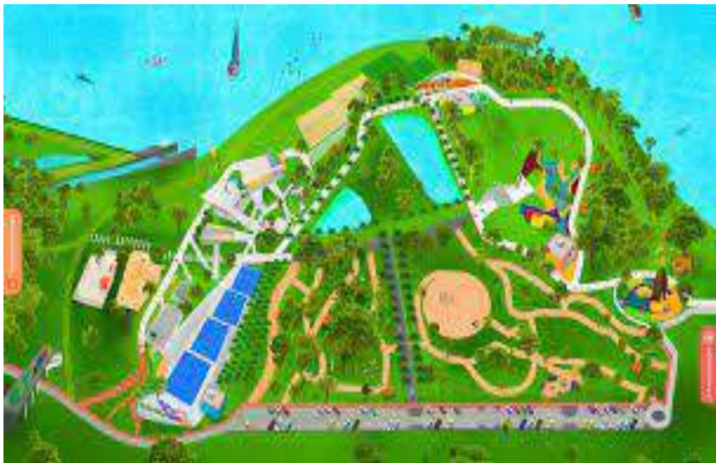
FIGURA 1 – Parque Mundo das Crianças