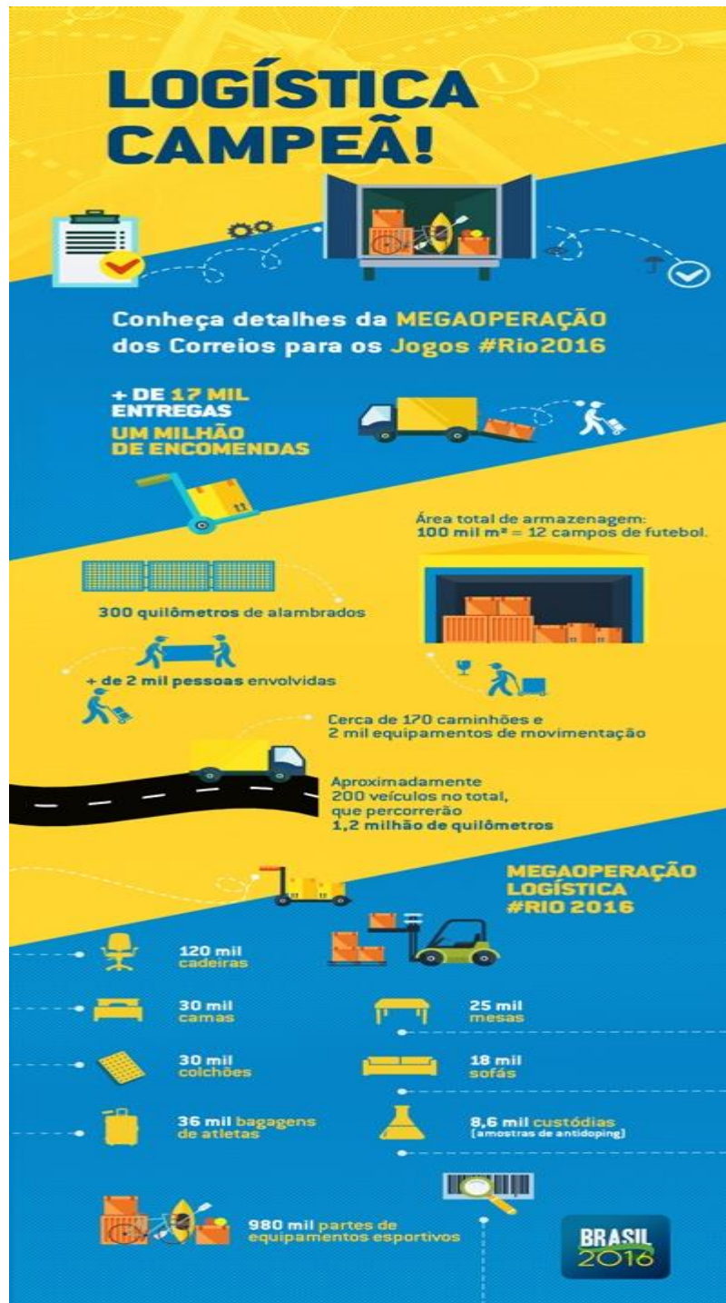
Figura 3 – Logística dos Correios