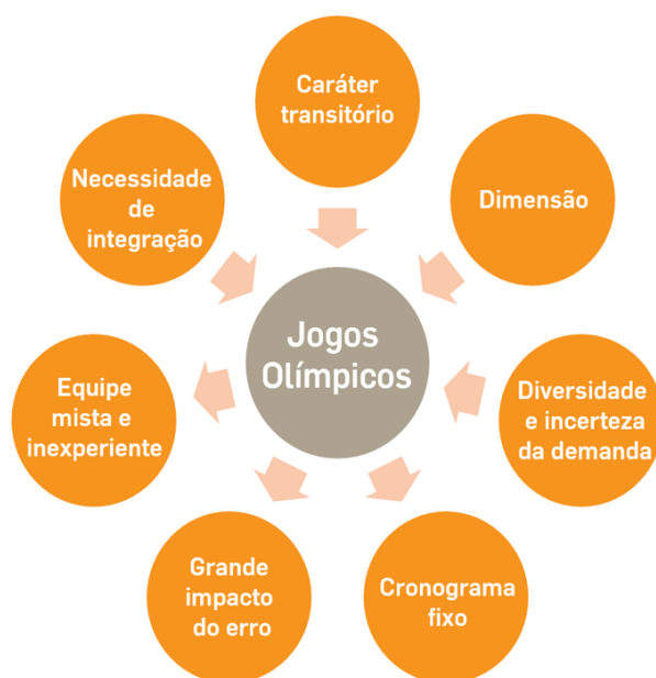
Figura 2 – Fatores que dificultam a logística dos jogos

Necessidade de integração: é preciso atender com precisão todos que fazem parte do evento desde a comissão até o público.