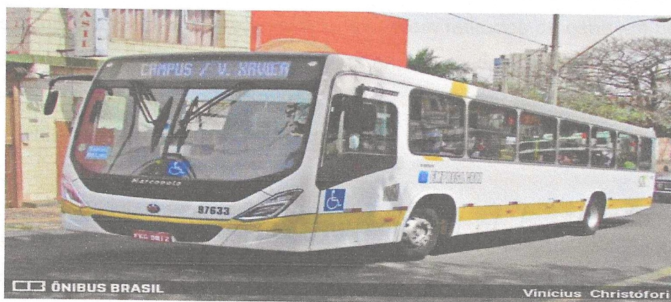
Figura 6- Ônibus da Empresa Cruz operando pelo Consórcio Araraquara de Transportes