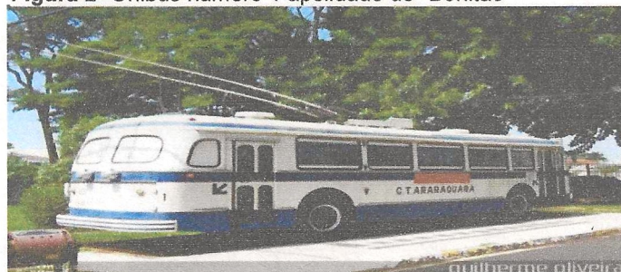
Figura 2- Ônibus número 1 apelidado de "Bonitão"

empresa, e vários representantes da prefeitura. O início das operações deu-se quatro meses depois com 18 km de rede bifilar nas duas recém-criadas linhas Vila Xavier-Carmo e Estação-Fonte.