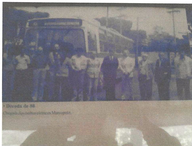
Figura 1- Chegada do ônibus elétrico Marcopolo