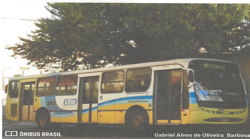
Figura 4- Ônibus da antiga CTA em circulação