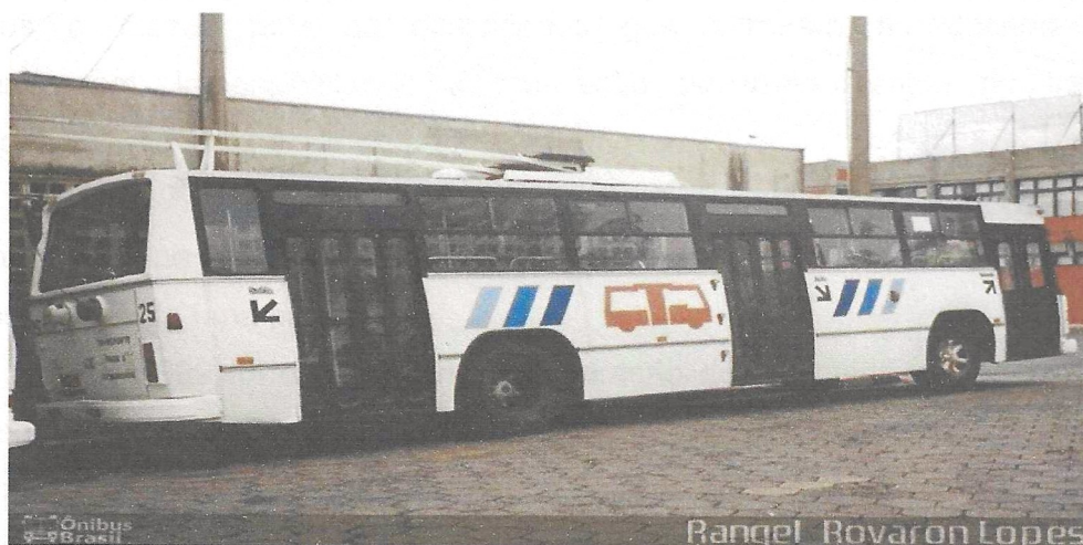
Figura 3- Ônibus Elétrico

28 ônibus elétricos, e com a construção das subestações da Vila Xavier e São José, a cidade passou a ter 60,9 km de rede bifilar instalada.