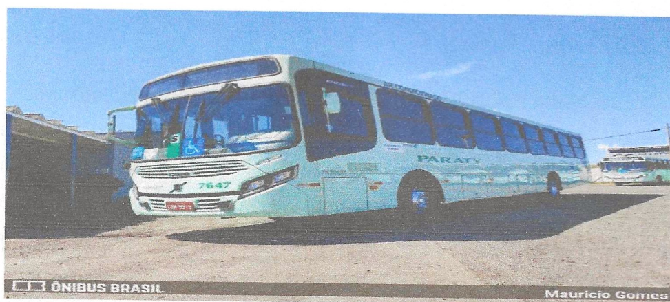
Figura 5- Ônibus da Paraty operando pelo Consórcio Araraquara de Transportes