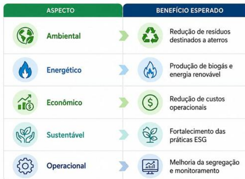
Figura 2 – Aspectos e benefícios esperados do sistema BioFusion

Além da geração de energia renovável, o sistema promove fortalecimento das práticas ESG, redução de impactos ambientais e incentivo à economia circular. Benefícios potenciais do sistema BioFusion: Figura 2.