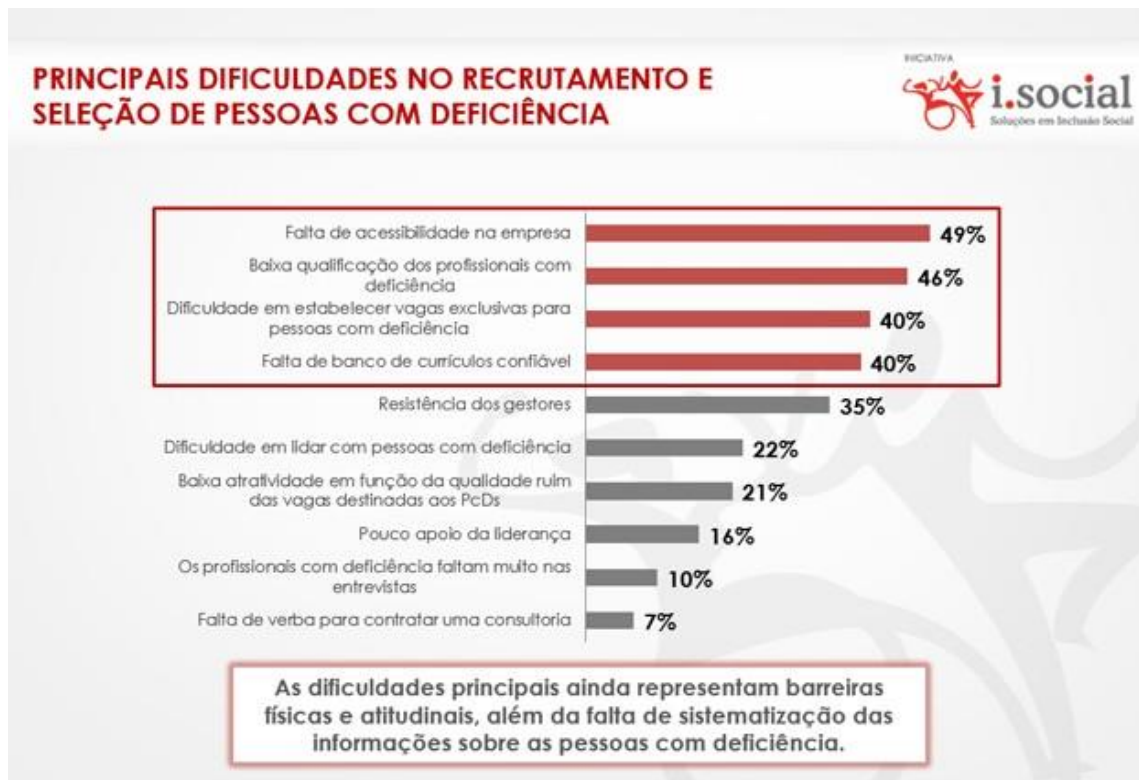
Figura 3 – Principais dificuldades no Recrutamento e Seleção