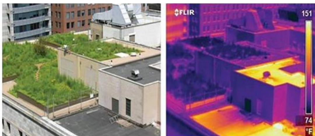
Figura 4 - Diferença de temperatura entre coberturas vegetadas e com telhado convencional.