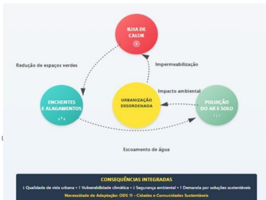
Figura 1 – Ciclo de Problemas Urbanos: Desafios Ambientais Interconectados.

As cidades brasileiras enfrentam desafios ambientais crescentes devido à urbanização acelerada. Dias (2024) documenta que eventos climáticos extremos como ondas de calor, secas prolongadas e chuvas intensas provocam deslizamentos, enchentes e alagamentos, expondo a vulnerabilidade dos centros urbanos frente às mudanças climáticas. O autor explica que a impermeabilização excessiva do solo reduz a capacidade natural de drenagem, agravando esses impactos. Esses desafios apresentam-se de forma interconectada e cíclica, formando um ciclo complexo de problemas ambientais que se retroalimentam, conforme representado na Figura 1. De Arruda Filho e Jacobi (2024) argumentam que a adaptação climática deve nortear as políticas públicas municipais para enfrentar extremos climáticos.