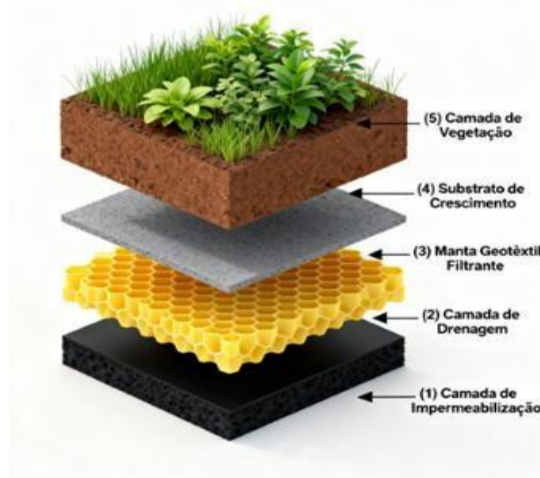
Figura 2 – Estrutura em Camadas do Telhado Verde

Os telhados verdes apresentam estrutura multicamadas essencial para seu desempenho e longevidade (Figura 2). Conforme Neto (2021) citado por Raposo (2024), essa estrutura compreende cinco camadas principais organizadas da base ao topo.