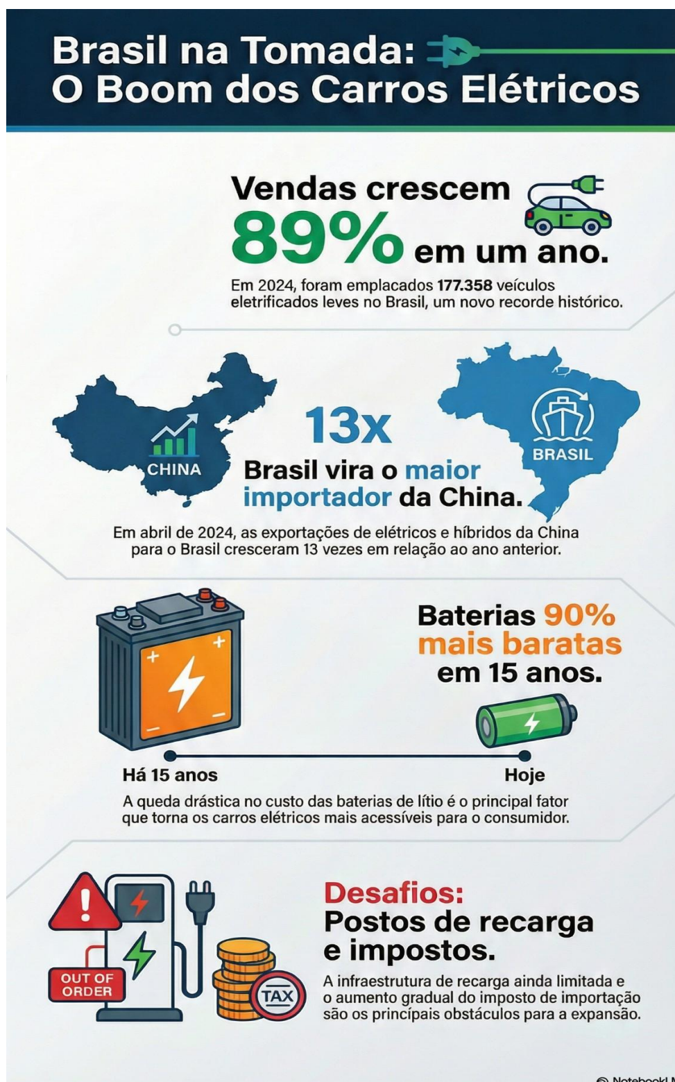
Figura 2: Gráfico sobre detalhamento de importações e infraestrutura de carros elétricos para o Brasil.