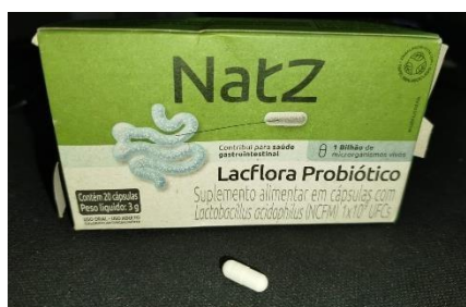
Imagem 5: Cepa de Acidophilus obtida comercialmente para as fermentações.