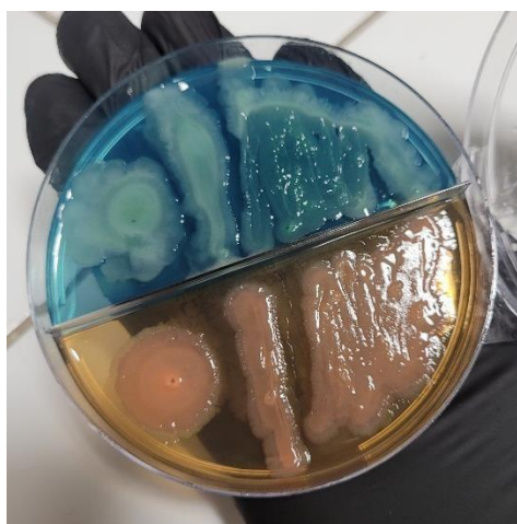
Imagem 6: Placa de Ágar MacConkey com Lactobacilos Acidophilus desenvolvido.

Tais dados foram obtidos com a utilização de placas de Ágares MacConkey, próprios para o cultivo de Lactobacillus, que permitiram a observação e um crescimento saudável e coeso das cepas testadas.