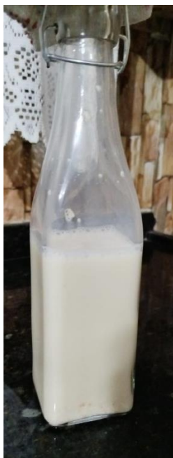
Imagem 2: Base para fermentação produzida a partir de amêndoas em natura.

nos é interessante é o equivocadamente chamado de “leite” de amêndoas, pois a palavra “leite” deve ser utilizada exclusivamente para caracterizar produtos de origem animal, de todo modo, o produto obtido já poderia ser consumido e utilizado durante até uma semana, ou até 2 meses caso mantido em uma temperatura média de 5 °C, sendo possível consumi-lo aos poucos em pequenas porções (