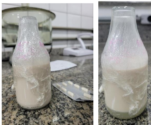
Imagem 7 e 8: Bebida pós fermentação em fase de testes.

Após estudos em cima de métodos de fermentação foi iniciado as análises laboratoriais. A partir da experiência obtida com os primeiros processos pilotos utilizando de produtos industrializados, aos poucos foram feitas substituições para bases naturais e a cepa em foco, onde se obteve os primeiros resultados satisfatórios com o que tinha-se como objetivo, com características congruentes à uma bebida probiótica, com aspecto aquoso e odor e sabor levemente ácidos.