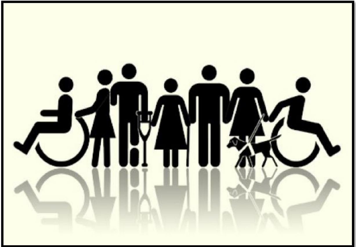
Figura 1 - Inclusão no mercado de trabalho.