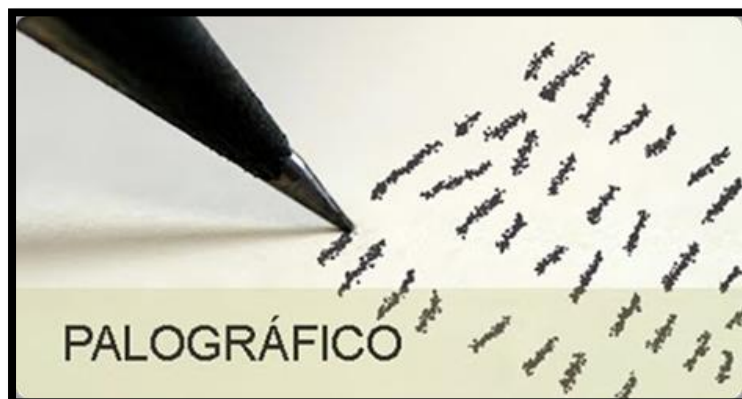
Figura 3 - Teste palográfico.

Através da construção de linhas verticais feita pelo candidato demonstrar características como: temperamento, produtividade e humor.