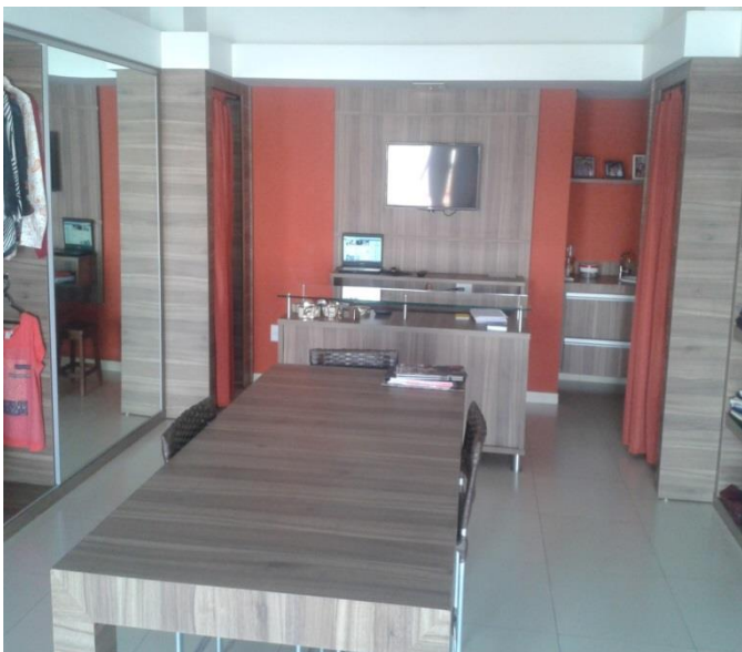
FIGURA 2 - RECEPÇÃO