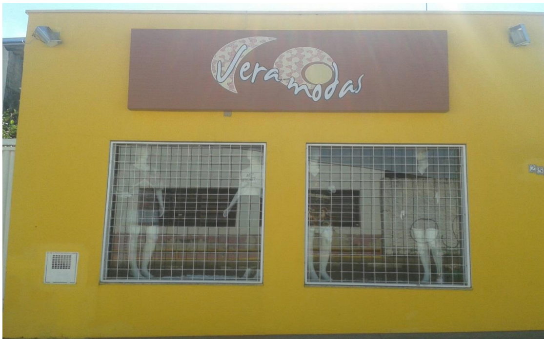
FIGURA 1 - VITRINE