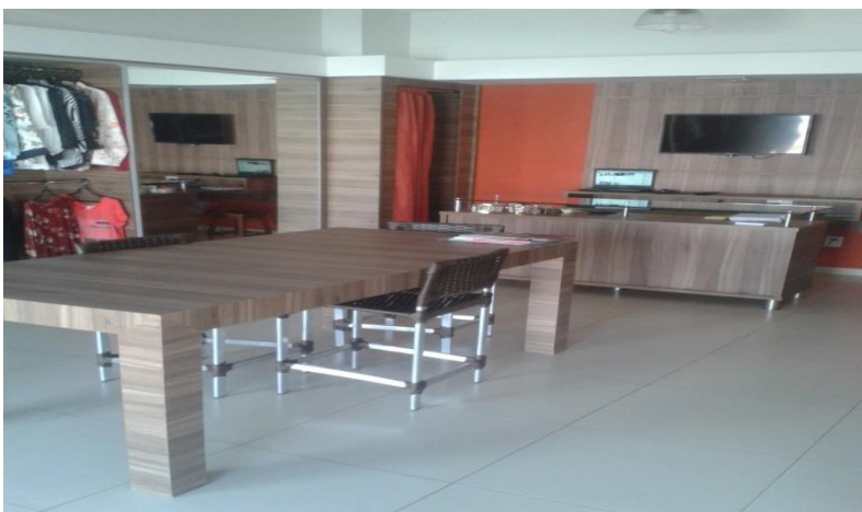
FIGURA 3 - INTERIOR DA LOJA