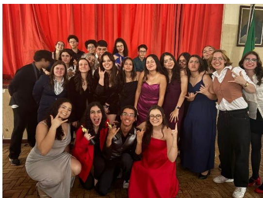
Figura 06 – Evento