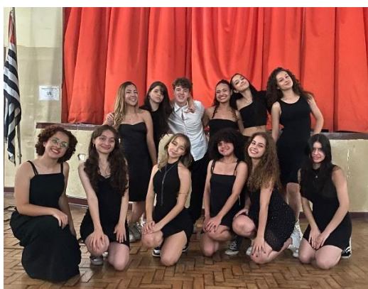
Figura 08 – Evento (Grupo de dança Check Mate)