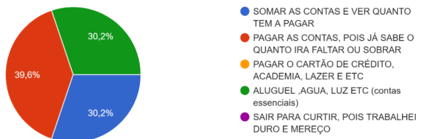
QUANDO VOCÊ RECEBE SEU SALÁRIO, QUAL A PRIMEIRA COISA QUE VOCÊ FAZ? 53 respostas