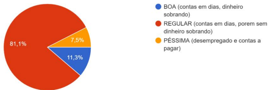
COMO ESTÁ SUA SITUAÇÃO FINANCEIRA? 53 respostas

No gráfico 1, podemos observar que a maior parte da situação financeira entre as pessoas que responderam à pesquisa, está na média REGULAR.