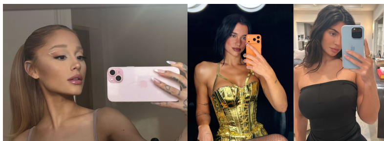
Figura 5: Figuras de influência na mídia que possuem o smartphone da Apple - Ariana Grande, Dua Lipa e Kylie Jenner

tornando aquele que o usa um indivíduo com valores ricos e status social, assim como podemos observar nas figuras abaixo.