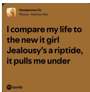
Figura 1: Trecho da Música Headphones on

Na figura 1, podemos observar um trecho da letra que retrata essa comparação.