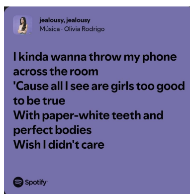
Figura 3: Trecho da Música Jealousy, jealousy

Sob este viés, Rodrigo quer abordar uma situação que se tornou recorrente na sociedade moderna do século XX quando relata esta comparação que a prejudica, a tradução da letra nos traz clareza sobre o tema quando diz que: “ Eu sei que a beleza delas não é minha falta, mas parece que esse peso está nas minhas costas e não consigo deixá-lo ir. Com- Comparação está me matando lentamente”