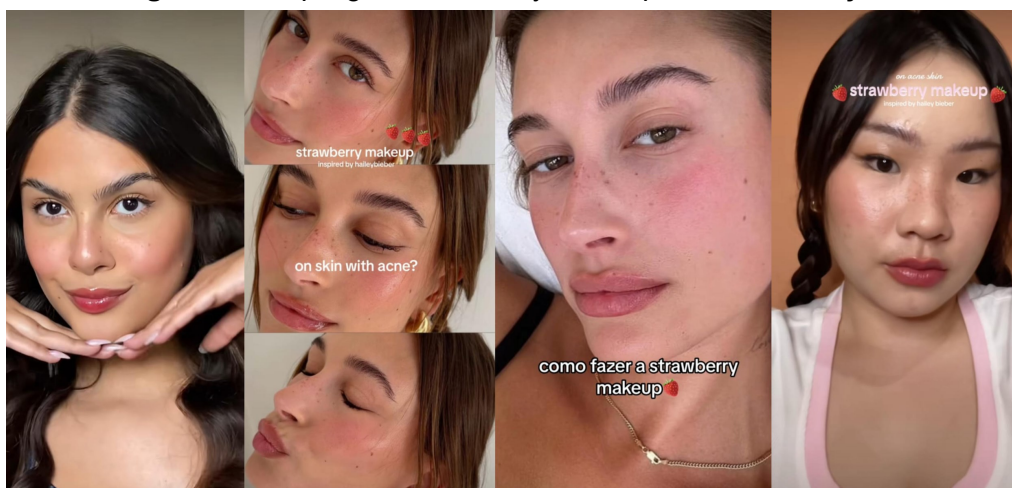
Figura 4: Maquiagem strawberry makeup e suas recreações

Para exemplificar a ação citada acima, resgatamos a estratégia desenvolvida pela influenciadora digital e empresária Hailey Bieber, que no ano de 2023 criou uma tendência mundial na internet ao nomear um estilo de maquiagem de “ strawberry makeup ”, em português maquiagem de morango , tal ação rapidamente se tornou viral, com muitos adeptos repetindo a maquiagem e sua nomenclatura, não deixando de destacar a sua criadora, conforme podemos observar na figura 4.