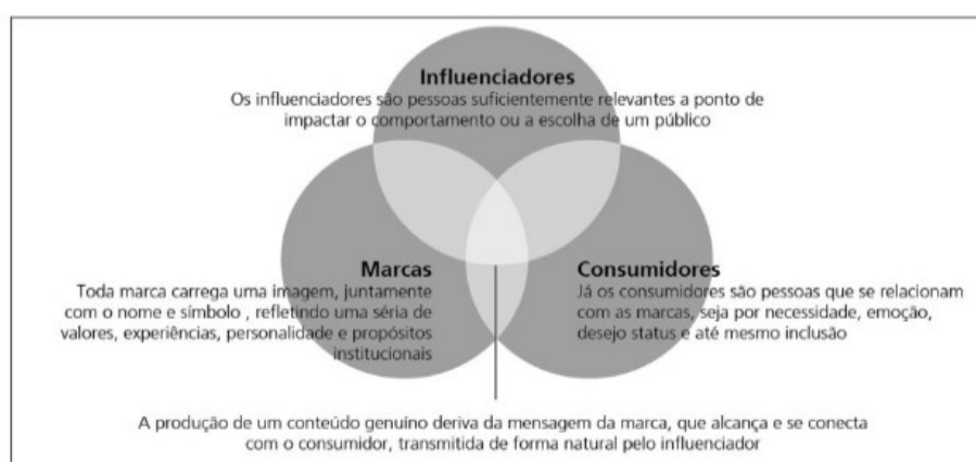
Figura 5: Diagrama que representa a relação entre influenciador, marca e consumidores