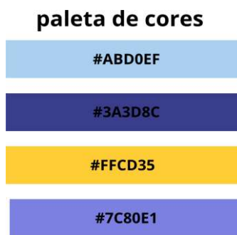
FIGURA 3: Representação da paleta de cores.

A nossa paleta de cores foi cuidadosamente selecionada, incorporando tons de azul e amarelo. Essa escolha de cores evoca uma sensação de alegria infantil, em sintonia com o nosso público-alvo composto por crianças. Ao mesmo tempo, ela também preserva um elemento de seriedade, o que permite que os pais e responsáveis se identifiquem com a nossa marca, confiando em nossos produtos e serviços.