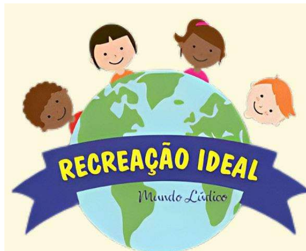
FIGURA 4: logotipo.