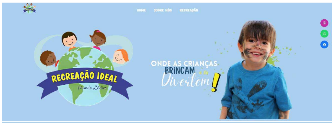
Figura 5 : Menu e home