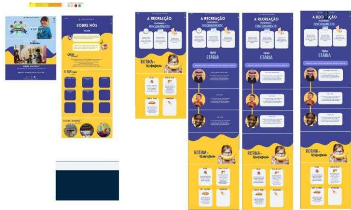
FIGURA 2: Prototipo Design do Site.