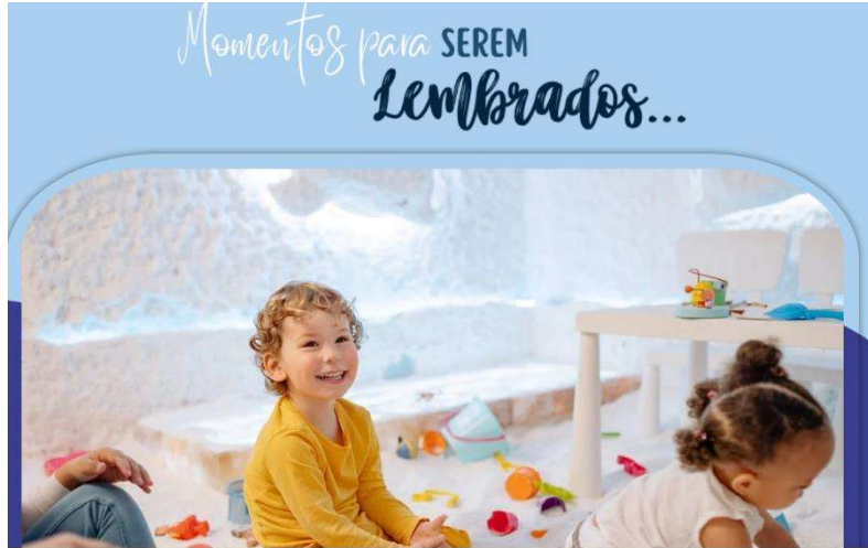
Figura 6: Slider de Fotos