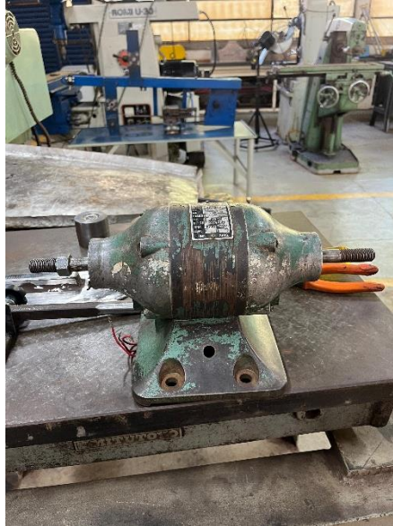
Figura 8: Motor elétrico trifásico de ½ cv