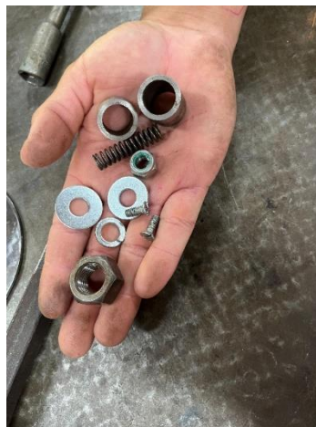
Figura 11: Porcas, buchas e parafusos etc...