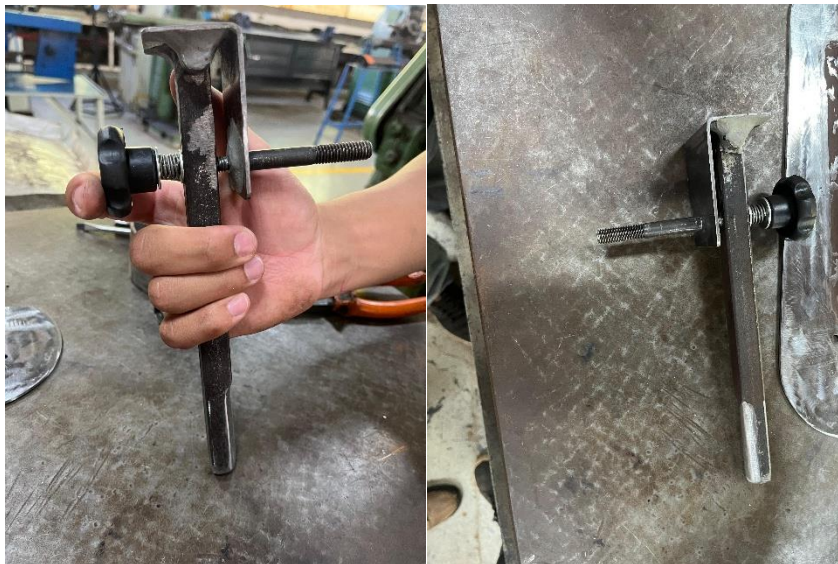
Figura10: Estrutura de regulagem da cinta

O furo de regulagem da polia menor possui comprimento de 30 mm e diâmetro de 8 mm, permitindo o ajuste preciso da tensão e do posicionamento da lixa — fatores fundamentais para o funcionamento seguro e eficiente do equipamento.