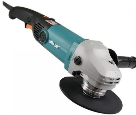
Figura 5: A lixadeira angular