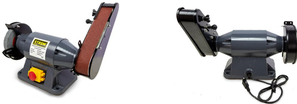
Figura 1: A lixadeira de cinta (ou de correia)