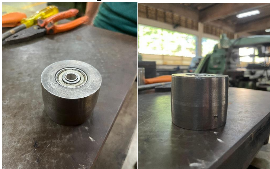
Figura 7: Polia menor

A polia menor contém dois rolamentos internos, responsáveis por permitir a rotação livre e precisa do conjunto, dispensando o uso de mancais externos. Essa solução reduz o atrito, simplifica a montagem e aumenta a durabilidade dos componentes móveis.