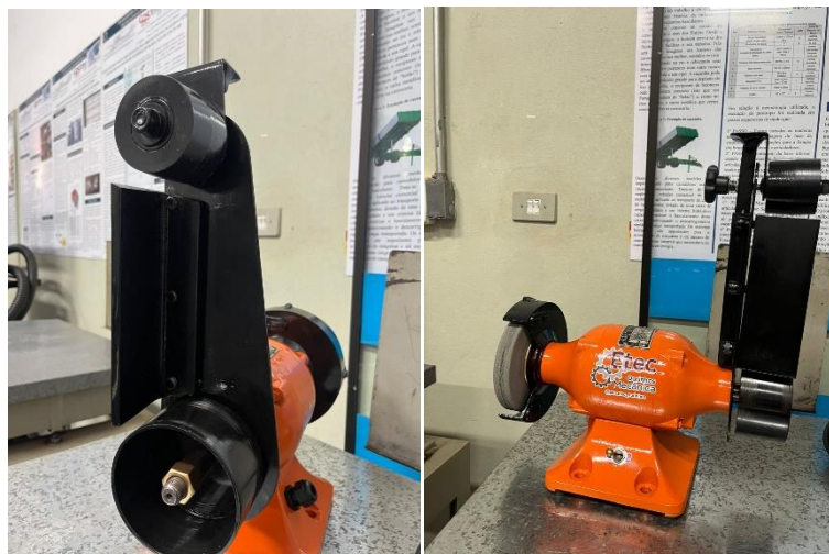
Figura 13: Lixadeira por cinta (completa)

Etec Jacinto Ferreira de Sá 066 – Ourinhos/SP