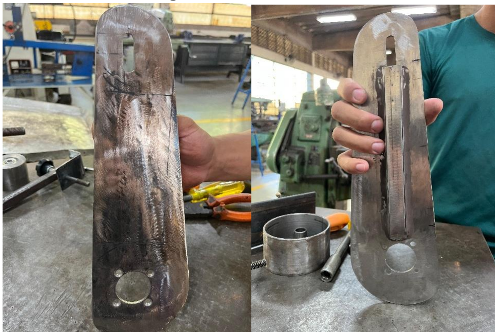
Figura 9: Estrutura da base

A estrutura da base foi confeccionada em aço carbono, com fixação do motor realizada por quatro furos de diâmetro 5 mm, dispostos em espaçamento de 33,6 mm na altura e 33,6 mm no comprimento, assegurando rigidez estrutural e estabilidade operacional ao conjunto.