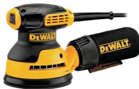
Figura 3: A lixadeira roto-orbital (ou excêntrica)