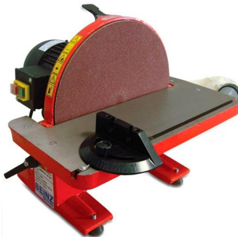
Figura 4: A lixadeira de disco

A lixadeira de disco utiliza um disco abrasivo fixado a um prato giratório, sendo ideal para trabalhos de precisão, rebarbarão de peças metálicas e correção de ângulos. Suas vantagens são a alta precisão e estabilidade, permitindo lixamento em ângulos controlados. Como desvantagem, possui área de trabalho limitada e é indicada apenas para peças pequenas. É bastante empregada em ferramentarias, oficinas mecânicas e laboratórios de prototipagem.