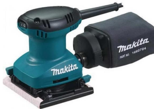
Figura 2: A lixadeira orbital