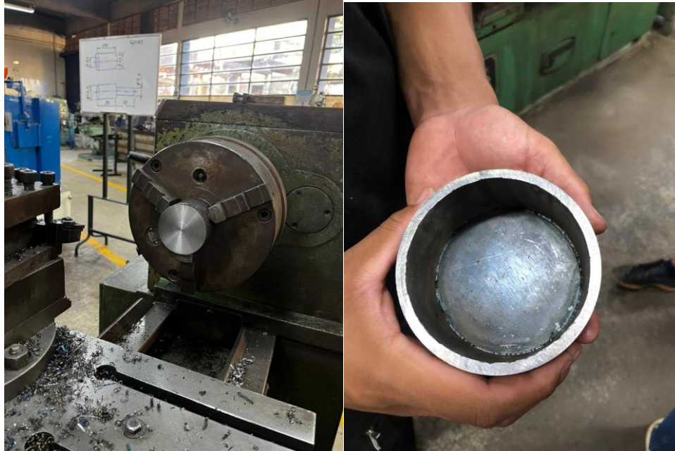
Figura 6: Polia maior