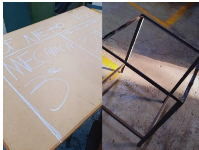
Figura 9 – Estrutura de apoio

O tampo da mesa foi dimensionado e cortado em chapa de madeira. E foi utilizada uma estrutura de ferro como apoio estrutural.