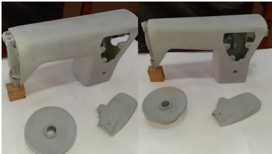
Figura 14 – Preparação para pintura da máquina

Acabamento nas peças internas e externas da estrutura da máquina. Tratamento de Superfície e Acabamento Para garantir a durabilidade e a proteção contra corrosão, os componentes fabricados e a carcaça da máquina foram preparadas.