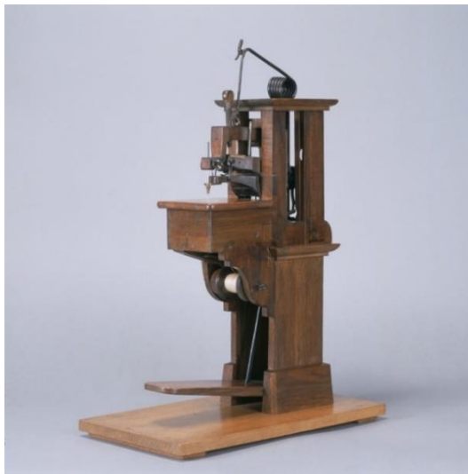
Figura 2 – Máquina de Costura de Barthélemy Thimonnier