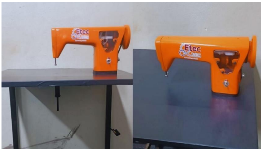
Figura 16 – Máquina Serra Tico-Tico de Bancada

Realizou-se a montagem final de todos os componentes mecânicos e a instalação do sistema elétrico, incluindo o pedal de controle de velocidade. Foram conduzidos testes de funcionalidade para verificar a cinemática e, por fim, testes de corte em diferentes materiais (MDF, madeira maciça e acrílico) para validar o desempenho, a precisão e a segurança do protótipo.