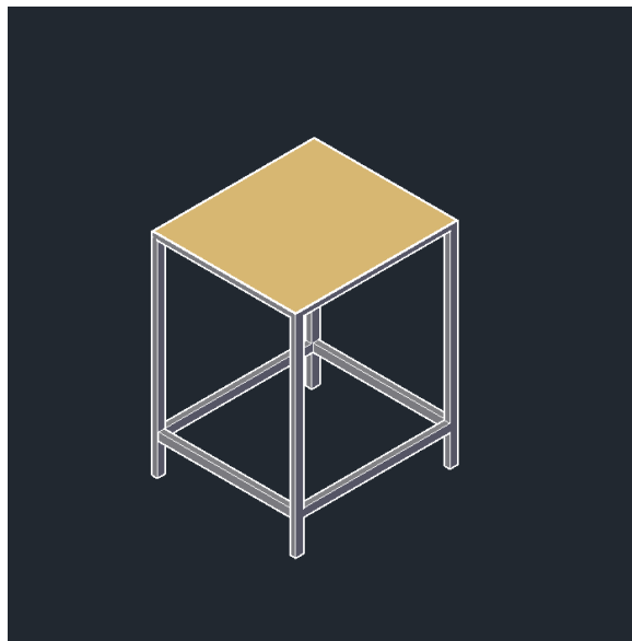
Figura 7 – (AutoCAD - 3D) Estrutura de Apoio da máquina

Foram realizados o projeto conceitual e o detalhamento técnico no software (AutoCAD). Esta etapa foi crucial para definir as dimensões da bancada, os pontos de fixação da máquina e definido o tamanho da tábua de Madeira. Importante destacar que utilizamos a (figura 5 – mecanismos de uma máquina de costura) para ampliar a visualização do tamanho da máquina de costura e os mecanismos internos necessários, como o sistema biela-manivela.