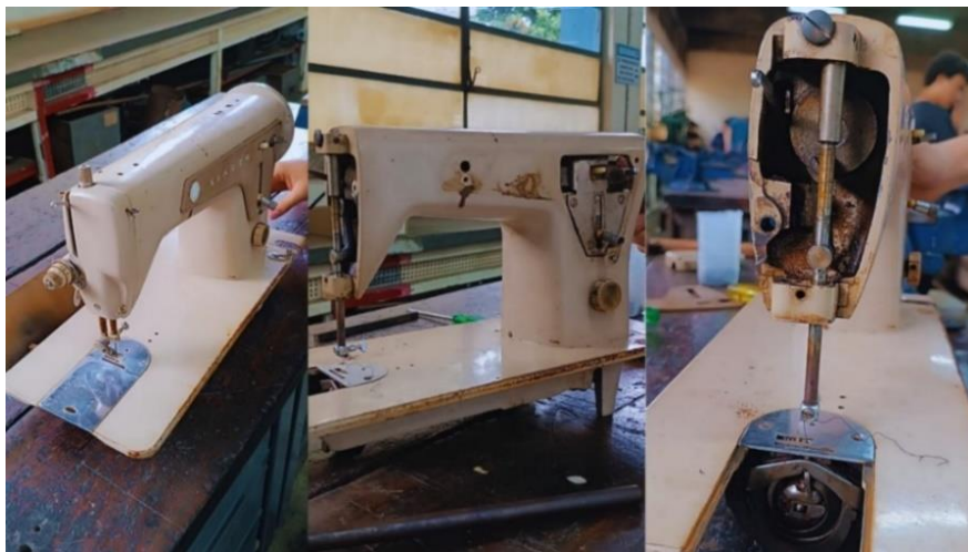
Figura 8 – Desmontagem da máquina de costura

Iniciou-se a desmontagem técnica da máquina de costura. Foram removidos todos os componentes não essenciais ao movimento alternado, como o sistema de alimentação do tecido, a agulha e a base original. O cabeçote, contendo o eixo principal e o mecanismo biela-manivela, foi preservado. Concluiu-se com o desengraxar e limpeza técnica dos mecanismos internos para inspeção.