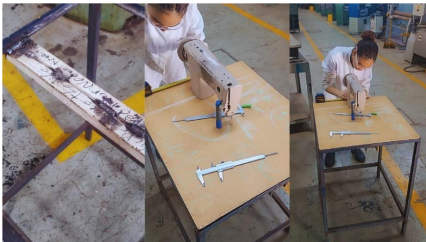
Figura 11 – Soldagem e medição da estrutura de apoio

Foi soldado as bordas das cantoneiras na estrutura de ferro, depois fixado a tábua de madeira e parafusado as laterais para fixação com porcas e parafusos. Posteriormente, fixamos a máquina e dimensionamos o centro para passagem da Serra.