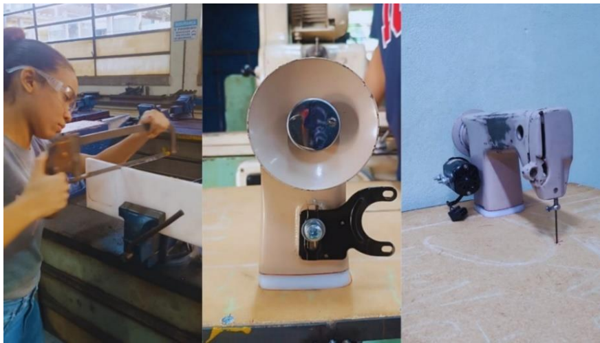
Figura 12 – Fixação da estrutura da máquina de costura

Para garantir a ergonomia correta e absorver vibrações, foi usinada uma chapa de polietileno que serviu como calço de altura para a máquina. O suporte do motor foi fixado à carcaça. Posteriormente, foi feito o furo no centro para a passagem da serra e o motor elétrico foi acoplado.