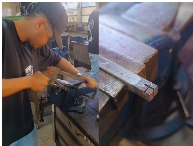
Figura13 – Corte da barra de transmissão do braço acionador

Fabricação do Sistema de Acionamento da Lâmina Foi usinada a barra de transmissão (braço acionador), componente que conecta o mecanismo biela-manivela original da máquina à nova lâmina de serra.