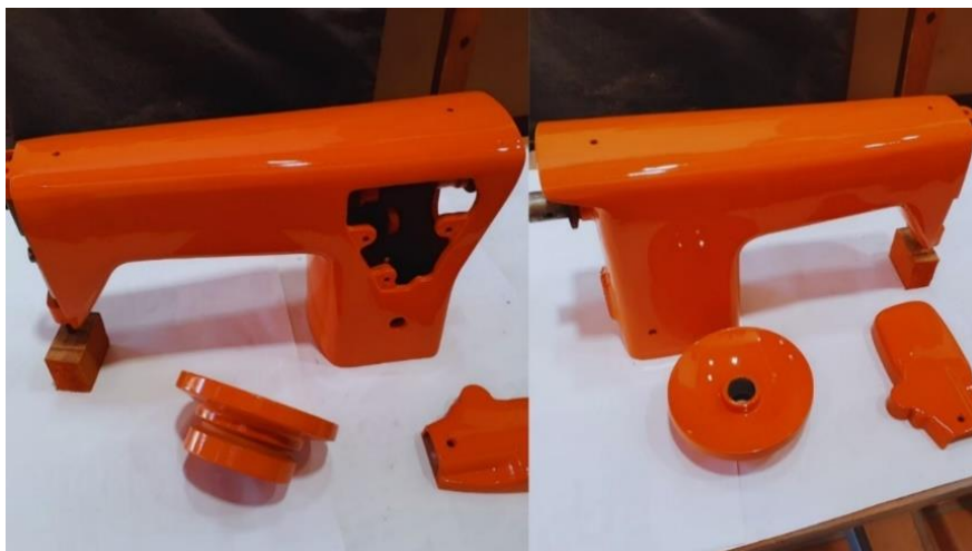
Figura 15 – Pintura da máquina

foi realizada a pintura de acabamento (tinta na cor laranja), conferindo proteção final e estética profissional ao equipamento. Além disso, a estrutura de apoio da mesa também foi pintada e o Braço Oscilador foi soldado.