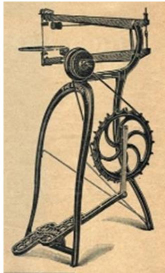
Figura 1 – Primeira patente Serra Tico-tico de Bancada