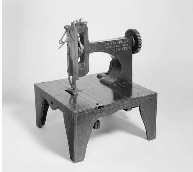
Figura 4 – Máquina de Costura de Isaac Singer