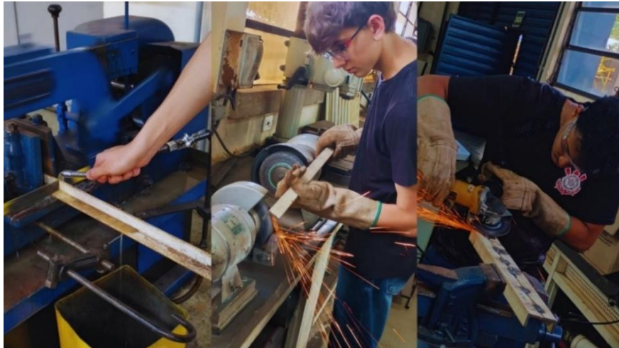
Figura 10 - Preparação das Cantoneiras

Os perfis metálicos (cantoneiras) foram cortados nas dimensões do projeto utilizando serra de fita. As extremidades foram, então, preparadas por esmerilhamento e lixamento.