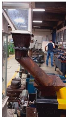
Figura 8 – Implementação de uma bica no sistema.

Por fim, a bica também contribuiu para a padronização do sistema e para a facilidade de manutenção. Por ser uma peça simples, de baixo custo e fácil fabricação, sua inclusão demonstrou que soluções práticas podem gerar grandes impactos na eficiência geral do conjunto. Sua aplicação no projeto evidenciou a importância de uma engenharia voltada à funcionalidade e à melhoria contínua, tornando o processo de transporte de grãos mais eficiente, limpo e tecnicamente aprimorado.