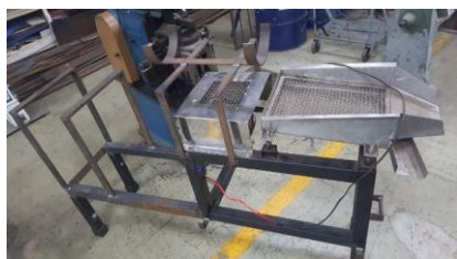
Figura 6 – peneira vibratória

Suas vantagens no processo são a eficiência e precisão permitindo a separação eficiente das partículas, garantindo uma alta qualidade e conformidade dos produtos finais, também é um equipamento muito versátil podendo se adaptar e utilizar em diversas aplicações industriais com diferentes tipos de materiais.