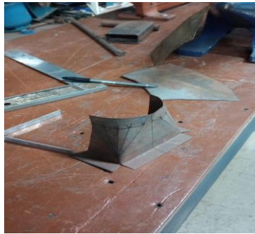
Figura 2 – planificação chapa 20,quadrado para redondo