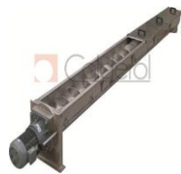
Figura 5– transportado vertical helicoidal

Além de seu design funcional, a rosca transportadora helicoidal se destaca pela facilidade de instalação e manutenção, bem como por sua capacidade de operar em ângulos inclinados e horizontais. Isso a torna uma escolha popular entre engenheiros e profissionais que buscam eficiência no transporte de materiais.