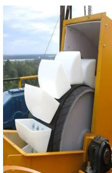
Figura 3 – elevador de caneca

tipo adequado depende das características do material a ser transportado, da capacidade de carga necessária e de outros requisitos específicos da aplicação. A manutenção regular do equipamento também é essencial para garantir seu funcionamento confiável e seguro.