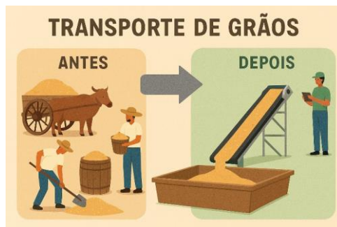
Figura 7 – Modernização no processo de transporte de grãos

Portanto, a linha transportadora de grãos representa um marco importante na modernização das indústrias agrícolas e alimentícias, tornando o processo mais sustentável, econômico e eficiente, além de garantir maior qualidade no produto final.