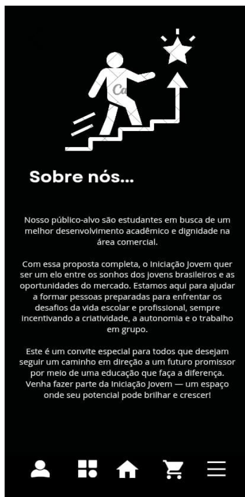
Figura 4 – Interface