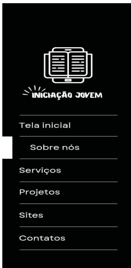
Figura 3 – Interface