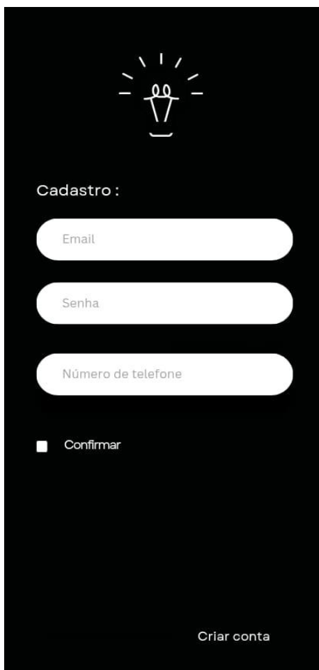
Figura 2 – Interface

de 15 a 21 anos. Com cursos digitais, o projeto auxilia os alunos a alcançarem bons resultados tanto na escola quanto no mercado de trabalho.