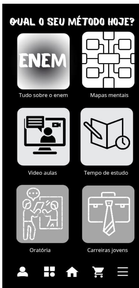
Figura 5 - Interface

aplicativo) proporciona acesso rápido e adaptado a diferentes condições de internet, incluindo recursos de gamificação e certificação para incentivar a conclusão dos estudos. Além disso, disponibiliza orientação para elaboração de currículos, dicas para entrevistas e conexão com oportunidades de emprego e estágio.