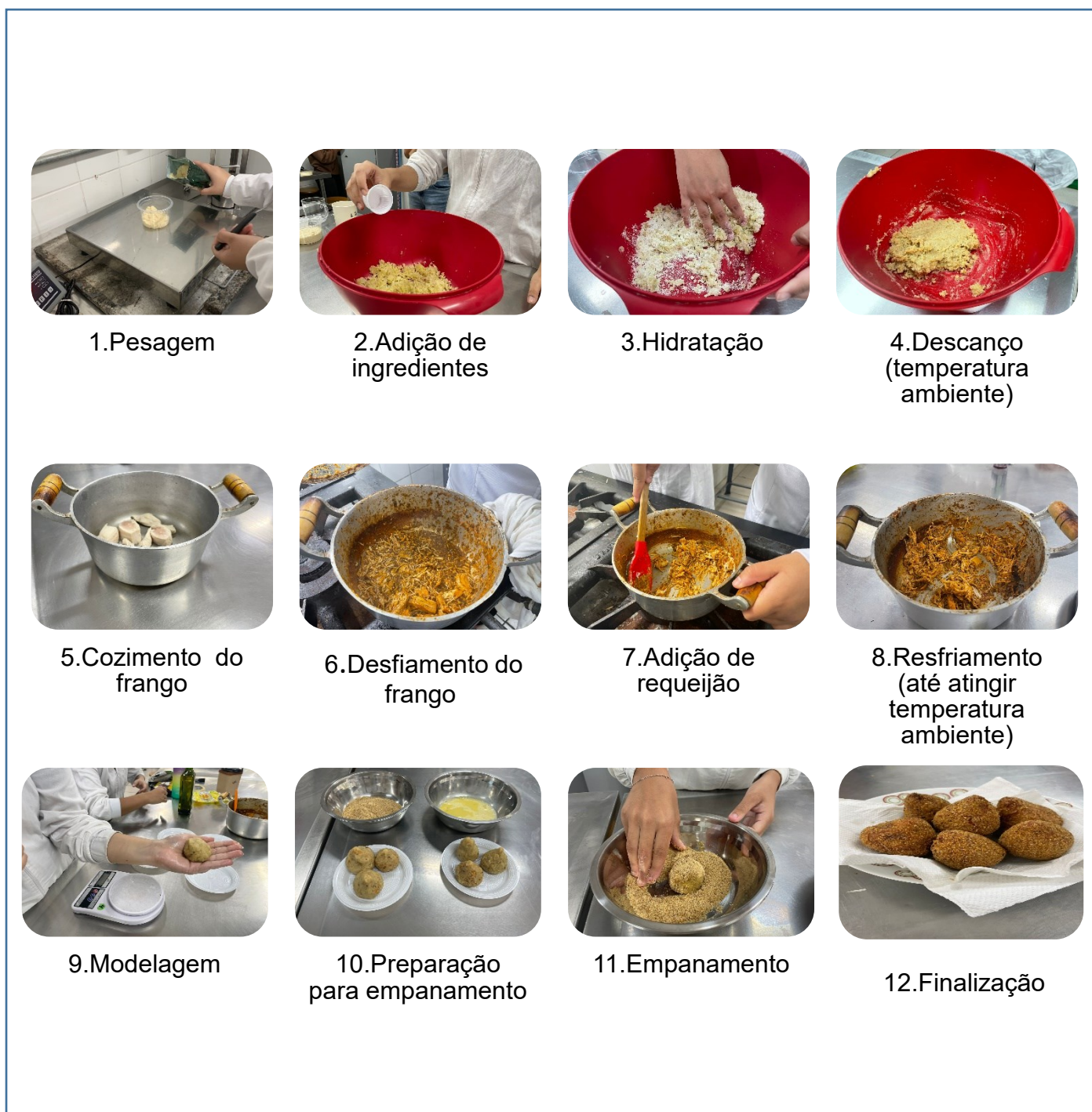
Fluxograma1. Processo de Produção de Coxinha com Adição de Proteína Isento de Glúten.

A seguir apresenta o fluxograma do processo de desenvolvimento das coxinhas sem glúten com adição de proteínas, evidenciando de forma sequencial e padronizada as etapas técnicas envolvidas na formulação do produto.