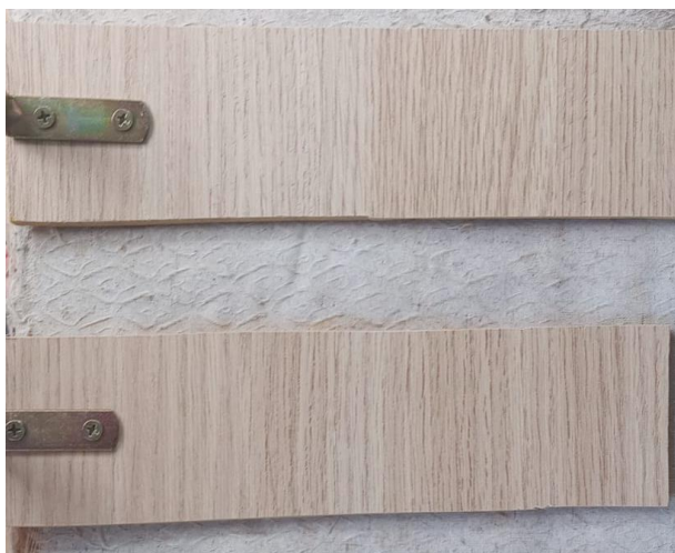
Figura 2 - Hastes com Cotoveleira