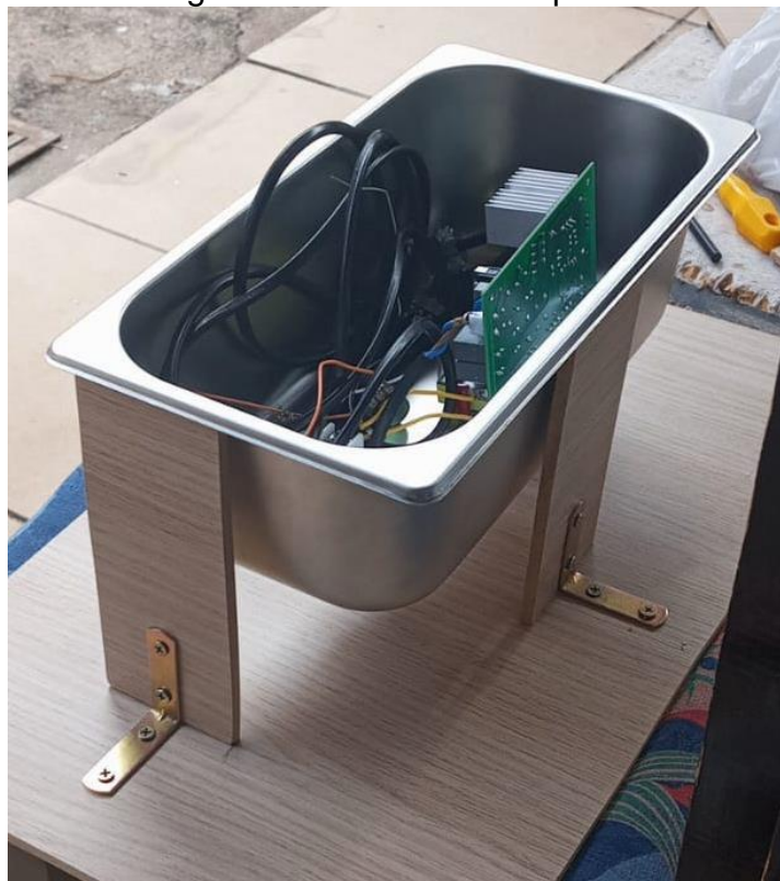
Figura 3 - Base com 3 Suportes

Depois de colocada a cuba a cima do suporte percebemos que ela estava bamba, então decidimos colocar mais uma haste na parte de trás da base para que ficasse tudo devidamente fixado.