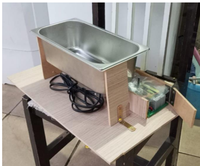
Figura 4 - Cuba Completa