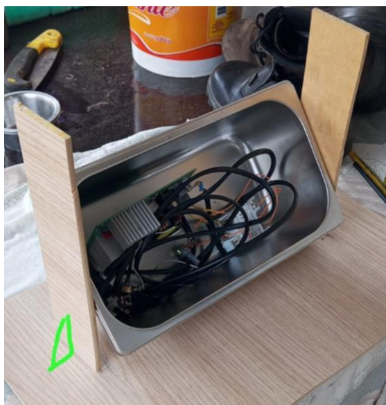
Figura 1 - Cuba apoiada

Para isso houve a necessidade de pensarmos em uma forma de deixa-la suspensa, o qual resolvemos colocando duas hastes de madeira apoiadas por cotoveleiras de suporte