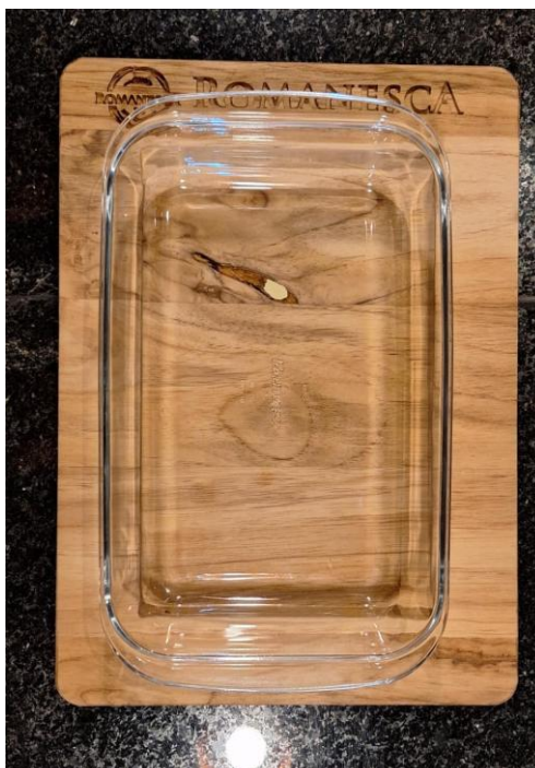
Figura 1 – Nova tabúa de madeira personalizada com a logo do restaurante Romanesca

Além disso, foram produzidas tábuas de madeira personalizadas com a logomarca do restaurante, fortalecendo a identidade visual agregando valor estético e funcionalidade ao serviço. A personalização de produtos e utensílios contribui diretamente para a construção de uma marca forte e uma experiência memorável (JAIN; RAI, 2024).