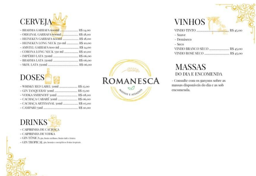
Figura 2 – Cardápio de cerveja, doses, drinks, vinhos e massas do dia e/ou encomendas