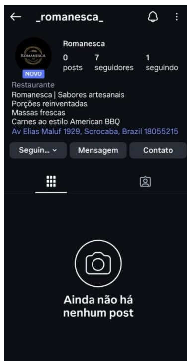
Figura 2 – Novo Instagram