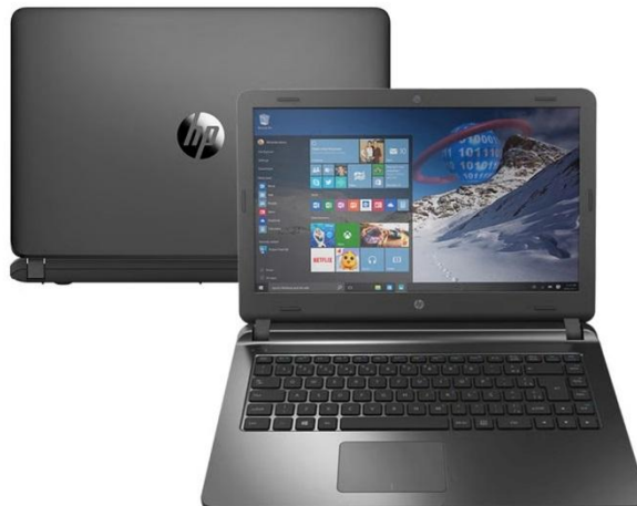
Figura 2 – Notebook HP 14-ap020