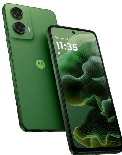
Figura 1 – Celular Motorola Moto G35 5G

As melhorias implementadas abrangeram desde a aquisição de equipamentos até a reorganização de processos internos. Uma das primeiras iniciativas foi a compra de um celular de uso exclusivo para o restaurante, bem como de um notebook próprio. Essa separação entre os recursos pessoais e os profissionais possibilitou maior organização e comprometimento na administração do negócio.