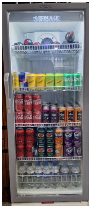
Figura 1 – Geladeira de bebidas reorganizada

No que se refere à organização interna, os estoques e as geladeiras de bebidas foram reorganizados, resultando em maior praticidade nas rotinas operacionais, melhor conservação dos produtos e redução de desperdícios. A correta gestão de estoques é essencial para o controle de perdas, aumento da eficiência e sustentabilidade do negócio (SOUZA et al., 2024).