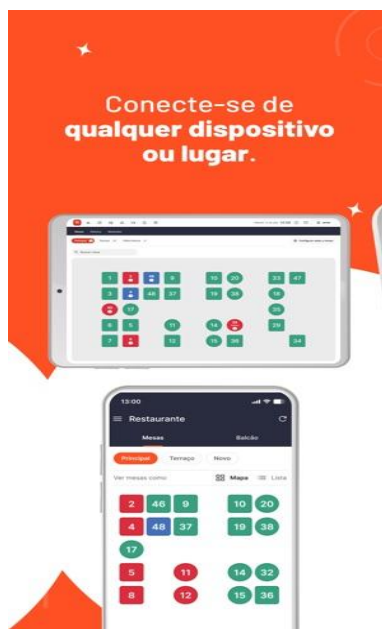
Figura 1 – O sistema gastronômico Deli é um software online para administrar instalações gastronômicas

Outra melhoria importante foi a substituição do sistema de gestão. O restaurante deixou de utilizar o sistema “Deli” e passou a utilizar o “Consumer”, que oferece recursos mais avançados, como emissão de notas fiscais, controle de pedidos via delivery e organização das comandas de mesa. A adoção de tecnologias de gestão facilita o monitoramento das operações, contribuindo para maior agilidade e segurança nas atividades diárias (LI et al., 2024).