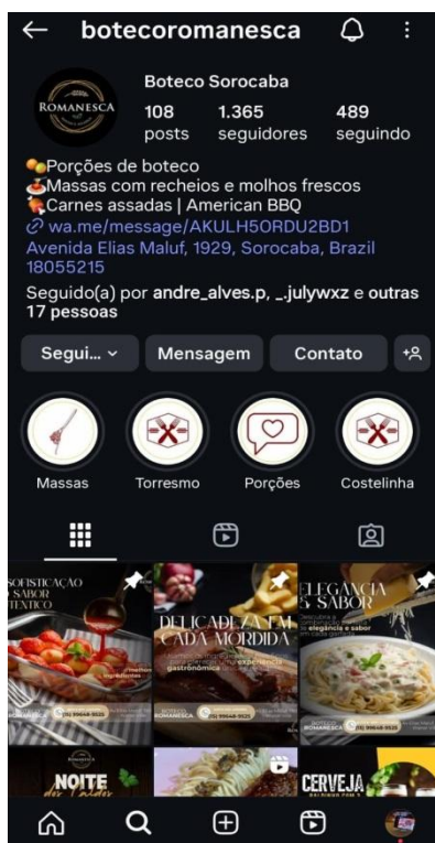
Figura 1 – Antigo Instagram