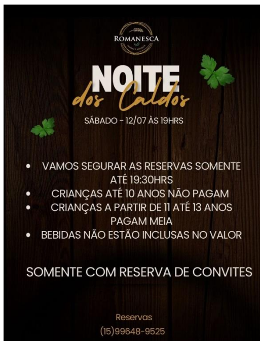
Figura 2 – Noite dos caldos