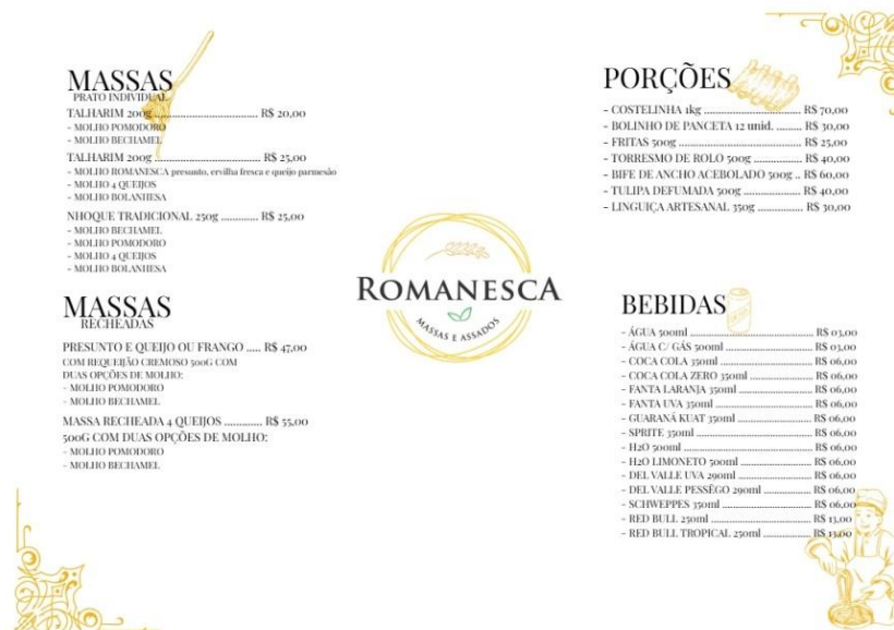
Figura 1 – Cardápio de massas individuais, massas recheadas, porções e bebidas