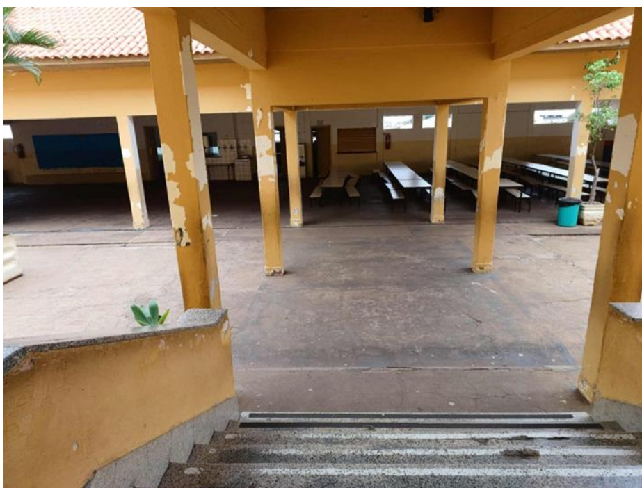
Figura 8 – Escada para acesso do prédio da instituição