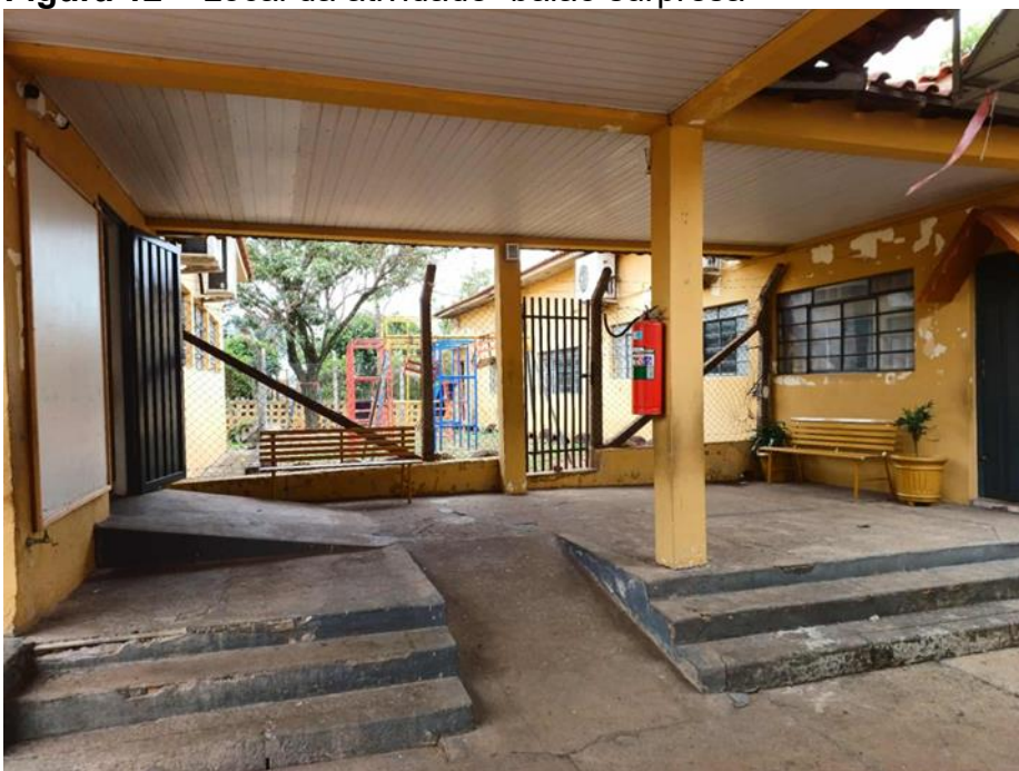
Figura 12 – Local da atividade “balão surpresa”