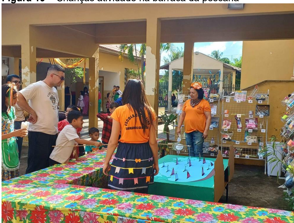
Figura 19 – Crianças atividade na barraca da pescaria