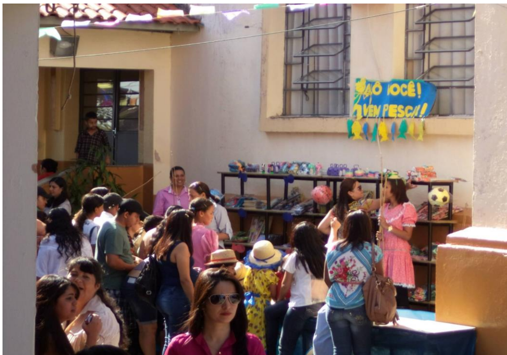
Figura 3 – Barraca de brincadeiras – Festa Junina 2013