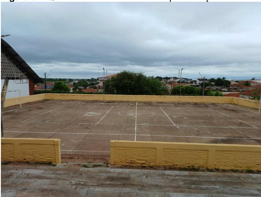
Figura 9 – Quadra onde serão feitas as apresentações