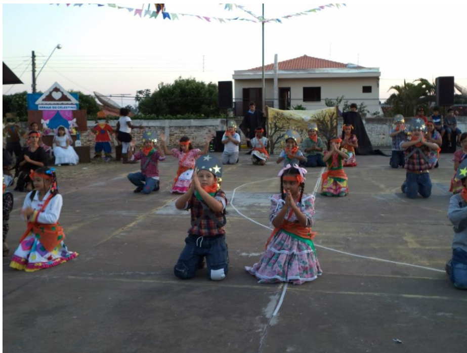
Figura 1 – Dança temática – Festa Junina 2013