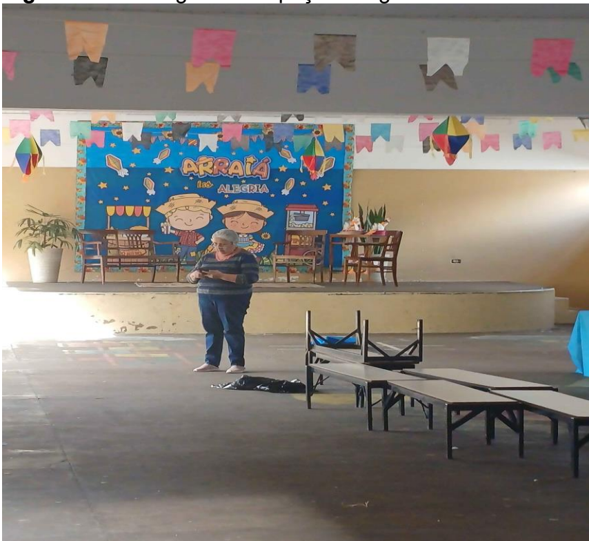
Figura 15- Montagem do espaço instagramável