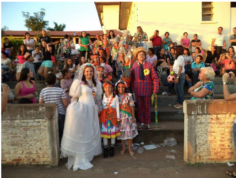
Figura 2 – Dança temática – Festa Junina 2013