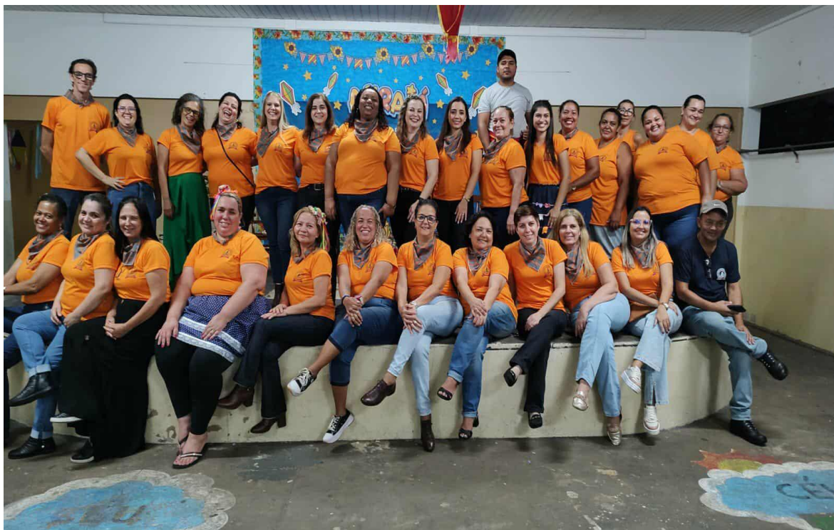
Figura 24 – Funcionários e professores – Comissão organizadora do evento

permitindo que a comunidade escolar possa se despedir da Festa Junina com a certeza de que tudo foi feito com carinho e dedicação.