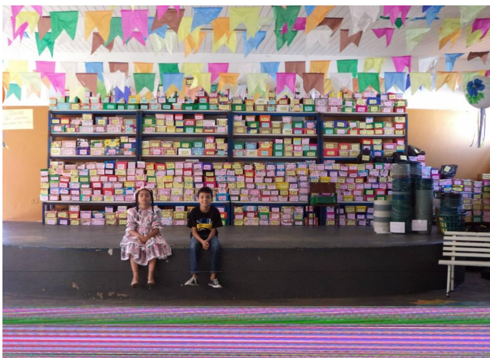
Figura 4 – Festa Junina 2013