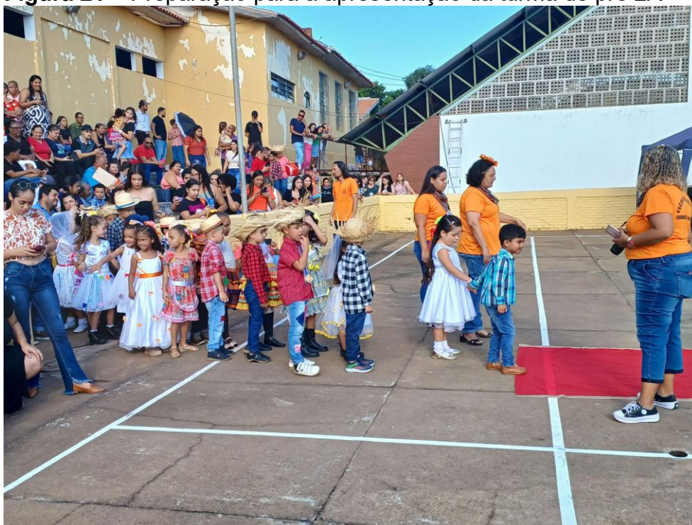
Figura 21 – Preparação para a apresentação da turma do pré 2A