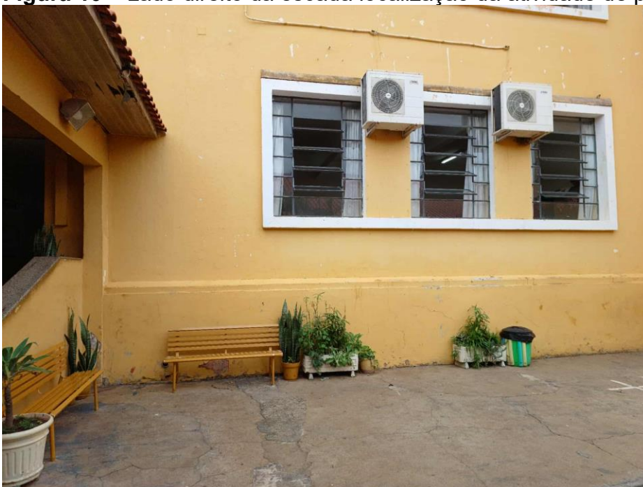
Figura 10 – Lado direito da escada localização da atividade de pesca