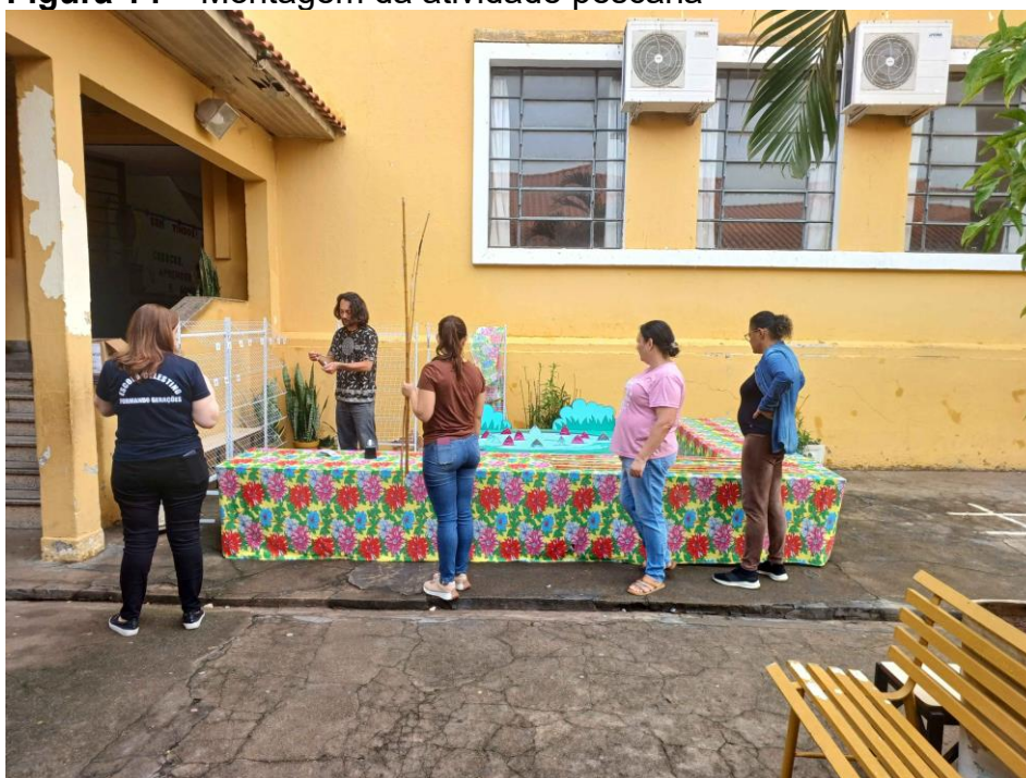
Figura 14 – Montagem da atividade pescaria