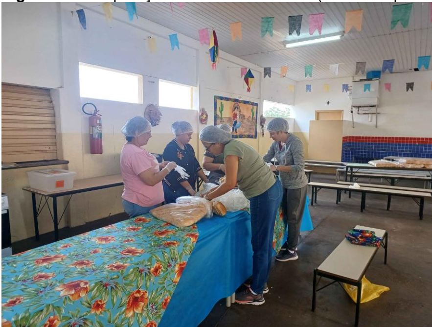
Figura 16 – Preparação barraca de alimento (cachorro-quente)