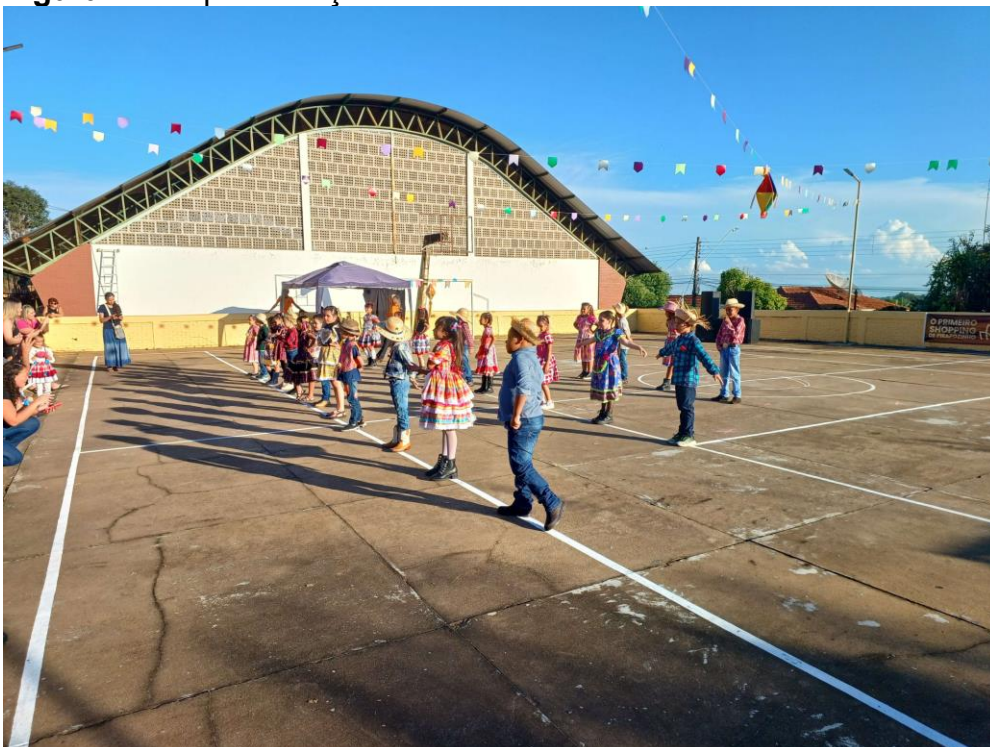
Figura 22 – Apresentação das turmas dos 1º anos