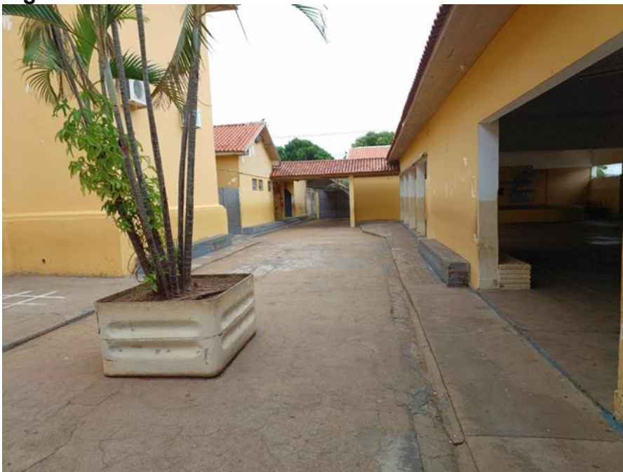
Figura 6 - Pátio externo da escola