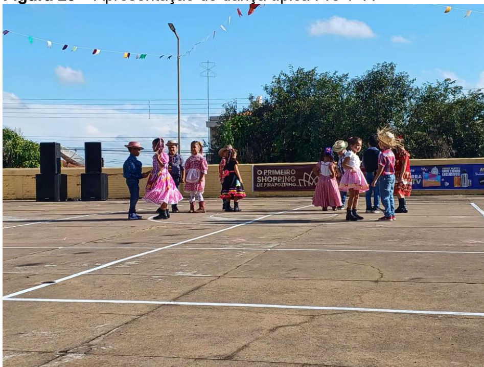
Figura 20 – Apresentação de dança típica Pré 1- A