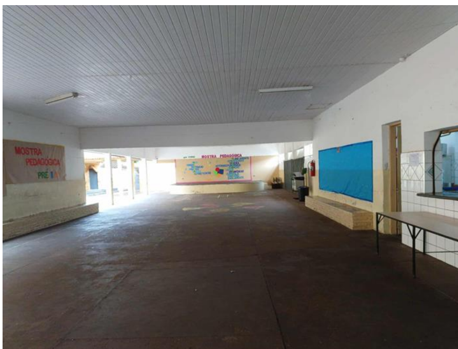
Figura 5 - Pátio da escola

Durante os dias que antecedem o evento, a escola se transforma com os preparativos, principalmente com os ensaios de danças típicas com as diferentes turmas e séries que compõem o quadro de alunos. As atividades são realizadas no pátio principal (barracas) e quadra (atrações musicais), porém toda a escola acolhe os convidados, que muitas das vezes são ex-alunos que já participaram em anos anteriores.