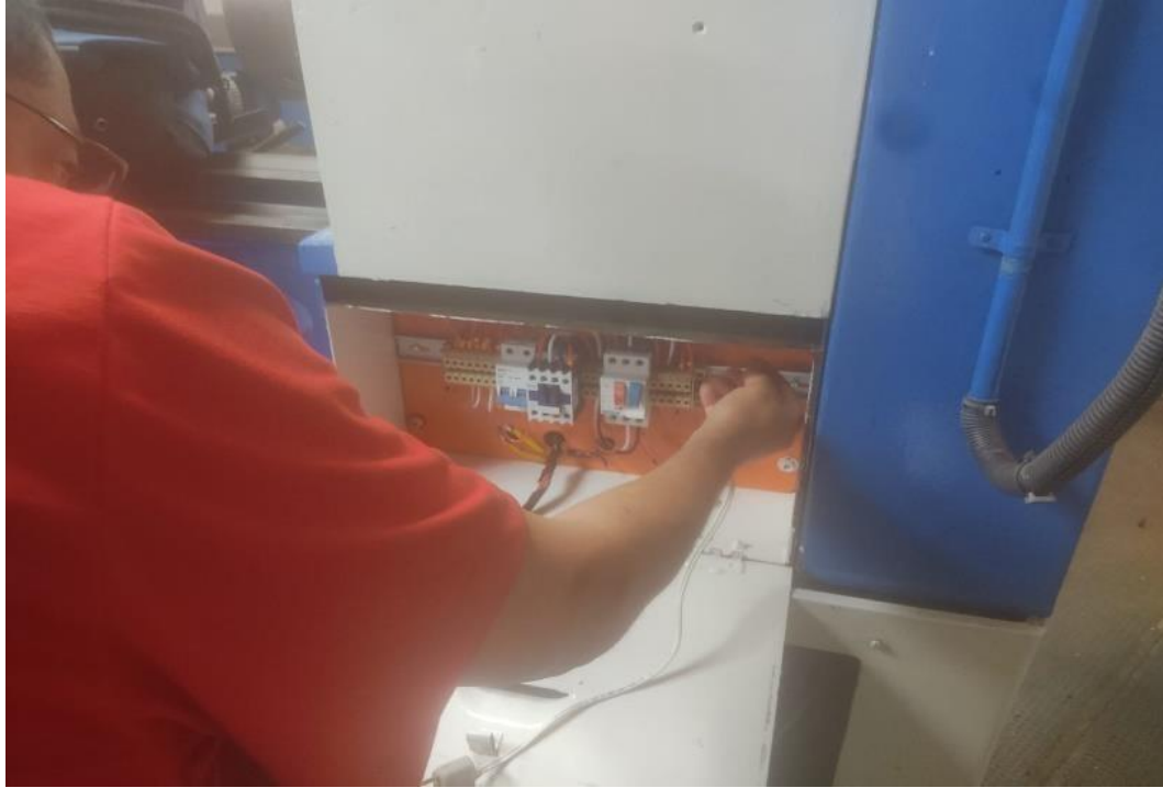
Figura 6 – Montagem do painel