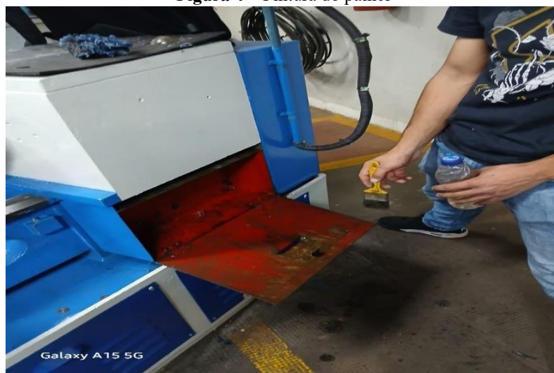
Figura 4 – Pintura do painel

• Passo 3: Nessa etapa foi realizada a reforma estética do painel de comando do torno, com foco na limpeza, lixamento e pintura manual da estrutura. A tinta foi aplicada com pincel e rolo, garantindo boa cobertura e acabamento uniforme. Foram aplicadas duas demãos de tinta, resultando em uma superfície protegida, durável e visualmente aprimorada.