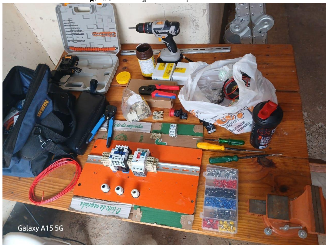
Figura 5 – Montagem dos componentes elétricos