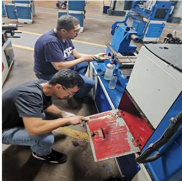
Figura 3 – Reforma do painel