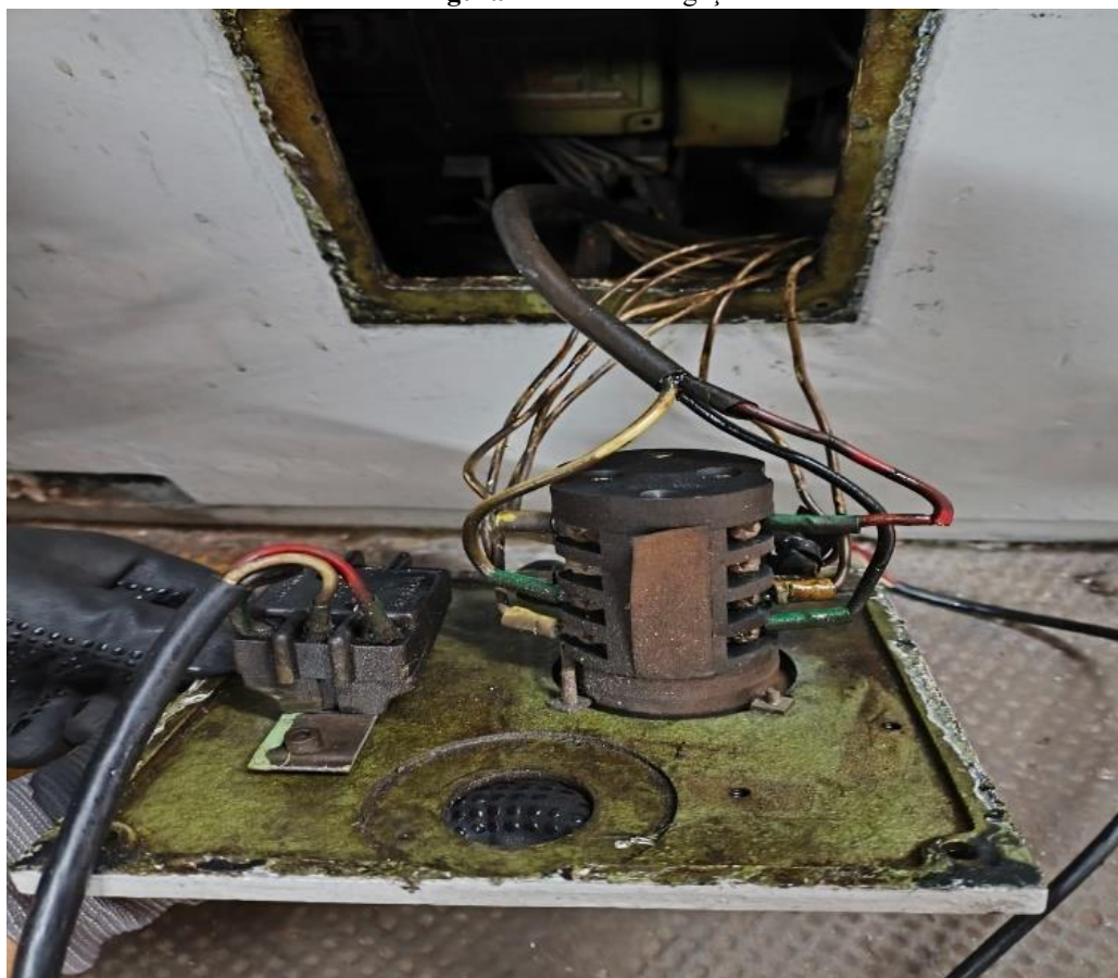
Figura 1 – Modo de ligação do torno

Abaixo será descrito como foi o passo a passo da reforma do torno, desde a montagem do diagrama de potencia, até a montagem do painel no painel no torno e funcionamento.