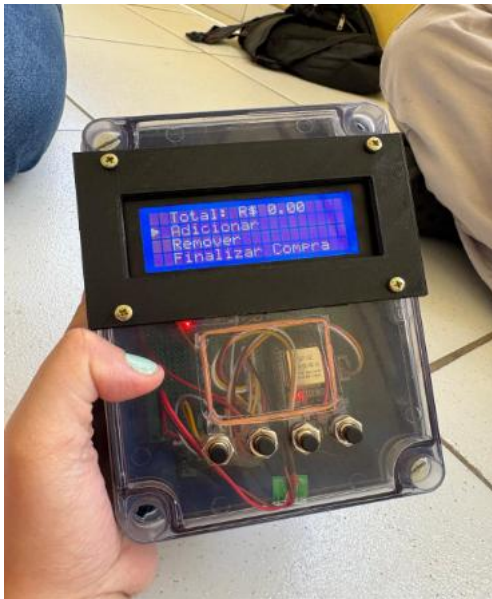
Figura 1- Arquitetura do sistema eletrônico já finalizada.