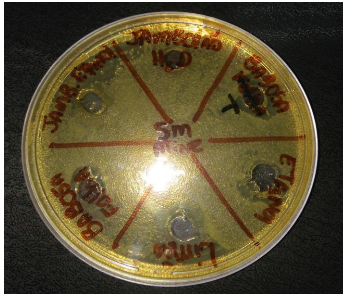
Figura 5- Placa resultante

evaporação e liofilização devido à indisponibilidade dos aparelhos, assim optou-se a realizar o experimento como o filtrado mesmo, tendo o cuidado de utilizar o etanol como controle, para evitar falsos positivos, uma vez q o solvente utilizado no processo de maceração poderia interferir nos resultados. Assim, o filtrado foi adicionado diretamente nas placas contendo os micro-organismos, porém não foi observado resultado positivo (Figura 5).