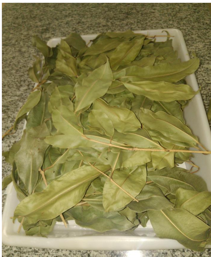
Figura 2 – Obtenção das espécies vegetais

As folhas obtidas a partir das arvores de jambolão ( Syzyium cumini ) cultivadas em Jaboticabal SP, coletadas em Fevereiro de 2019 (Figura 2). Foram picadas as folhas e deixadas em estufa a 60°C por 7 dias (Figura 3).