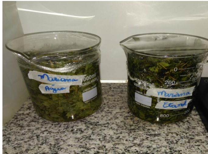
Figura 4 - Extratos vegetais macerados em água e etanol 70%.