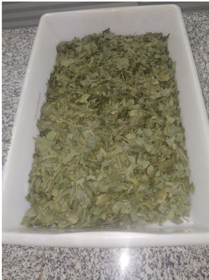
Figura 3 – Folhas picadas