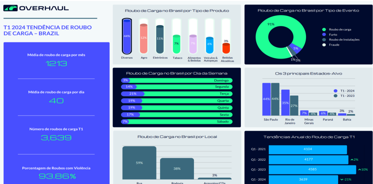
Imagem 2 – Infográfico sobre roubo de carga no Brasil