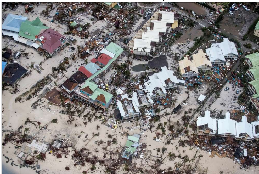
Ilha de Saint Martin , no Caribe

A ilha franco-holandesa foi praticamente arrasada, casas perderam os telhados, ruas ficaram intransitáveis, e o sistema de energia foi comprometido. A paisagem verde da ilha ficou marrom, devido à destruição da vegetação, cerca de 95% da infraestrutura ficou comprometida (wibbitz).