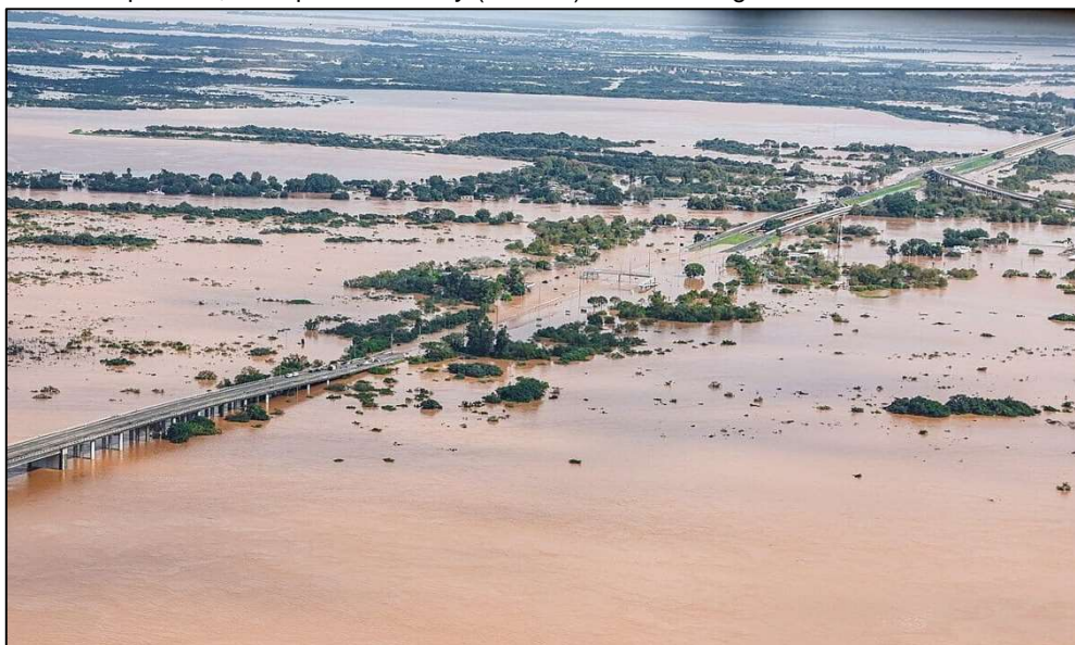
Área metropolitana, via e ponte Freeway (BR-290) de Porto Alegre.

Essa estrada foi fortemente impactada pelas enchentes recentes causadas pela cheia do Lago Guaíba, que atingiu níveis históricos em maio de 2024. A Freeway conecta Porto Alegre ao litoral norte do Rio Grande do Sul e à região metropolitana, sendo uma rota estratégica para o transporte de cargas e deslocamento urbano.