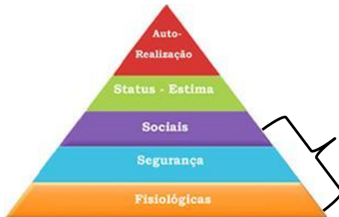
Figura 1 — Pirâmide de Maslow

Os níveis mais afetados quando há assédio num determinado ambiente.