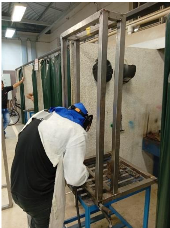
processo de soldagem