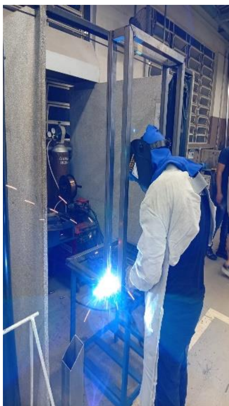
soldagem da estrutura