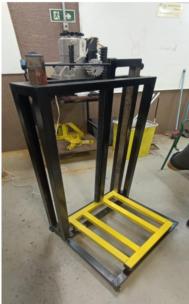
teste de encaixe