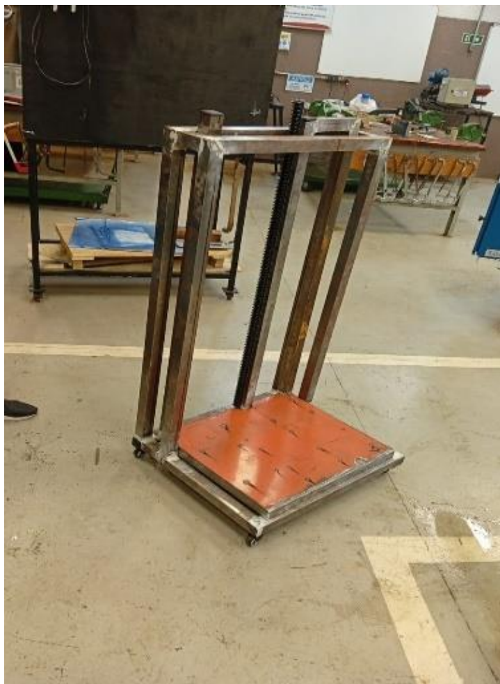
Fonte: Arquivo próprio teste de encaixe