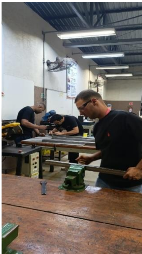
corte dos metalon