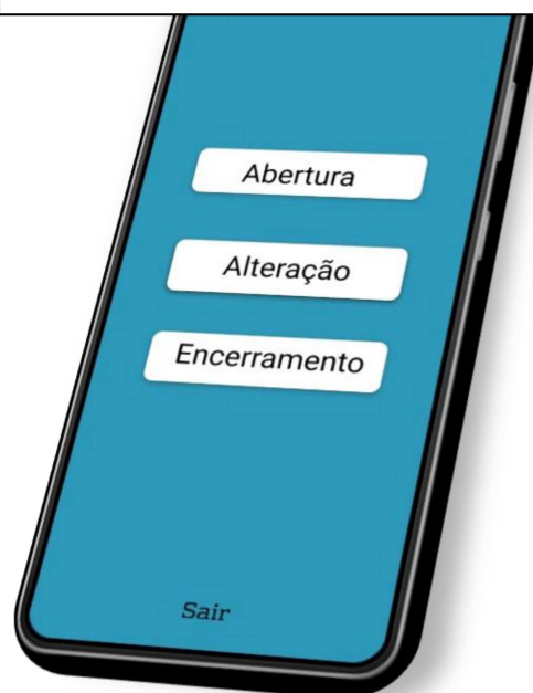
Imagem 3 – Tela de serviços disponíveis para o Contador 2

Os demais botões “Alteração” e “Encerramento” seguem o mesmo raciocínio: links e informações para orientar o contador ou o escritório que estiver acessado essa parte da ferramenta.