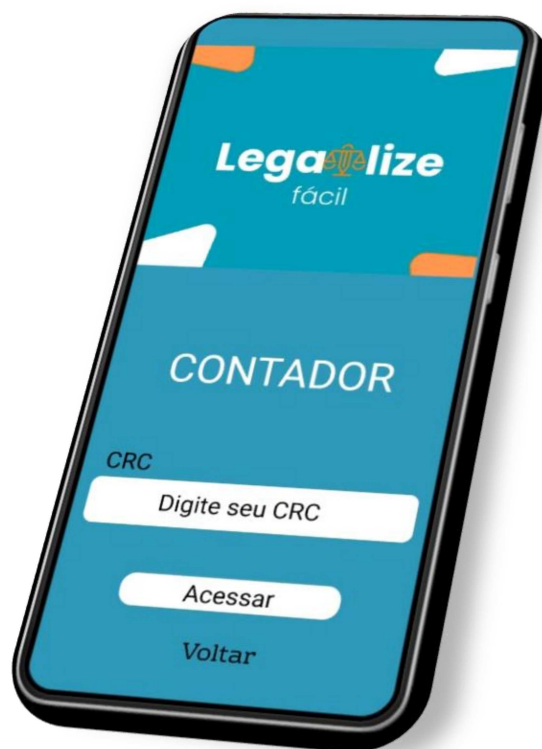
Imagem 2 – Tela de login Contador 2

A tela “Login Contador” é destinada a acesso dos contadores e os escritórios de contabilidade, pois é necessário o CRC para logar. No campo “CRC” o usuário deverá digitar para entrar no aplicativo, caso seja o primeiro acesso ele deverá criar conta na tela anterior a essa no botão “Criar conta”