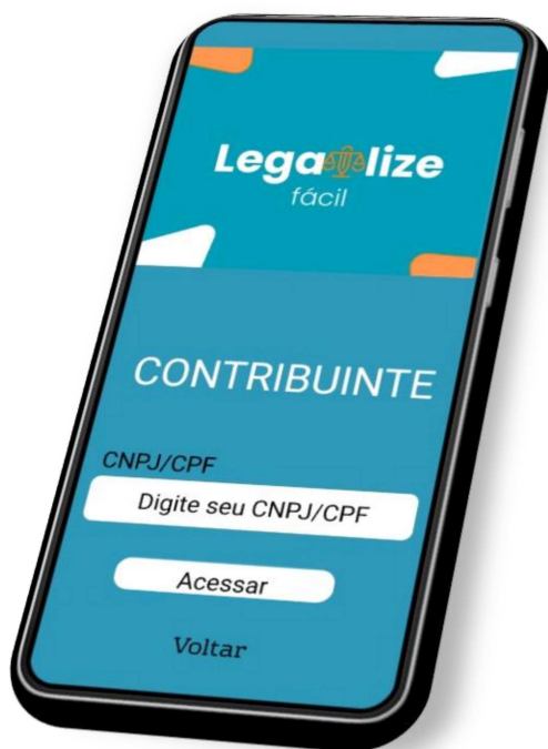
Imagem 4 – Tela de login Contribuinte 2