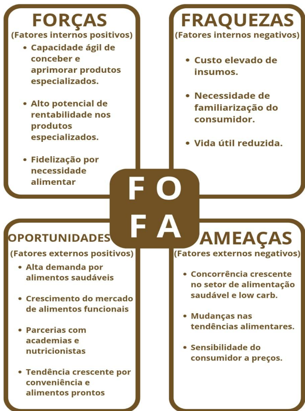
Figura 3 – Matriz F.O.F.A.