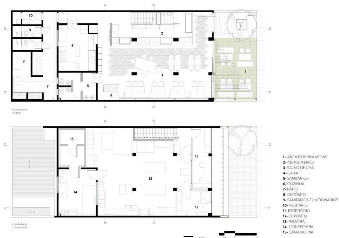
Figura 1 – Layout de padaria utilizado como referência

A Figura 1 apresenta um layout de padaria encontrado no Pinterest/2025, o qual servirá como referência visual para a proposta desenvolvida neste trabalho.