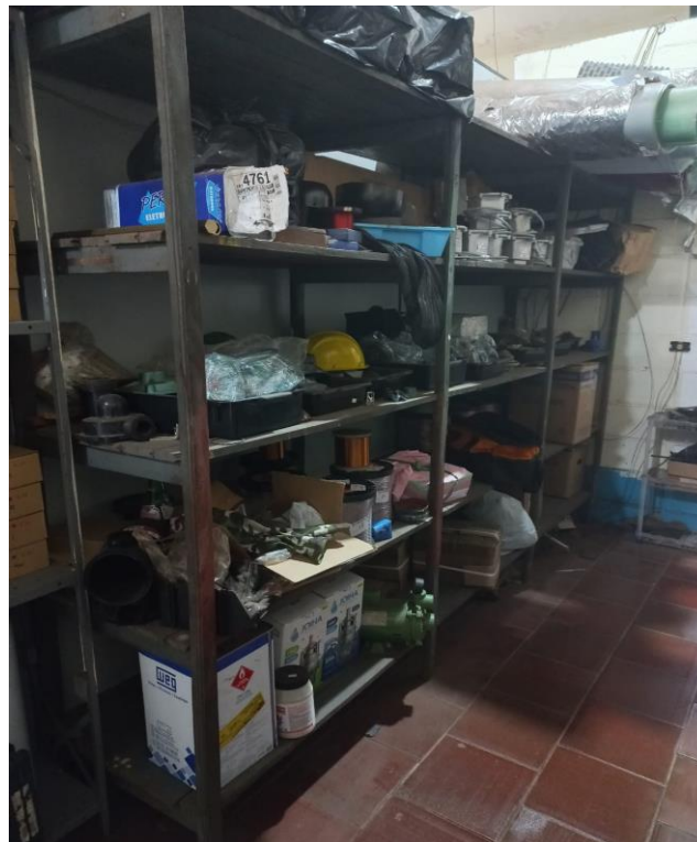
Figura 1 – Prateleira dos estoques antes da aplicação dos 5S

Conforme observado na Figura 1, uma das prateleiras da empresa apresentava falta de organização e acúmulo de materiais diversos, como ferramentas e peças misturadas, o que dificultava a manutenção da ordem no ambiente.