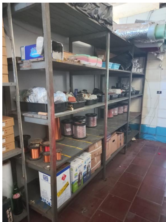
Figura 2 – Prateleira dos estoques após a aplicação dos 5S