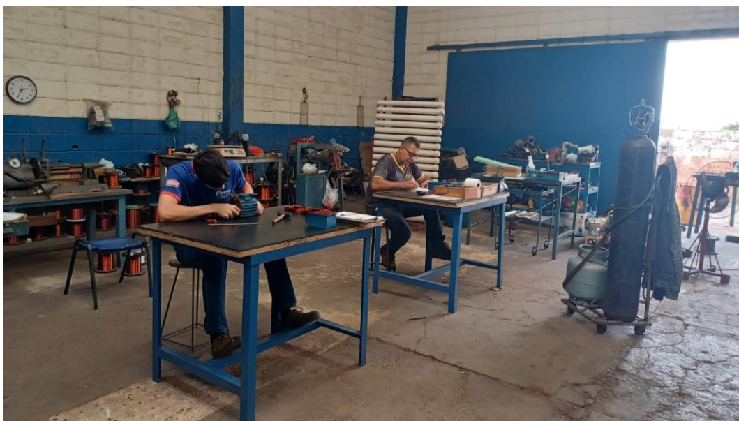
Figura 6 – Novas bancadas instaladas para a padronização do local de trabalho

Conforme apresentado na Figura 6, foram instaladas novas bancadas de trabalho, as quais contribuíram para a melhoria da organização, da produtividade e da disciplina dos colaboradores.