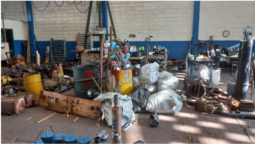
Figura 3 – Ambiente de trabalho antes da aplicação dos 5S