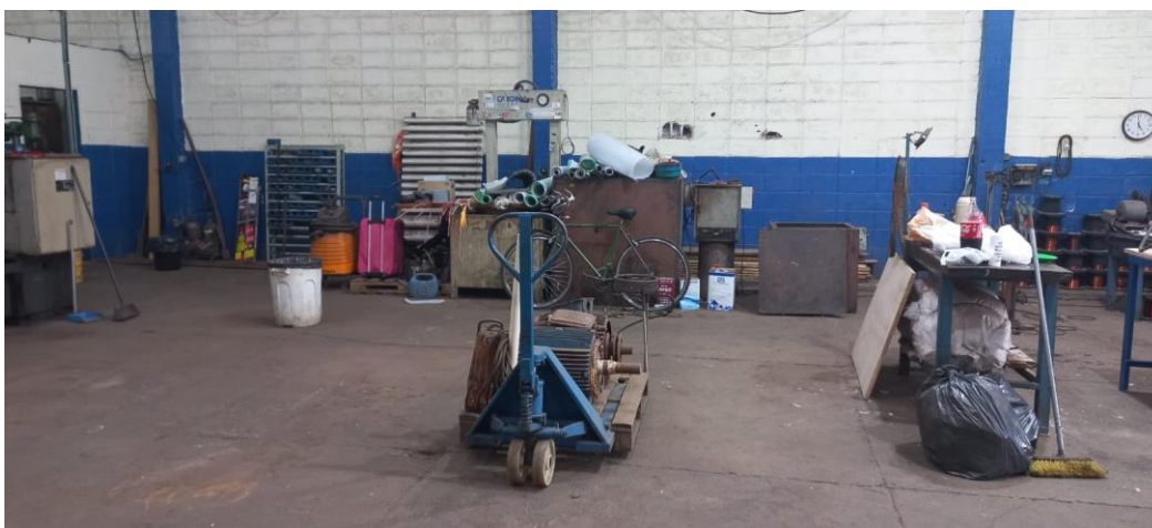
Figura 5 – Ambiente de trabalho após o início da aplicação da técnica dos 5S