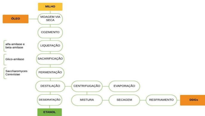
Figura 1 – Produção de etanol de milho via seca