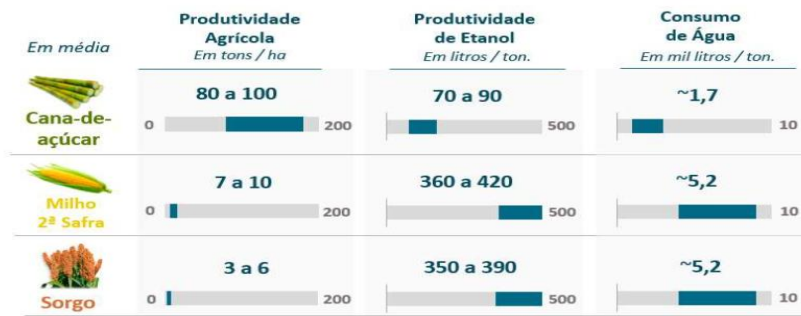
Figura 3 - Fontes de Etanol