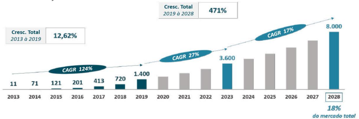
Gráfico 1: Produção e estimativas de etanol de milho 2013 a 2028