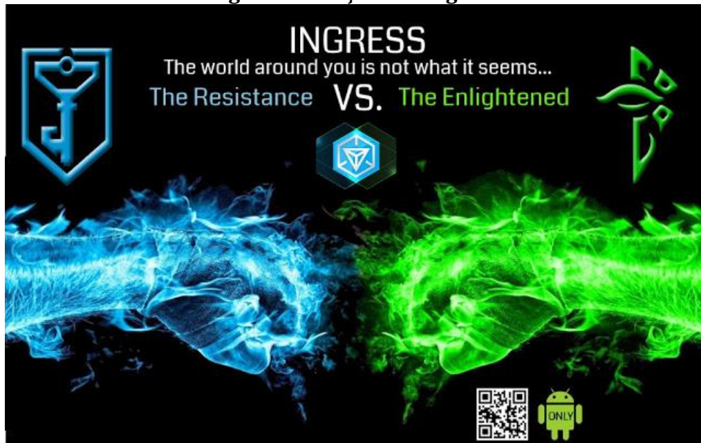
Figura 4 - Facções do Ingress