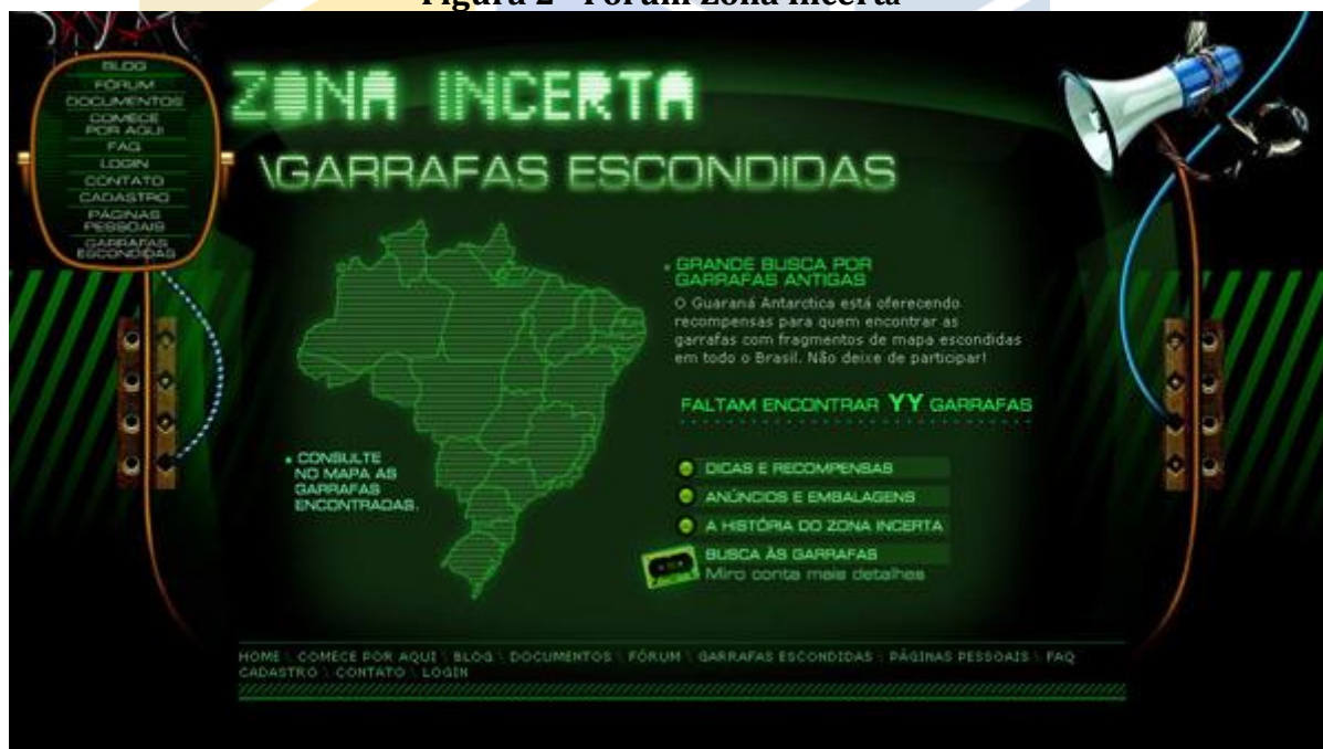
Figura 2 - Fórum Zona Incerta