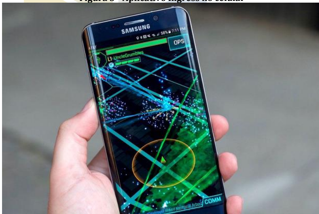
Figura 3 - Aplicativo Ingress no celular