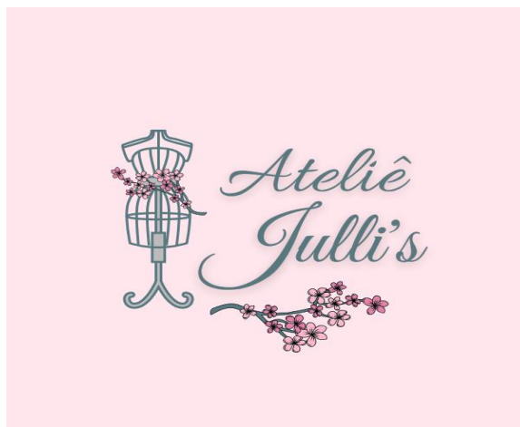
Figura 8 - Logotipo atualizado

Com a atualização, o novo logotipo apresenta um design mais refinado e profissional. Elementos como o manequim estilizado e os detalhes florais, combinados com uma tipografia elegante e cores suaves, destacam a identidade do ateliê, transmitindo delicadeza, criatividade e exclusividade. 8