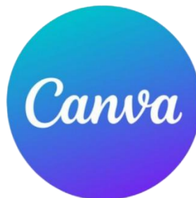
Figura 5 - Logotipo Canva

Melanie Perkins fundou o site e aplicativo Canva, uma plataforma online gratuita de design. O Canva é uma ferramenta essencial para a criação de conteúdo visual atrativo para o Instagram de um ateliê de costura. Com suas opções de templates e elementos gráficos personalizados, é possível criar posts e stories que destacam os produtos, processos e serviços de forma criativa e profissional, mesmo sem experiência prévia em design. A plataforma permite criar imagens que mostram desde detalhes de costura, peças finalizadas, até vídeos e tutoriais rápidos, ajudando a engajar o público, construir a identidade visual do ateliê e aumentar a visibilidade nas redes sociais. Além disso, a facilidade de uso e a diversidade de templates garantem que o conteúdo seja produzido rapidamente, otimizando o tempo e a comunicação com os seguidores. 5