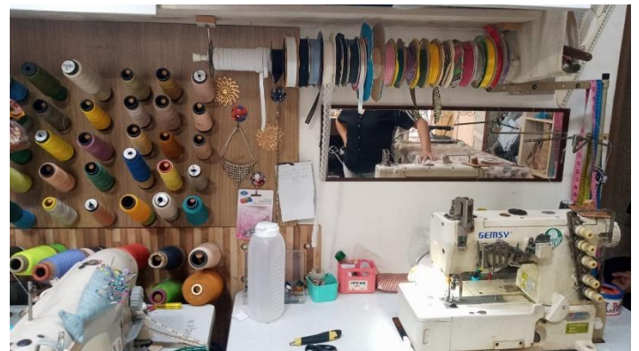
Figura 11 - Insumos depois da implementação do método 5s