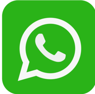
Figura 4 - Logotipo WhatsApp

pedidos em andamento e até mesmo oferecer suporte pós-venda. Uma maneira eficaz de construir relacionamentos com os clientes e oferecer um serviço personalizado. 4