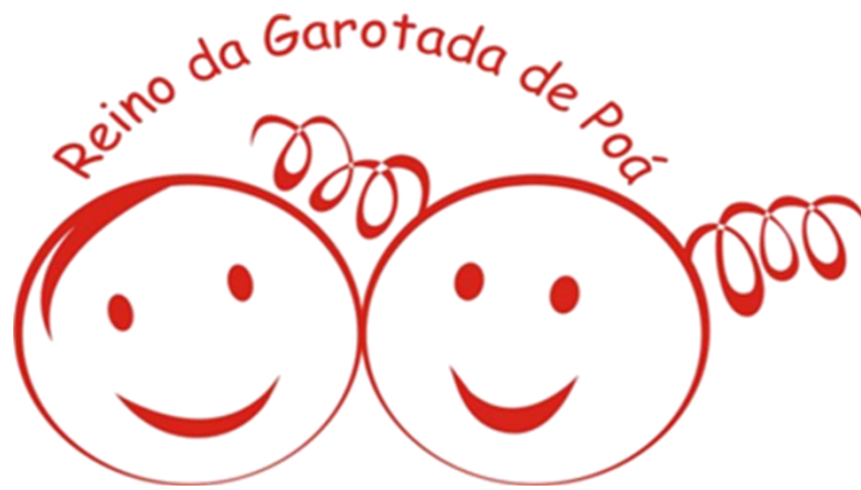
Figura 15 - Logotipo Reino da Garotada de Poá