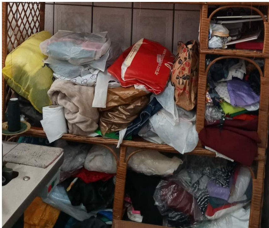
Figura 10 - Insumos antes da implementação do método 5s