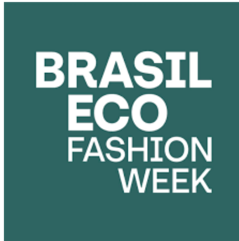
Figura 20 - Logotipo Brasil Eco Fashion Week