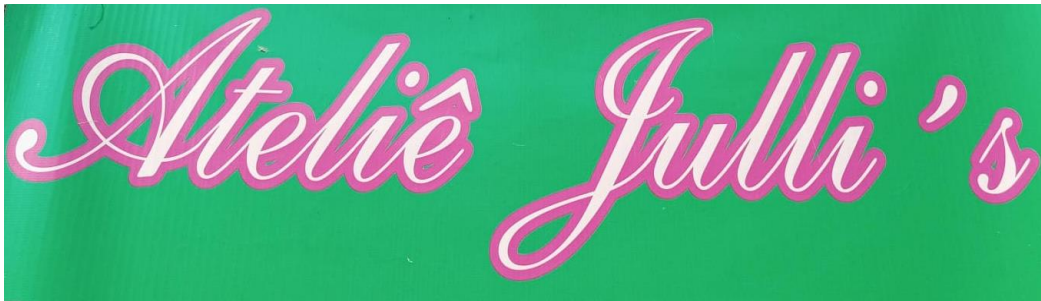
Figura 7 - Logotipo antigo

O Ateliê Julli's utilizava anteriormente um logotipo simples, com um design básico e cores vibrantes, mas que não transmitia toda a elegância e sofisticação do ateliê. Esse logo, apesar de funcional, não era visualmente tão atraente nem representava de forma eficaz a essência da marca. 7