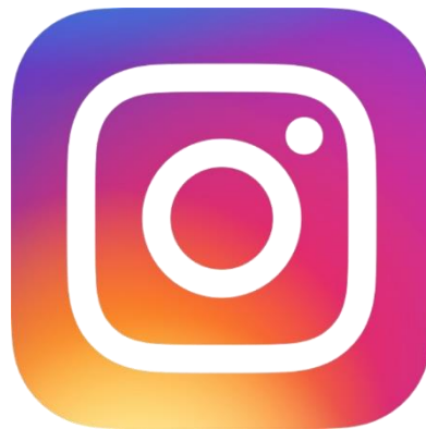
Figura 3 - Logotipo Instagram

Criado por Kevin Systrom e pelo brasileiro Mike Krieger nos Estados Unidos em 2010. O Instagram é um aplicativo essencial para mostrar visualmente o trabalho do ateliê, compartilhar fotos de materiais e peças prontas, bastidores do processo de criação e até mesmo tutoriais de costura e dicas de moda. É uma plataforma ideal para destacar o trabalho artesanal. 3