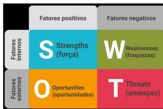
Figura 2 - Análise Swot

A análise SWOT foi inventada na década de 1960 por Albert Humphrey e ajuda a identificar pontos fortes, pontos fracos, oportunidades e ameaças de dado projeto ou do seu plano de negócios geral. Trata-se de uma ferramenta que pode ajudar a sua equipe a planejar de modo estratégico e ficar à frente das tendências de mercado. "Concentre nos pontos fortes, reconheça as fraquezas, agarre as oportunidades e proteja-se contra as ameaças" (SUN TZU [500 a.C]; 2000). 2