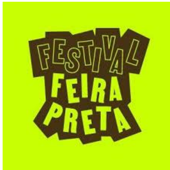
Figura 17 - Logotipo Festival Feira Preta

A Feira Preta é uma organização que promove o desenvolvimento sociocultural da comunidade negra no país, através do fomento ao empreendedorismo e fortalecimento de artistas e microempreendedores. 17