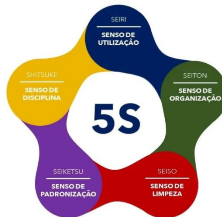
Figura 1 - Método 5S

O 5S é um programa de gestão para melhorar diversos pontos de uma empresa, como organização, limpeza e padronização. Foi criado no Japão em 1950 por Kaoru Ishikawa e originalmente significa Seiri, Seiton, Seiso, Seiketsu e Shitsuke. “O 5S não é sobre paredes ou materiais, é sobre pessoas. A limpeza e organização são consequências de nossa real mudança interior” 1