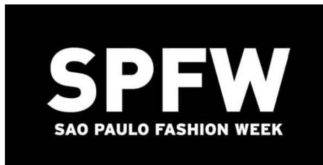
Figura 19 - Logotipo São Paulo Fashion Week

SPFW (São Paulo Fashion Week). É a maior semana de moda do Brasil e uma das principais da América Latina. É um evento voltado para a moda autoral e apresenta as coleções de importantes estilistas brasileiros. 19