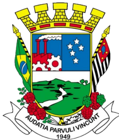
Figura 16 - Logotipo Prefeitura de Poá

A prefeitura de Poá apresenta cursos gratuitos nas casas de cursos de Poá que contém cinco unidades. Os cursos disponíveis para esse ramo são os de corte e costura, tricô e crochê. 16