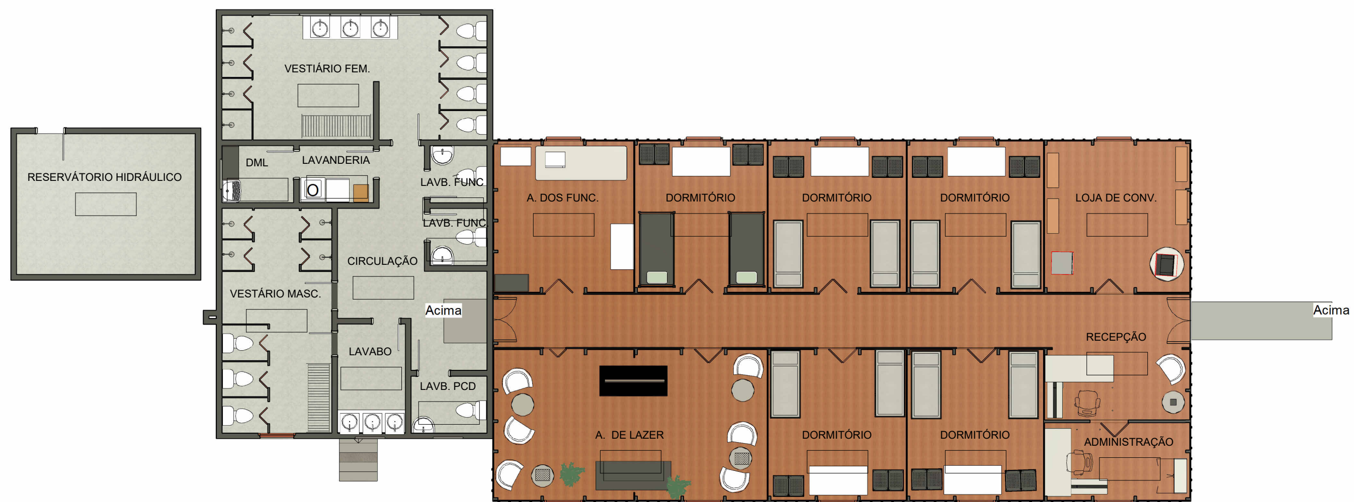
5 PLANTA DE LAYOUT 1 : 100