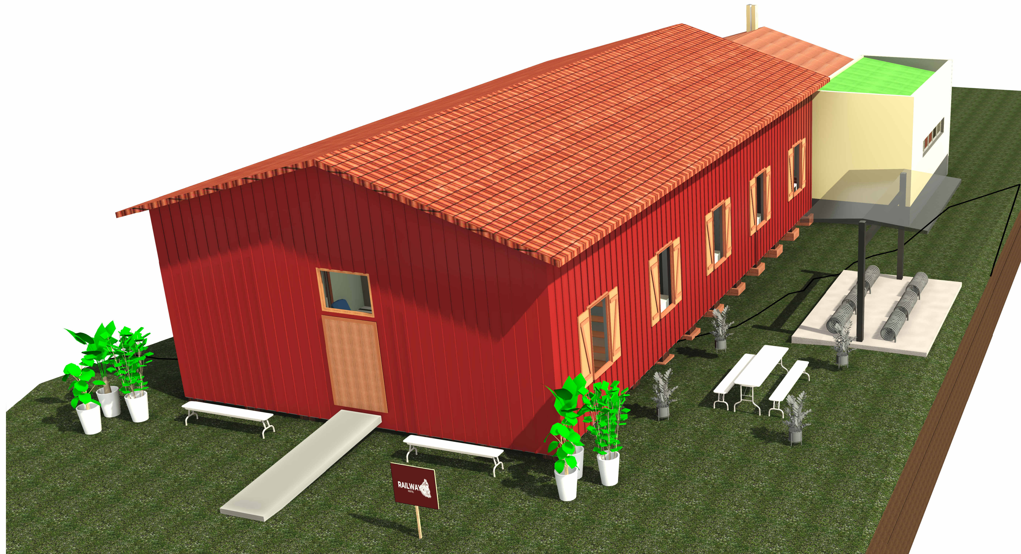
2 PERSPECTIVA FRONTAL