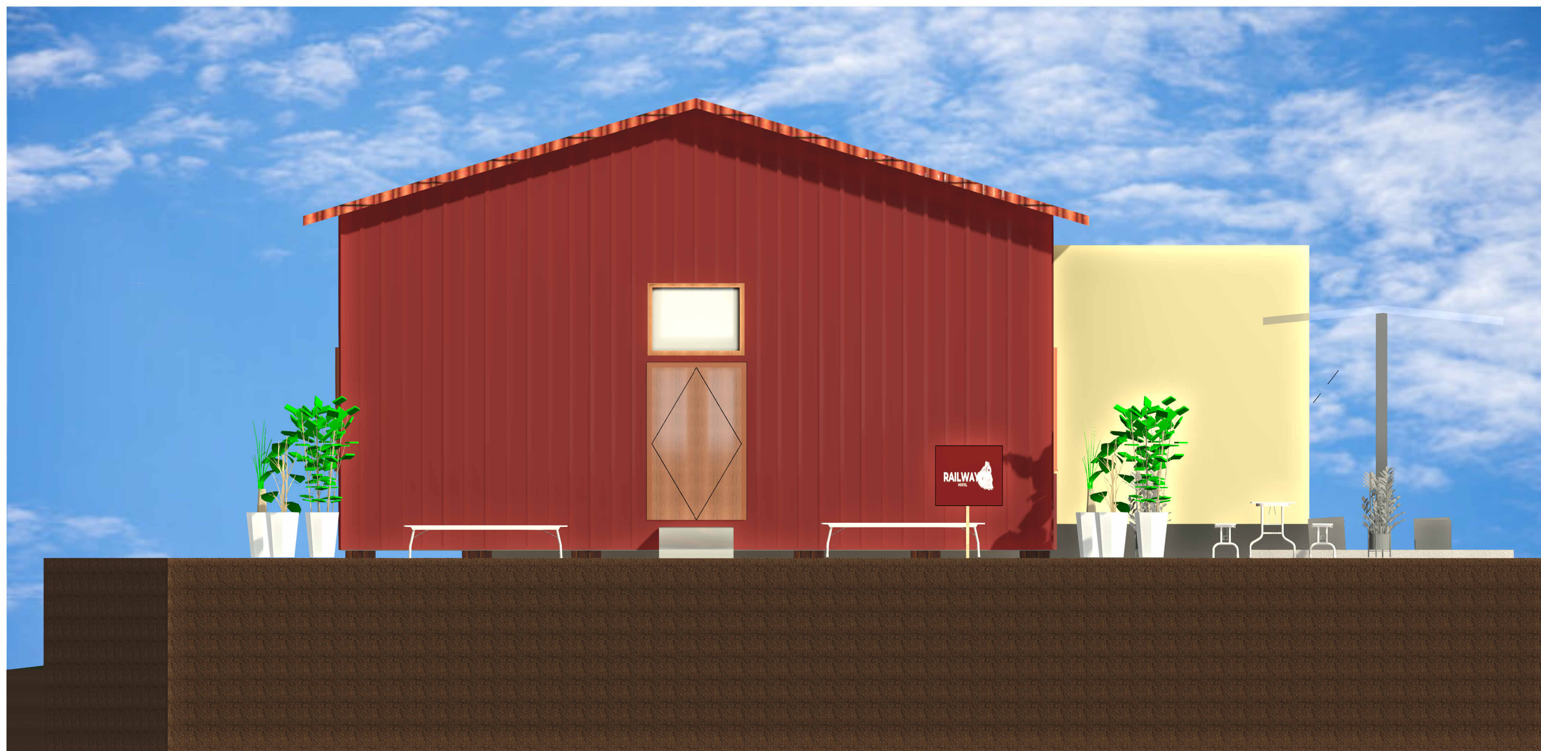
3 FACHADA FRONTAL 1 : 50