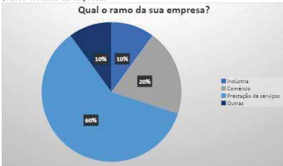
Gráfico 4: Ramo da empresa:

Os enquadramentos das empresas em que os entrevistados se encontram tem sua diversidade, no qual 55,6% se encaixam como LTDA e o restante 44,4% como MEI.