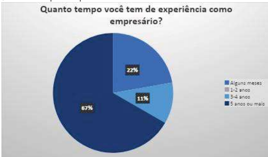
Gráfico 2: Tempo de experiência