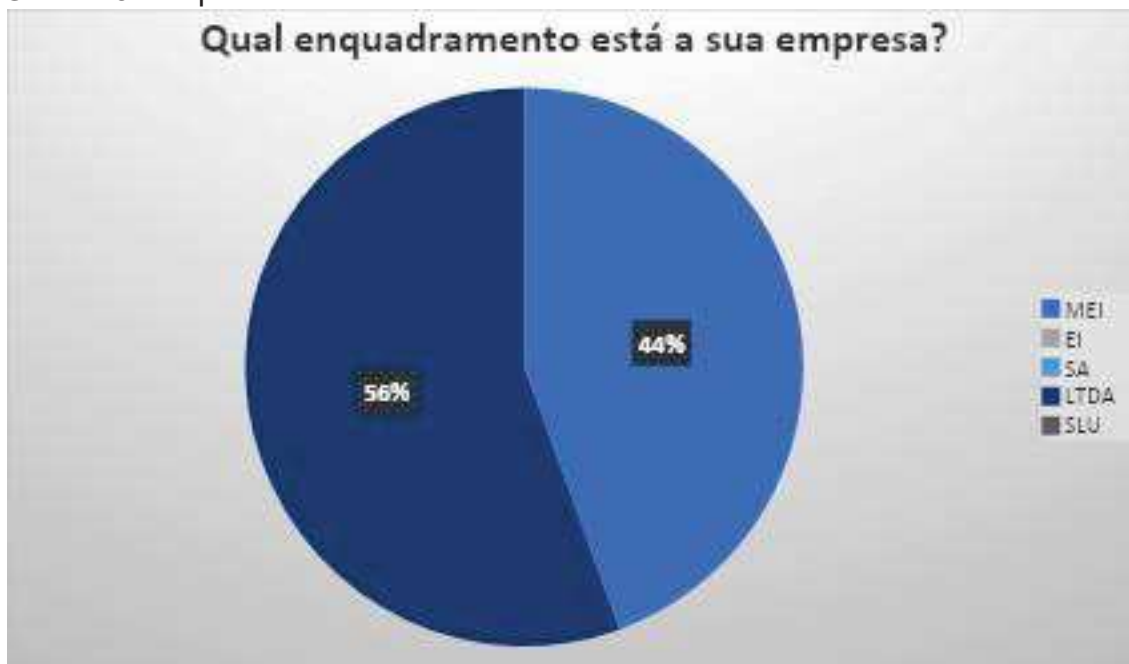
Gráfico 3: Enquadramento.