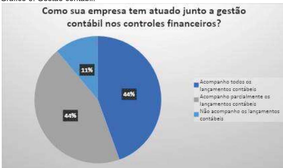
Gráfico 6: Gestão contábil.

Observa-se que os nossos entrevistados são de áreas diversificadas, porém todas necessitam da contabilidade.