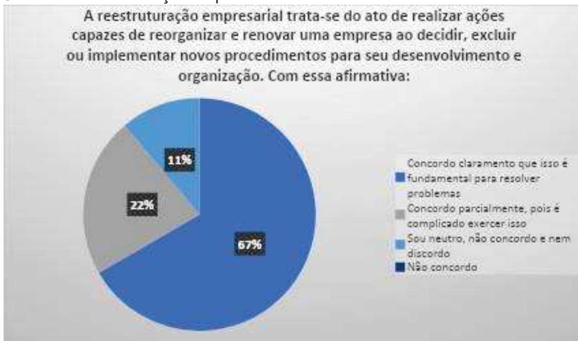
Gráfico 7: Reestruturação empresarial.

os lançamentos contábeis e apenas 11% não acompanham os lançamentos contábeis. Considerando a importância do empresário não só acompanhar, mas também compreender o que os lançamentos contábeis podem demonstrar da saúde financeira da empresa, 11% declararam não acompanhar, se faz preocupante, devido aos problemas que estes possam a vir enfrentar.