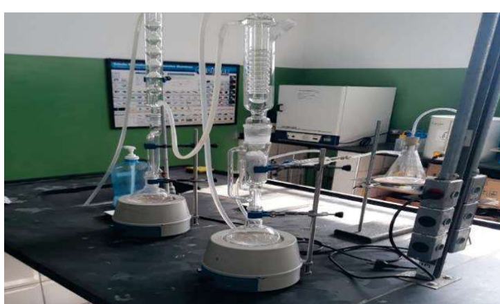
Figura 6 - Sistema de extração soxhlet.