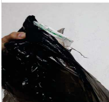
Figura 17 -- Finalização da gaiola.