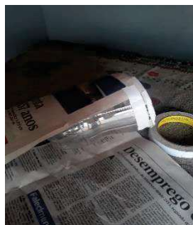
Figura 14 -- Vedação da gaiola

4) Após o preparo da isca, foi feita a vedação da garrafa com jornal e fita adesiva