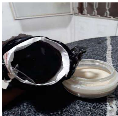
Figura 20 -- Parte superior untada.