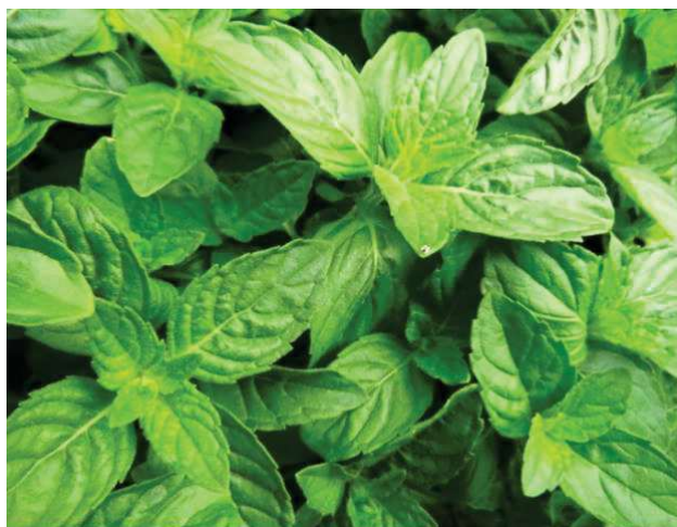
Figura 4 -- Ocimum Basilicum L (Manjericão).

Embrapa (2001) expõe Ocimum basilicum L., representado na Imagem 4, que faz parte da família Lamiaceae (Labiatae) e é amplamente empregado em banhos, xaropes e para tratar estados gripais. Provavelmente originário da Índia e difundido pela Europa através do Oriente Médio, é considerado subespontâneo em todo o Brasil.