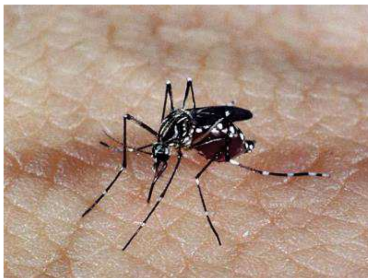
Figura 2 - Mosquito vetor da dengue.