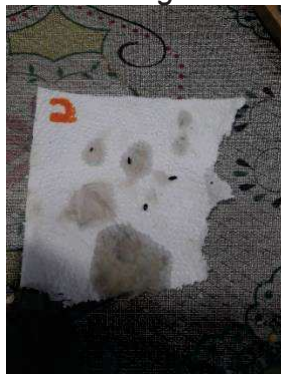
Figura 31 -- insetos coletados na terceira gaiola.

Na terceira isca, foi adicionada uma combinação do suco atrativo com o repelente, o qual foi reabastecido a cada duas horas. Foram capturados 4 insetos, o que permite afirmar que a armadilha é eficaz, indicando que a gaiola 3 possui um índice de repelência de 60%. O objetivo do experimento é avaliar a eficácia do repelente em relação ao seu potencial em repelir insetos e a sua volatilidade