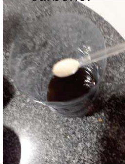
Figura 12 -- Adição do fermento químico para produção de dióxido de carbono.

3) Foi adicionado fermento biológico sobre a mistura, sem a necessidade de realizar qualquer tipo de mistura, pois o fermento gerará o dióxido de carbono de forma natural.