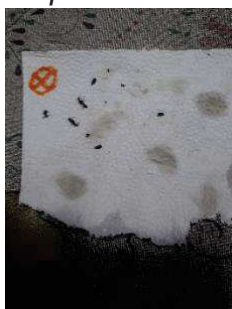
Figura 26 - Insetos coletados na primeira isca.

Na primeira isca, foi utilizado exclusivamente o suco atrativo de açúcar mascavo, com o objetivo de avaliar o potencial da solução na atração de insetos. Observou-se a captura de 10 insetos, o que permite concluir que a isca é eficaz, indicando que a gaiola 1 apresenta 0% de repelência