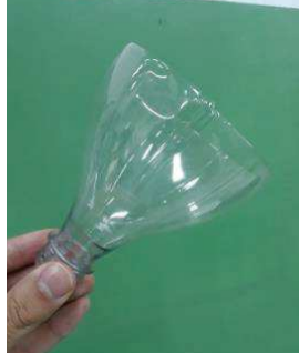
Figura 8 -- Corte da superior da garrafa pet.

1) Foi realizado o corte de uma garrafa plástica do tipo PET ao meio, sendo reservada a parte superior da garrafa.