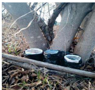
Figura 23 -- Garrafas colocadas ao ar livre.