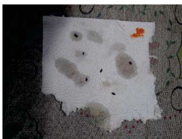
Figura 28 -- Insetos coletados na segunda isca.

Na segunda isca, foi utilizada uma solução composta pelo suco atrativo e o repelente formulado, sendo este reabastecido a cada quatro horas. O objetivo foi avaliar o potencial dessa solução na atração de insetos. Foram capturados 6 insetos, o que permite concluir que a armadilha é efetiva, indicando que a gaiola 2 apresenta um índice de repelência de 40%.