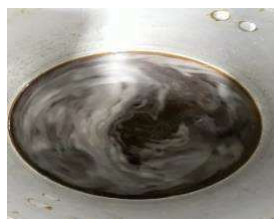
Figura 10 -- Preparação do suco

2) Após esfriar, o líquido é despejado na metade inferior da garrafa. O açúcar mascavo foi misturado à água quente, e aguardou-se até que a solução esfriasse completamente. Após o resfriamento, o líquido foi cuidadosamente despejado na metade inferior da garrafa.