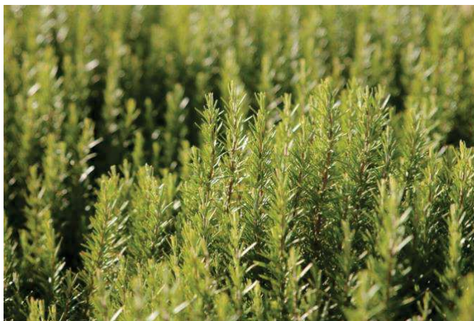
Figura 5 -- Rosmarinus officinalis (alecrim).

Vários estudos têm sido publicados sobre o isolamento e identificação de diferentes antioxidantes, diterpenos, triterpenos e flavonoides de Rosmarinus officinalis (SOLIMAN, F.M., 1994). As propriedades antioxidantes do extrato de alecrim têm sido objeto de considerável atenção nos últimos anos, reconhecidas desde a Antiguidade. Recentemente, esforços têm sido feitos para determinar a estrutura química dos constituintes ativos da planta. Rosmanol, rosmaridifenol e rosmariquinona são alguns dos compostos identificados até agora (SVOBODA, K.P., abril de 1992).