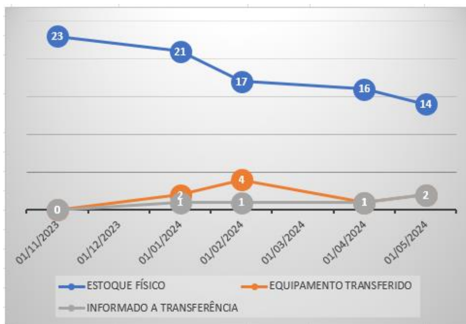
Gráfico 1 - Controle sobre a comunicação de transferência de um ativo imobilizado