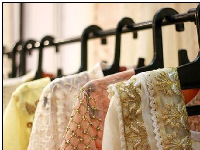
Figura 3 - Oficina de Bordados em Tecido e Pedrarias

Participar dessa oficina oferece aos alunos a chance de adquirir um novo talento, expressar-se artisticamente e fortalecer a autonomia por meio da realização de trabalho manual (Raios de Luz, 2022).