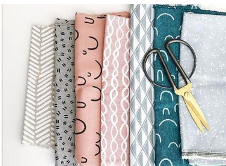
Figura 4 - Oficina de Customização em Tecidos

Essa atividade viabiliza o estímulo à diversão, à criatividade, contribui na economia de recursos financeiros, reduzindo o consumo de moda rápida, e pode até mesmo se tornar uma fonte de renda. Além disso, a oficina promove a interação social, o aperfeiçoamento da coordenação motora fina e outras habilidades manuais, oferecendo também uma oportunidade para fazer novos amigos (Raios de Luz, 2022).