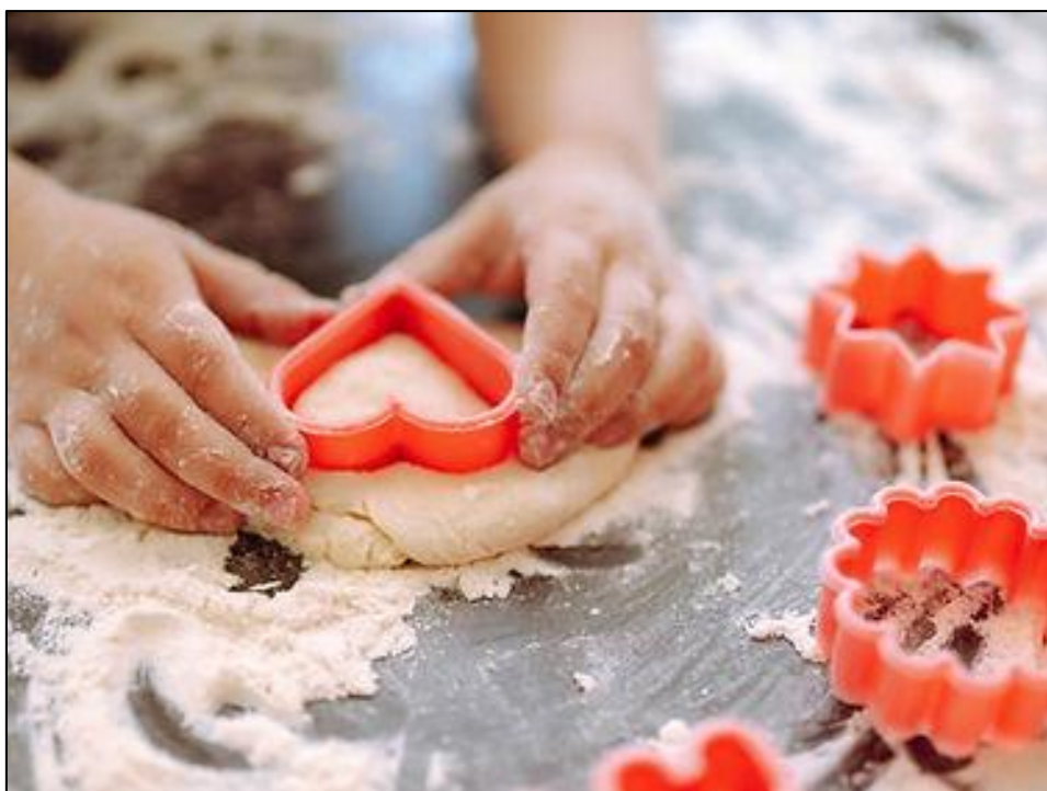
Figura 5 - Oficina de Culinária e Panificação