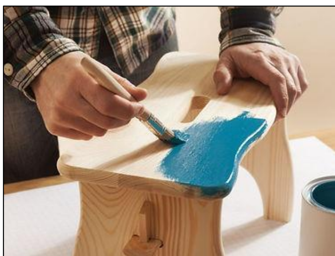
Figura 12 - Oficina de Pintura em Madeira

Durante as sessões da oficina, os participantes aprendem técnicas de pintura e decoração em objetos de madeira. Desde a preparação da superfície até a escolha das cores e a aplicação das diferentes técnicas de pintura, os participantes têm a oportunidade de criar peças personalizadas e únicas (Raios de Luz, 2022).