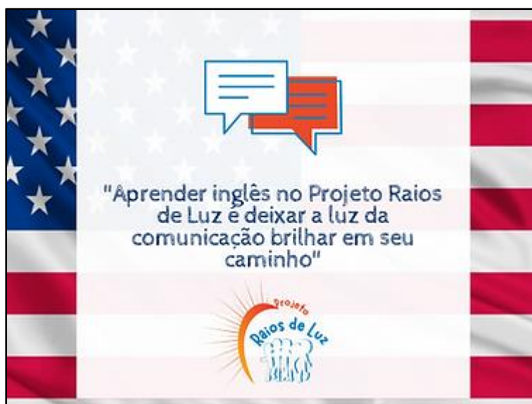
Figura 1 - Oficina de Inglês

As aulas são conduzidas e orientadas por instrutores qualificados e experientes, que adotam uma abordagem dinâmica e interativa para cativar os alunos no processo de aprendizado. Além de abordar gramática e vocabulário, a oficina de inglês prioriza a prática da comunicação oral e escrita, preparando os alunos para ocasiões do dia a dia e para futuras oportunidades profissionais. O ambiente da oficina é acolhedor e incentivador, criando um espaço seguro e receptivo no qual os participantes se sentem à vontade para praticar e cometer erros sem receio de críticas (Raios de Luz, 2022).