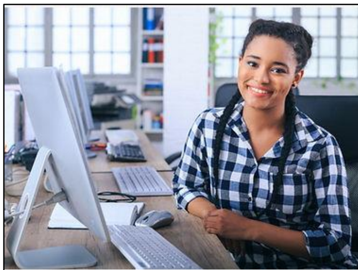
Figura 2 - Oficina de Auxiliar de Escritório