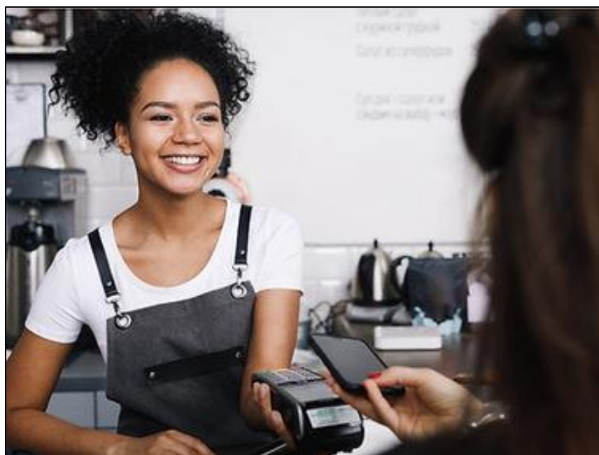
Figura 10 - Oficina de Operadora de Caixa

Os participantes desta oficina aprendem a realizar transações financeiras, lidar com diversas formas de pagamento, utilizar equipamentos de segurança e interagir com os clientes de maneira profissional. A oficina é fundamental para o desenvolvimento de habilidades em atendimento ao cliente, matemática financeira e gestão financeira, oferecendo também experiência e conhecimentos valiosos para futuras oportunidades de emprego. Além disso, participar dessa atividade promove a socialização, o aprendizado em grupo e a chance de estabelecer novas amizades, enquanto se adquirem competências essenciais para o sucesso profissional (Raios de Luz, 2022).