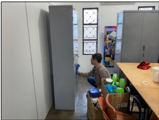
Reprodução fotográfica do processo de entrega da sala de artesanato reformada