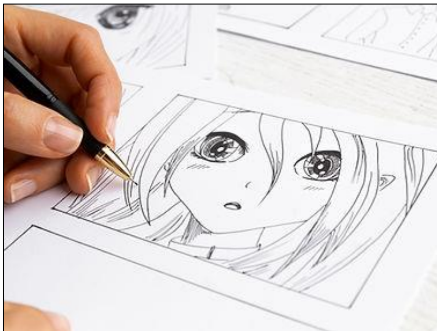
Figura 6 - Oficina de Desenho Ilustrativo

Com benefícios que incluem o aprimoramento da coordenação motora fina e o estímulo à expressão artística, essa atividade também pode abrir portas para carreiras no campo da ilustração e do design gráfico. Além disso, a oficina suscita a interação social e o aprendizado em grupo, enquanto os participantes colaboram para criar belas ilustrações (Raios de Luz, 2022).