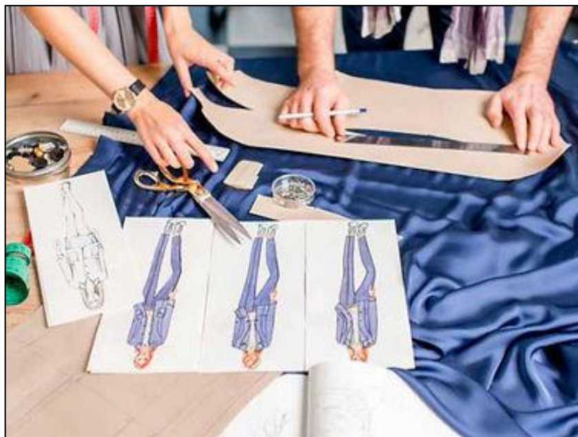
Figura 9 - Oficina de Modelagem e Costura

Além de ser uma atividade que estimula a criatividade e proporciona diversão, a modelagem e costura oferecem uma série de benefícios significativos. Entre eles, destaca-se a capacidade de personalizar roupas de acordo com preferências e medidas individuais, a economia financeira ao evitar a compra de peças caras e o apoio a um consumo mais consciente e sustentável (Raios de Luz, 2022).