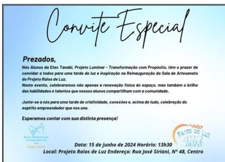
Figura 15 - Convite Reinauguração da Sala de Artesanato

Reinauguração da sala, e promover eventos tanto online quanto presenciais para fortalecer a marca.