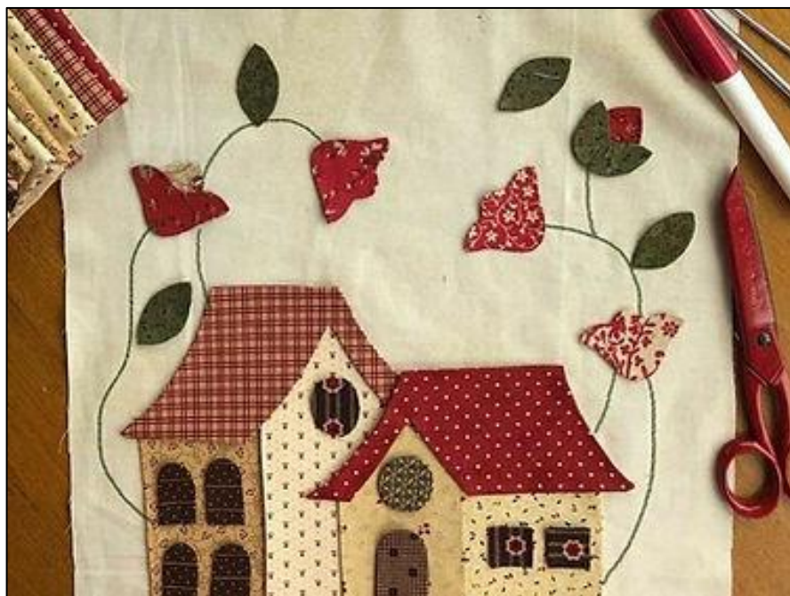
Figura 11 - Oficina de Patch Applique

A oficina de pintura em madeira oferecida pelo Projeto Raios de Luz proporciona uma série de benefícios aos participantes, incluindo o desenvolvimento de habilidades manuais e artísticas, o fortalecimento da criatividade e da capacidade de improvisação (Raios de Luz, 2022).