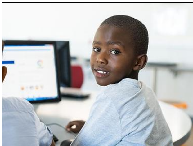
Figura 8 - Oficina de Informática Básica

Além de ser uma atividade essencial e relevante para a vida pessoal e profissional, o aprendizado de informática básica oferece uma série de benefícios, como aprimoramento da organização pessoal e profissional, capacidade de comunicação e interação com indivíduos e empresas, além do acesso a vastas informações e conhecimentos disponíveis online. Durante a oficina, os participantes terão a chance de desenvolver habilidades em uma das áreas mais cruciais para a sociedade contemporânea, ao mesmo tempo em que promovem interação social e aprendizado em grupo (Raios de Luz, 2022).