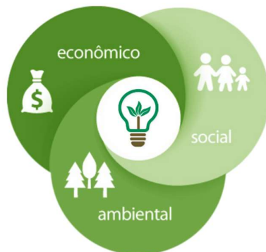
Figura 1: Triple Bottom Line

Para Araújo, Bueno, Souza e Mendonça (2006), o desenvolvimento sustentável abrange três dimensões fundamentais: o crescimento econômico, a justiça social e a preservação ambiental. Em outras palavras, ele visa equilibrar as dimensões econômica, social e ambiental, também conhecido como o conceito de Triple Bottom Line .