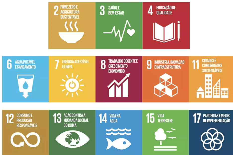
Figura 5: Objetivos do Desenvolvimento utilizados pela AMBEV