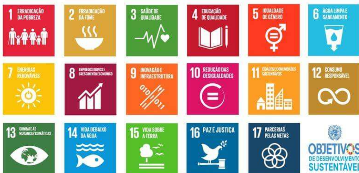
Figura 3 – Símbolos dos Objetivos Desenvolvimento Sustentável