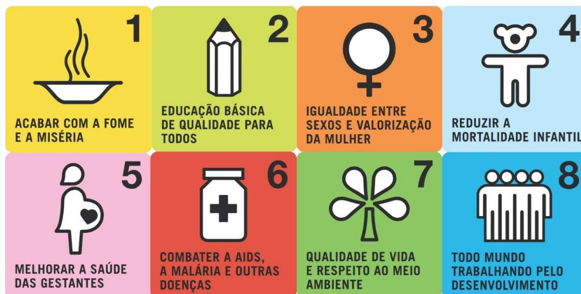
Figura 2: Símbolos do Objetivos do Desenvolvimento do Milênio

A partir do compromisso assumido pelos líderes estaduais em relação aos Objetivos do Milênio, visando alcançar a paz e estabelecer um sistema mais equitativo para todos até 2015, foram delineados na figura 2, os objetivos.