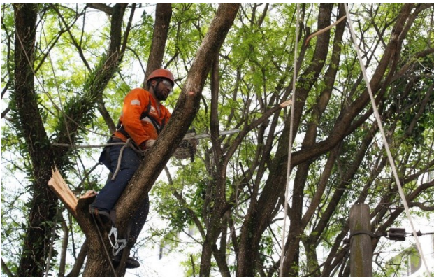
Figura 6- Poda de árvore com os equipamentos e EPIs utilizados corretamente