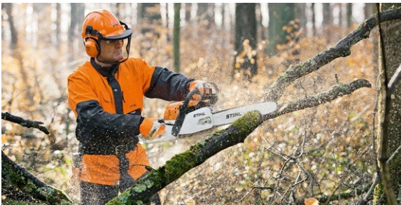
Figura 5- Manuseio de Motosserra com a utilização correta dos EPIs