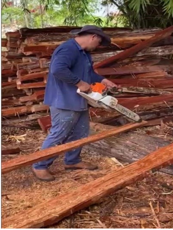
Figura 4- Exposição a Riscos no manuseio de Motosserra, sem cuidados e EPIs