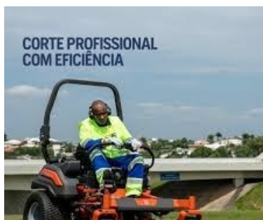
Figura 2 - Utilização correta da Giro Zero e com EPIs necessários