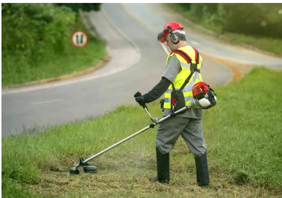
Figura 3- Manuseio correto da Roçadeira, e com os EPIs necessários

Além de todos esses riscos, não podemos eliminar também o fator oncológico que pode ocorrer em eventuais, mesmo que raras, situações.