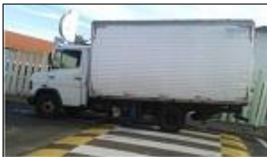
Figura 2- Caminhão no Ponto de Distribuição

Quando o leite chega no ponto de distribuição, é armazenado em caixa de isopor, onde é distribuído na quantidade certa aos beneficiários, que ali esperam na fila por ordem de chegada.