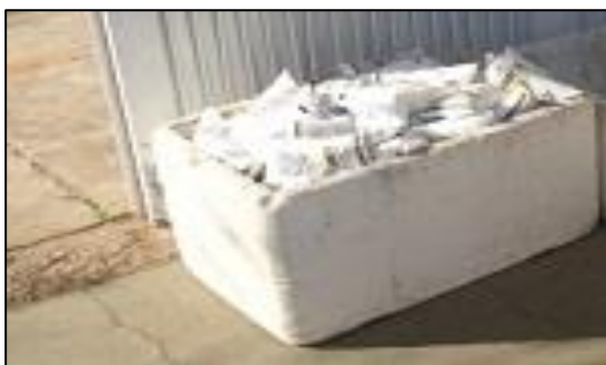
Figura 3- Armazenagem Intermediária no Ponto de Distribuição