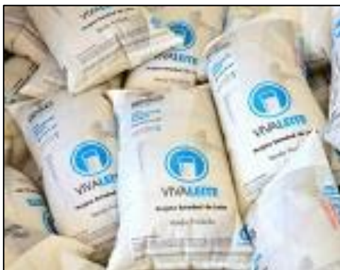
Figura 1-Embalagem do leite, do projeto “Viva Leite”