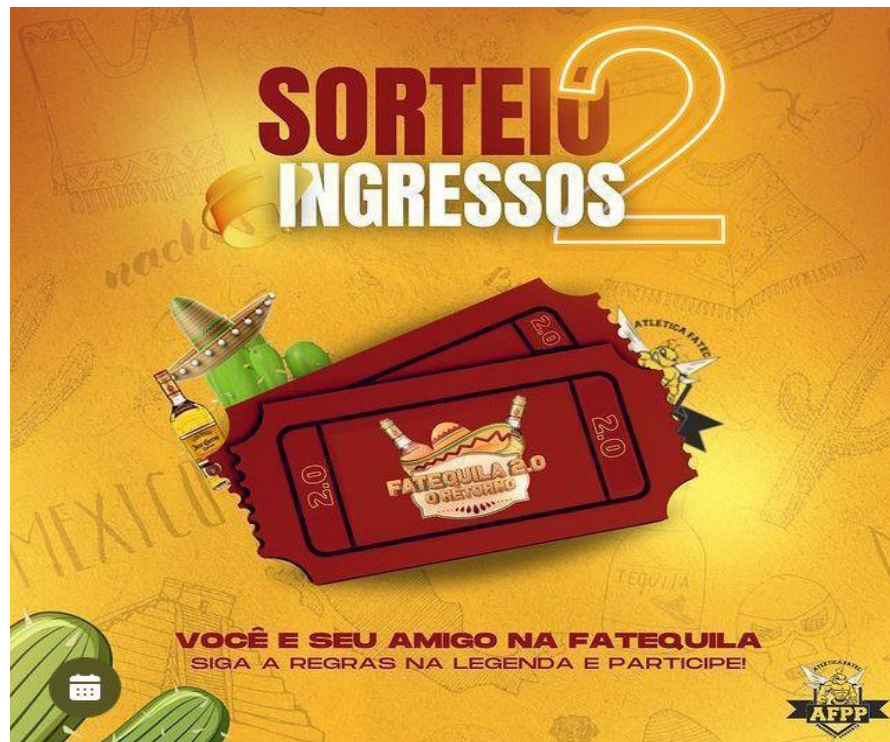
Figura 29. Arte de divulgação do sorteio de ingressos.