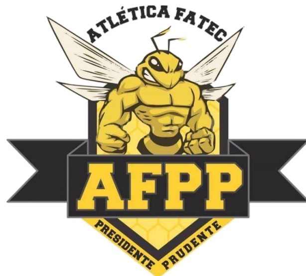
Figura 3. Logo Atlética Fatec Presidente Prudente