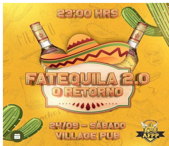
Figura 27. Divulgação instagram