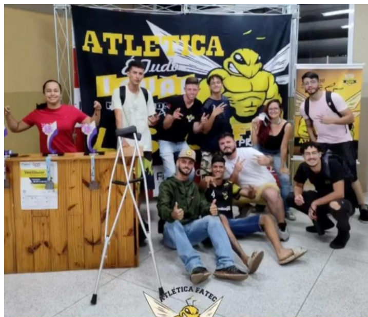
Figura 15. Retorno dos jogos.