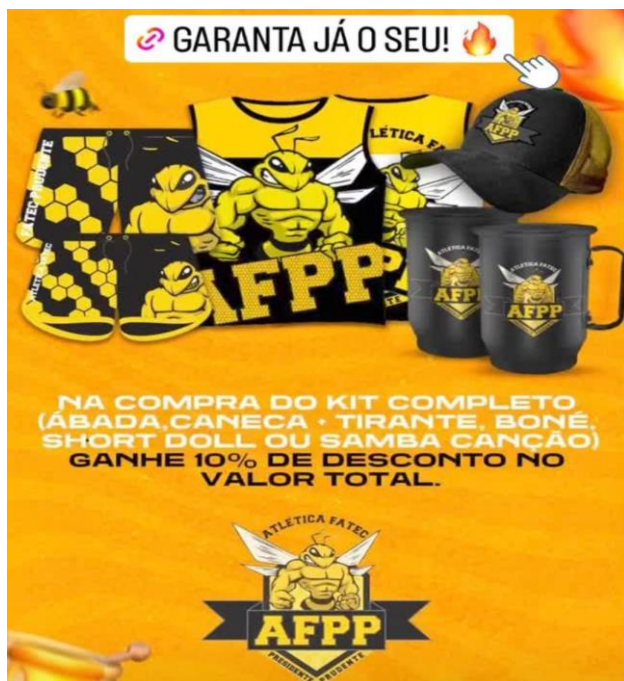
Figura 8. Kit de vendas do Zangão.