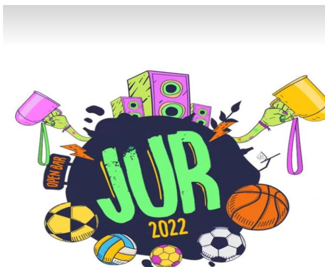
Figura 5. Participação dos Jogos Regionais em Assis