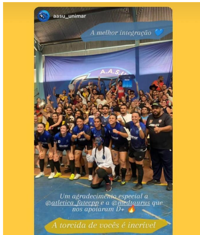
Figura 13. Integração com as faculdades nos Jogos Regionais em Assis