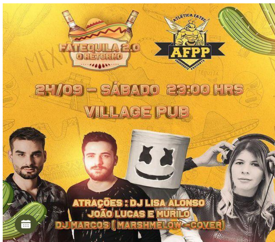
Figura 28. Anúncio atrações do evento