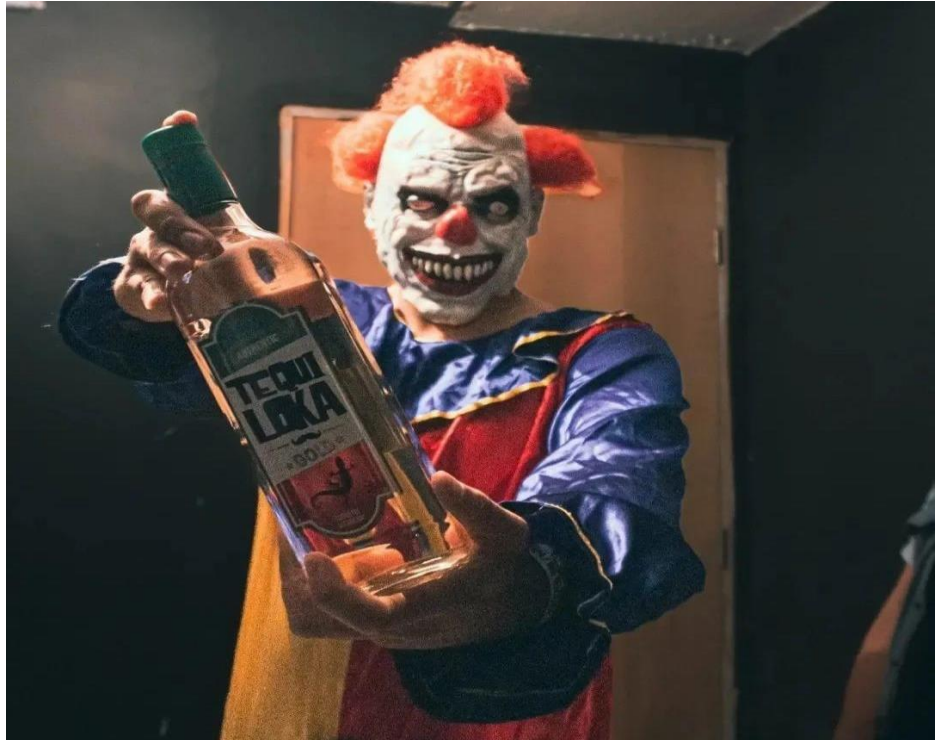
Figura 20. Atração palhaço “tequileiro”. Responsável por as rodadas de tequila