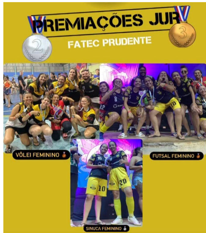
Figura 14. Premiação