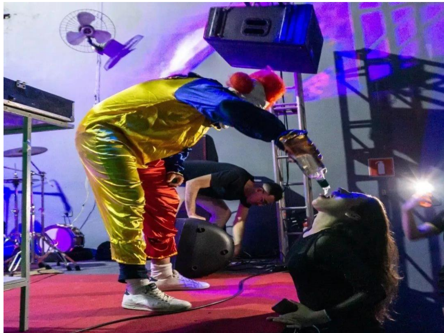
Figura 21. Rodadas de tequila grátis durante o evento