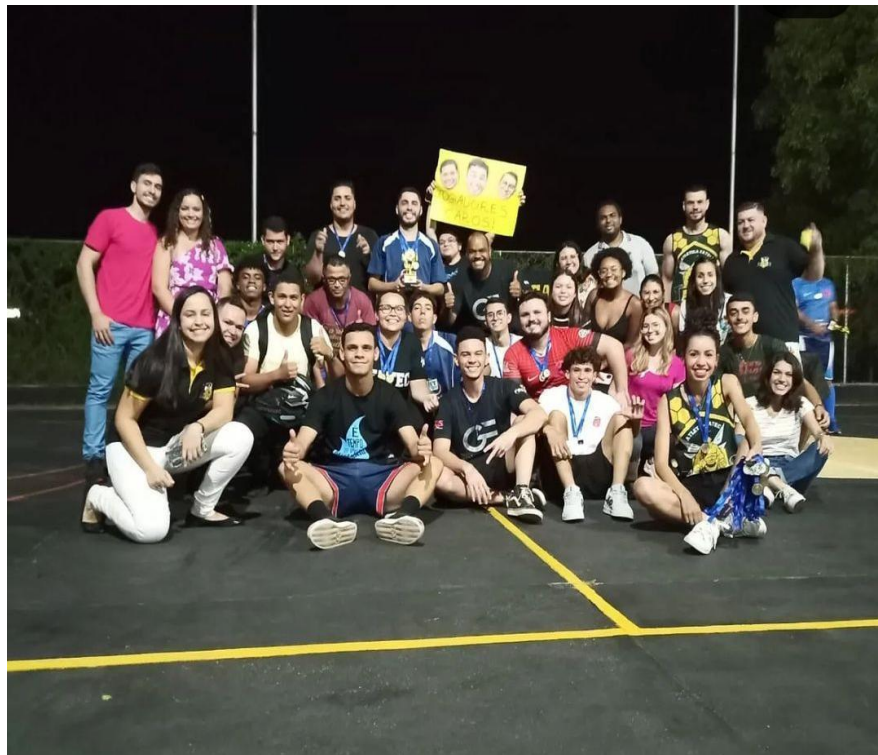
Figura 7. Intercursos campeão geral.