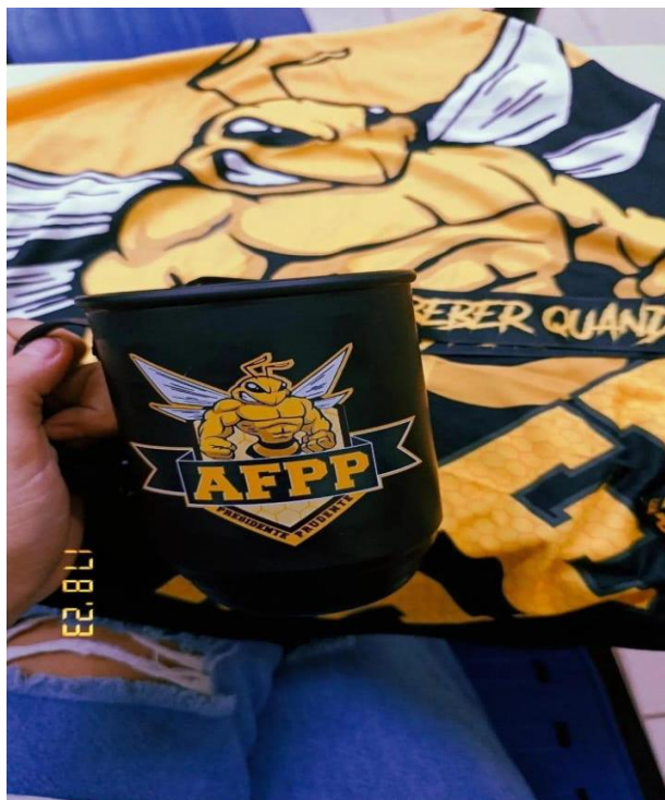
Figura 9. Entrega do Kit Zangão.