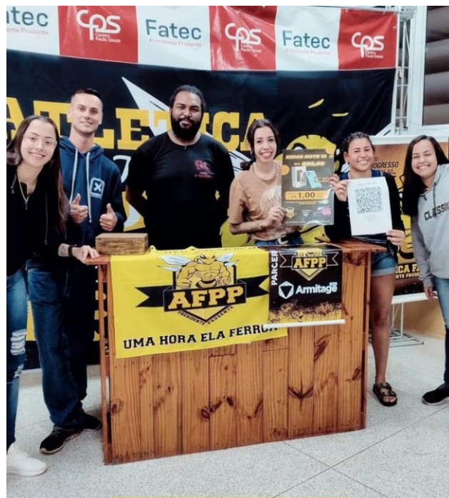
Figura 11. Ponto de venda da Rifa.