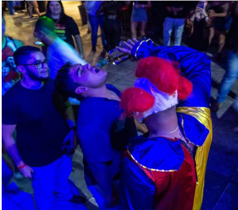
Figura 22. Interação do tequeleiro com o público.