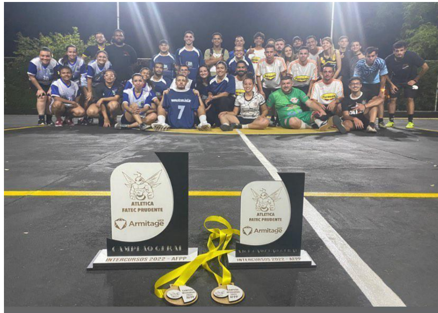
Figura 6. Intercursos foto geral.