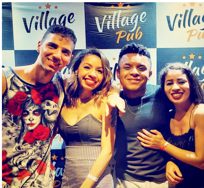
Figura 23. Público.