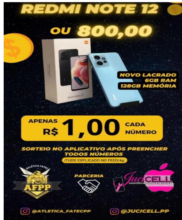
Figura 10. Rifa