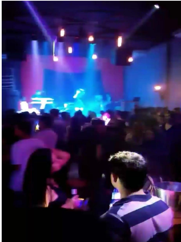
Figura 1: Primeira edição Fatequila, público.