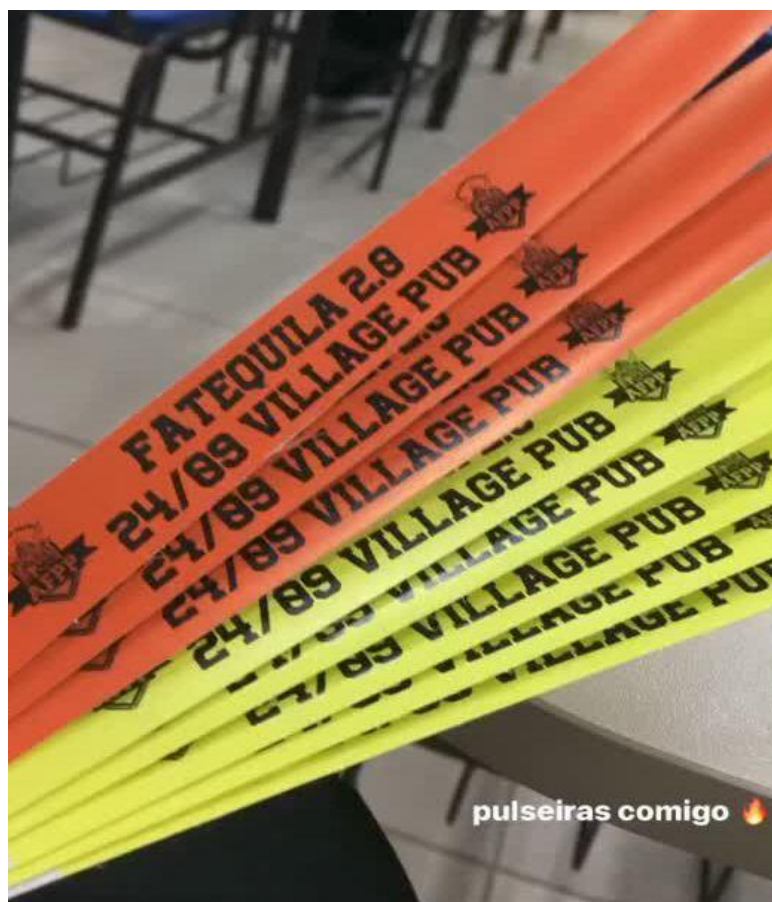
Figura 25. Pulseiras de identificação/ credenciais