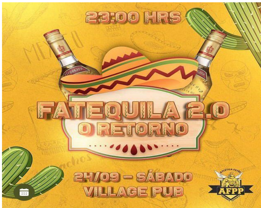
Figura 24. Material de divulgação redes sociais