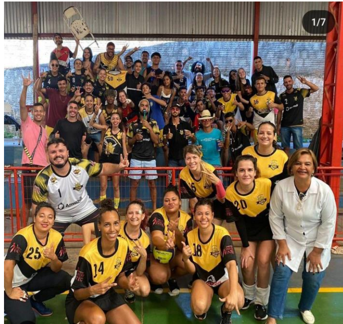
Figura 12. Jogos Regionais em Assis