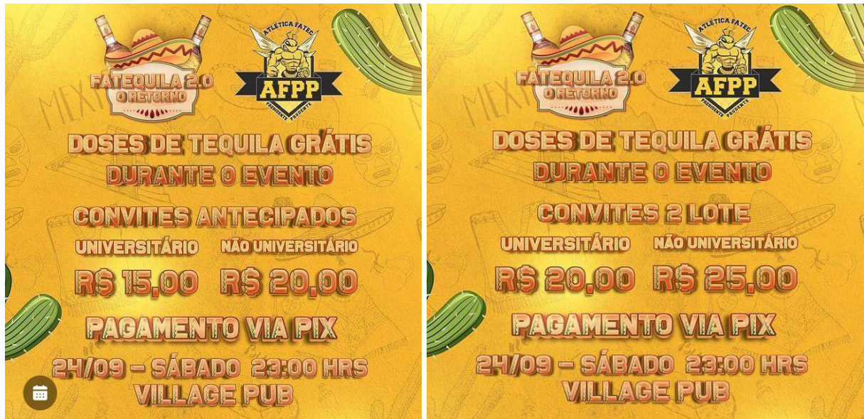
Figura 26. Arte de divulgação venda de convites por lotes.