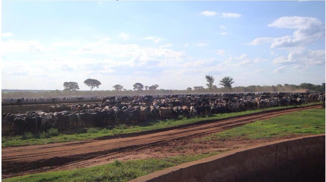
Figura 6 - Fazenda Modelo II

Na fazenda Santa Ofélia, pode-se observar na Figura 7 que o uso de tecnologia é intensivo, verifica-se o sistema de pivô central para irrigação e adubação do pasto onde os animais são soltos e a diferença do pasto irrigado e pelo qual não é nítida. Segundo o proprietário da fazenda Sergio Arantes um pasto bem manejado é altamente nutritivo e faz com que os animais adquiram o peso desejado.