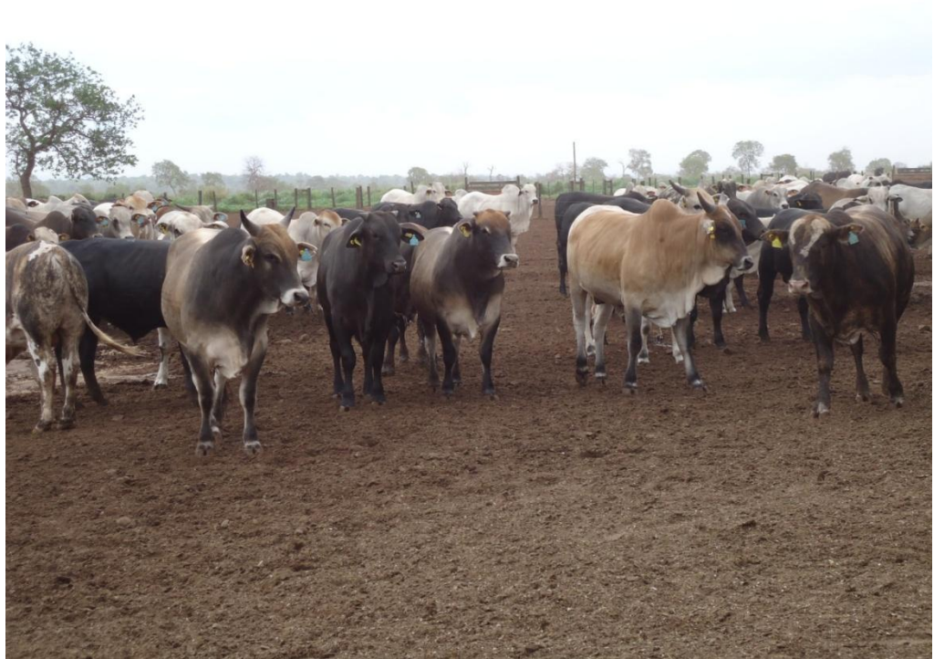
Figura 4 - Fazenda JBS – MS

Na Figura 5 observa-se a estrutura do curral para manejo dos animais e o tronco mecanizado na fazenda JBS. A estrutura é completamente obsoleta, quando se fala em um dos maiores produtores de carne. O aspecto logístico diante ao embarque até a chegada ao frigorífico não é preocupação dos produtores, pois para chegar a um frigorífico que é de propriedade deles próprios o caminhão leva aproximadamente uma hora de estrada de terra, mais uma hora de estrada pavimentada, causando imenso estresse para os animais e perdas de peso.