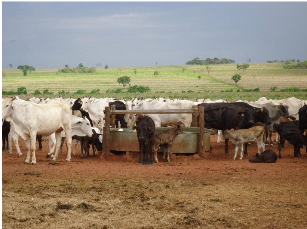
Figura 2 - Fazenda 7 Voltas – MS

A fazenda Tomé Arantes, é empreendedora, pode-se observar que há vários tipos de produção como: bovinos, ovinos, suínos, aves, leguminosas e frutas.