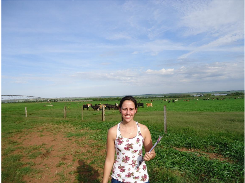
Figura 7 - Fazenda Santa Ofélia - MS

Na Figura 8 retrata a fazenda Genética Aditiva, o produtor destacou em uma palestra antecedente a visita, a importância da genética para melhor desempenho do rebanho. Porém a logística após o embarque não é controlada, vez que é terceirizada e leva duas horas e meia para chegar a um frigorífico parceiro.