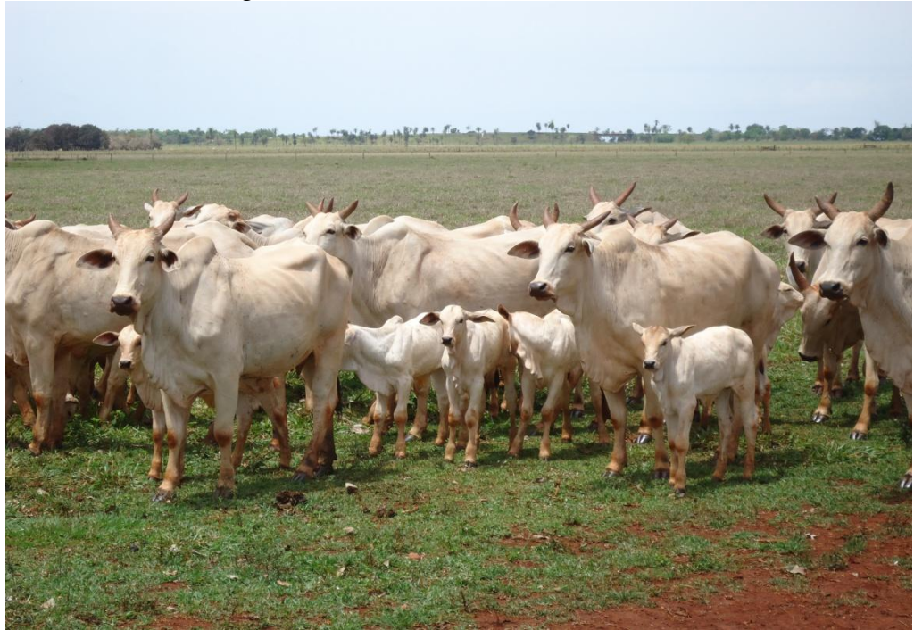
Figura 8 - Fazenda Genética Aditiva - MS

Observa-se que quando se leva em consideração a logística das propriedades citadas, pode-se destacar as distâncias que os animais percorrem até os frigoríficos parceiros, pois são extremamente longas e com alto índice de perdas de peso, vez que as estradas são de terra e cheia de buracos, fazendo com que os animais permaneçam por mais tempo dentro dos caminhões do que o previsto.