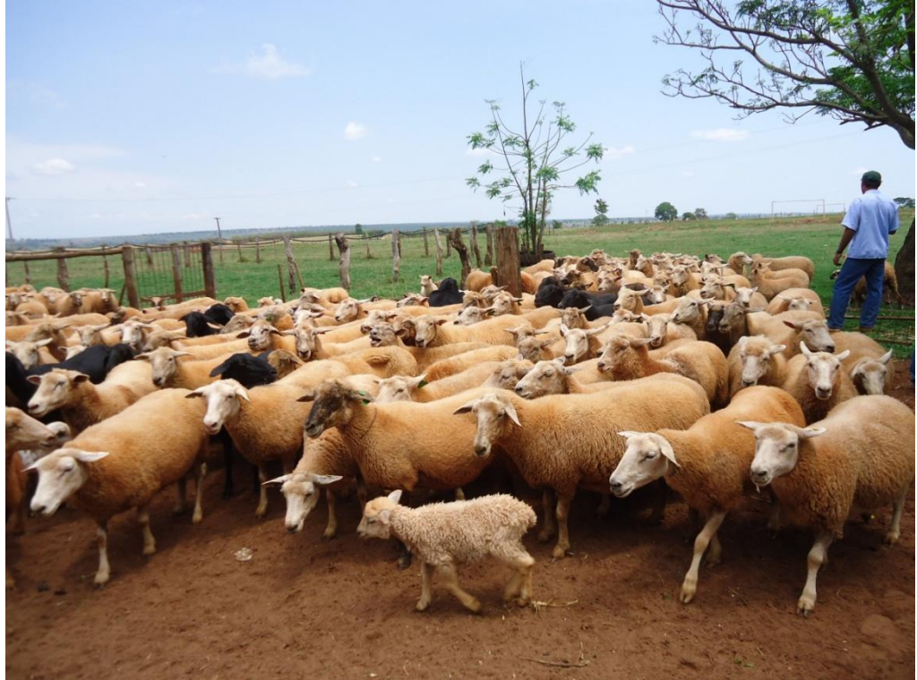
Figura 3 - Fazenda do Tomé Arantes – MS

Na fazenda JBS um dos maiores produtores de carne do mundo, possui grande estrutura para obter 25 mil animais para o confinamento. Porém os animais não são próprios, e sim de parceiros, os quais não se preocupam com o conforto do animal e sim com o dinheiro no final do ciclo de produção, como está demonstrado na Figura 4.