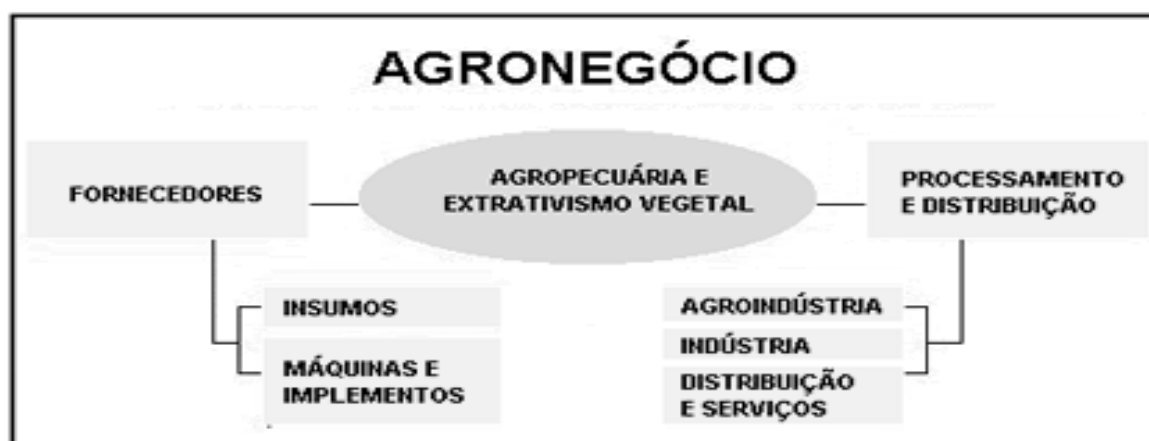
Figura 1 - Setores do Agronegócio