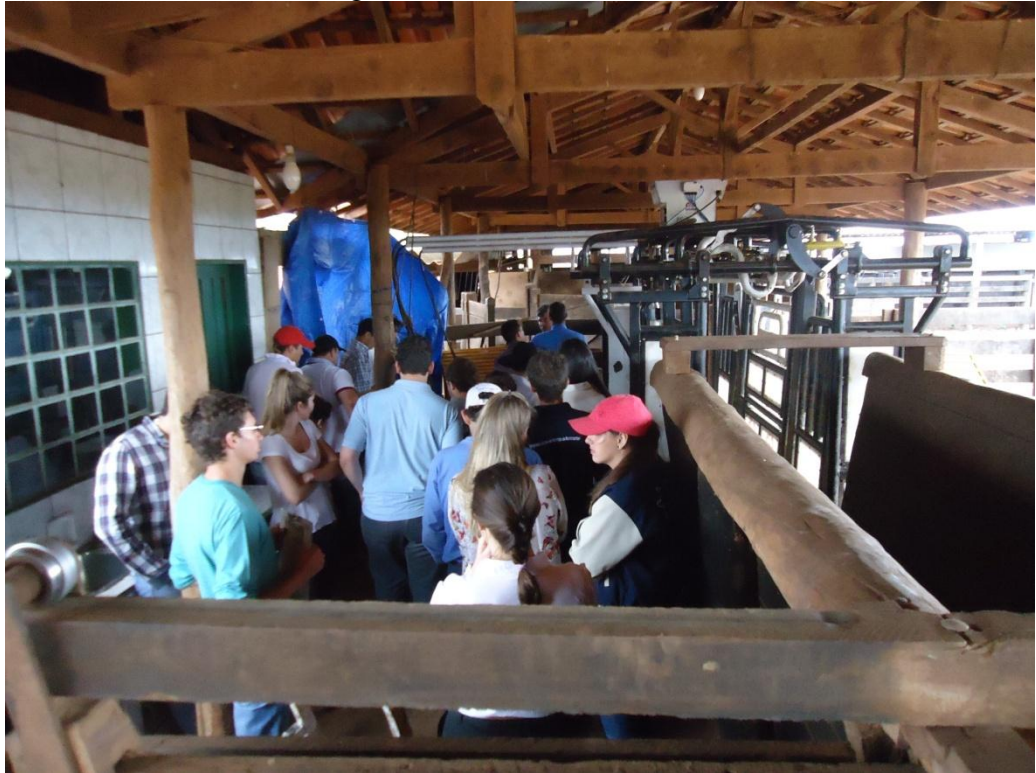
Figura 5 - Estrutura JBS – MS

Já na fazenda Modelo II possui uma fantástica estrutura com capacidade de acondicionar 35 mil animais, porém o acesso à propriedade é extremamente crítico. São aproximadamente três horas de viagem de estrada de terra. Pode-se imaginar a viagem que leva esses animais até a chegada ao frigorífico, extremamente estressados e com certeza com perda de peso. Pode-se observar na Figura 6 a estrutura utilizada.