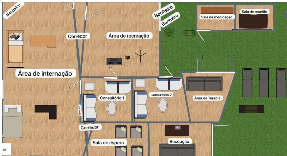
Figura 2- Layout

O layout da clínica está sendo cuidadosamente planejado para fornecer um ambiente seguro, acolhedor e eficaz para os pacientes. As considerações de design terapêutico como cores suaves, iluminação adequada e materiais que reduzam o ruído ajudam a criar um ambiente benéfico.