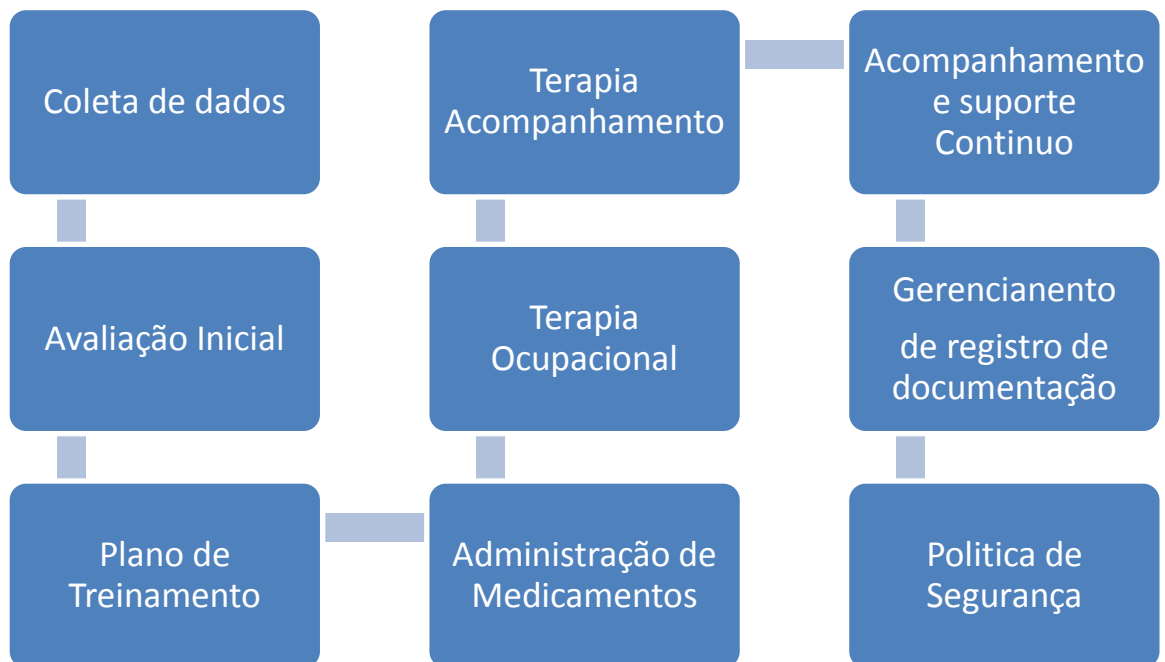
Figura 3: Fluxograma

Na terapia ocupacional, envolve atividades e exercícios destinados a melhoria da saúde mental, e o bem-estar dos pacientes incluindo no dia a dia, música, esporte, atividades artísticas e roda de bate papo e durante o acompanhamento haverá suporte contínuo, com assistente social e psicólogo. No gerenciamento de registro e documentação o prontuário eletrônico do paciente (PEP), irá trazer dados de coleta e manterá arquivado informações do paciente.