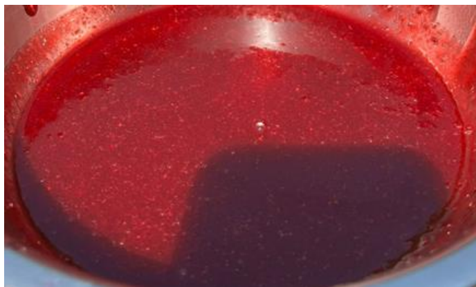
Figura 2: Produto finalizado.

Foi perguntado aos provadores, a opinião sobre a aparência do produto, e conforme exposto no Gráfico 2, 97% dos provadores aprovaram a aparência do produto. Isso pode ser atribuído ao fato de ele ter ficado similar ao que se encontra comercialmente nos mercados, conforme pode ser encontrado na Figura 2 e Figura 3.