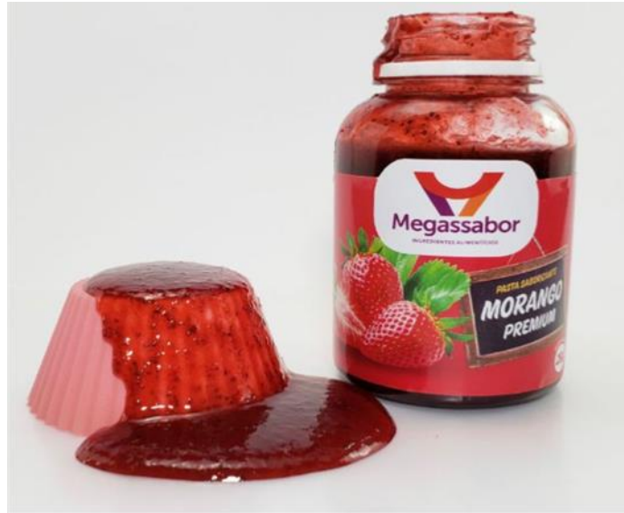
Figura 3: Produto comercial similar.