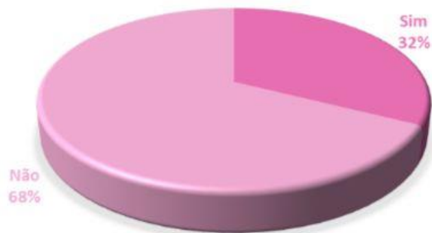
Gráfico 1: Quantidade de pessoas que conhecem a PANC Bougainville.

Foi perguntado aos provadores, a opinião sobre a aparência do produto, e conforme exposto no Gráfico 2, 97% dos provadores aprovaram a aparência do produto. Isso pode ser atribuído ao fato de ele ter ficado similar ao que se encontra comercialmente nos mercados, conforme pode ser encontrado na Figura 2 e Figura 3.