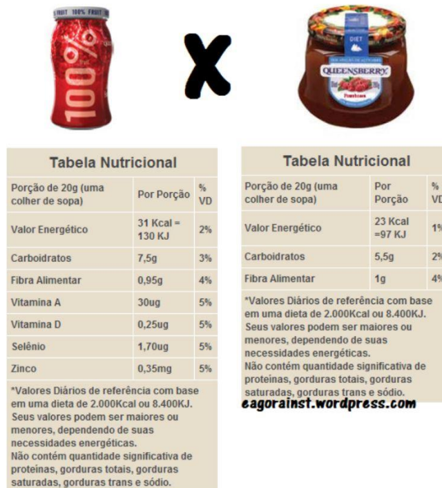
Figura 6: Geleia de morango HOMEMADE Vidro 320g.