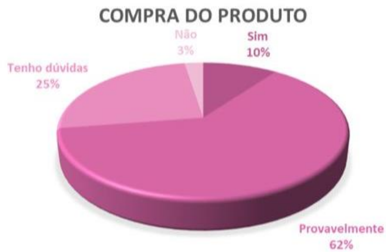
Gráfico 4: Resultado de acordo com a compra do produto.