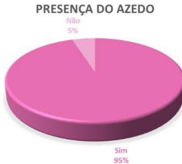
Gráfico 3: Resultado da presença do azedo no sabor, dando contraste, ou não.