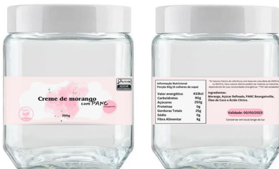
Figura 8: Proposta de embalagem do produto.

Agregando também, vantagens na embalagem como possibilidade de reutilização, transparente com possibilidade de se tornar colorido; grande resistência à compressão vertical; o vidro é visto pelo consumidor como um material nobre, o que tem assegurado a continuidade de seu uso como material de embalagem de vários produtos, agregando-lhes valor; No entanto algumas desvantagens existentes são, que alimentos comercialmente esterilizados –e acondicionados em embalagens metálicas ou de vidro – podem sofrer deterioração microbiológica, caso o tratamento térmico seja insuficiente ou quando ocorrerem falhas na hermeticidade da embalagem, permitindo a entrada de microrganismos; Pode ser facilmente quebrável caso não seja manuseado delicadamente; Peso elevado; Em termos ambientais, sua degradação química e erosão física é muito lenta e inócua.