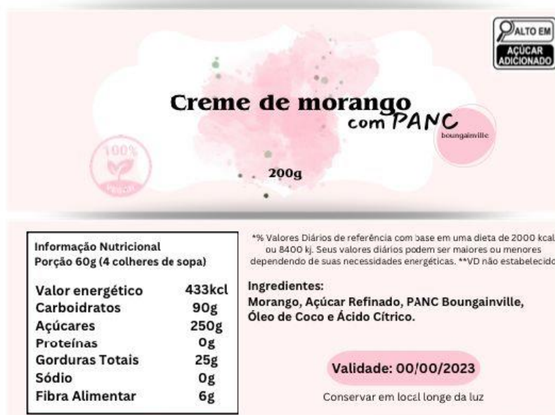
Figura 9: Rotulagem do produto.