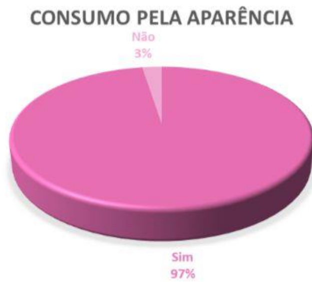
Gráfico 2: Resultados do consumo pela aparência do produto.