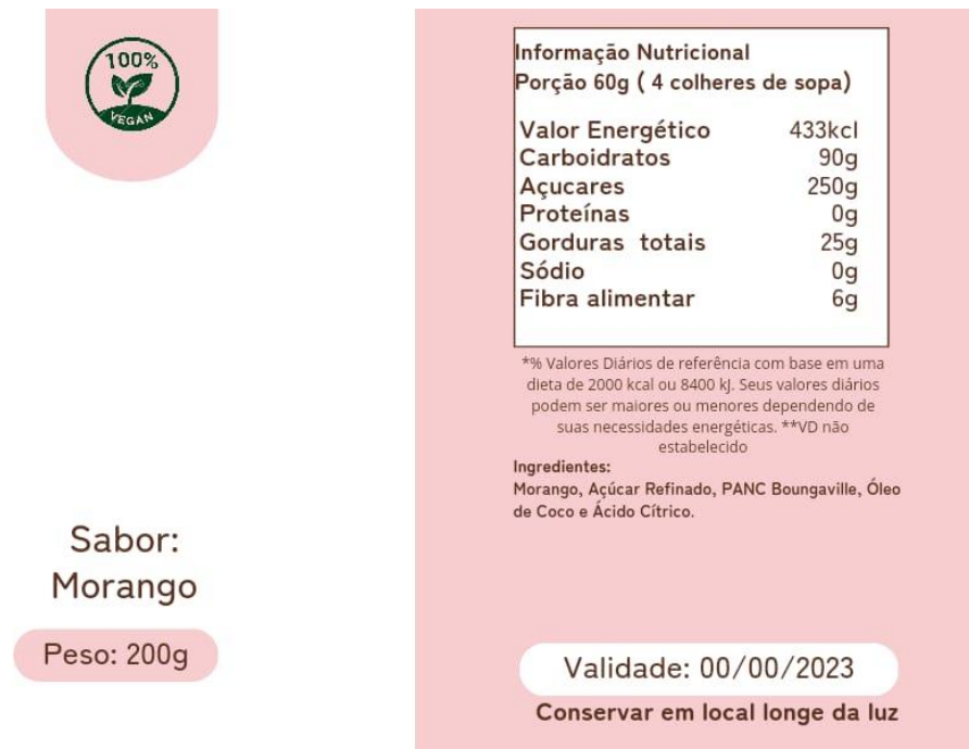
Figura 4: Apresenta a informação nutricional do creme de morango.