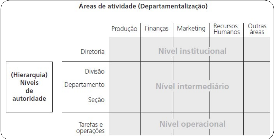
Imagem 1 - Constituição típica de uma empresa