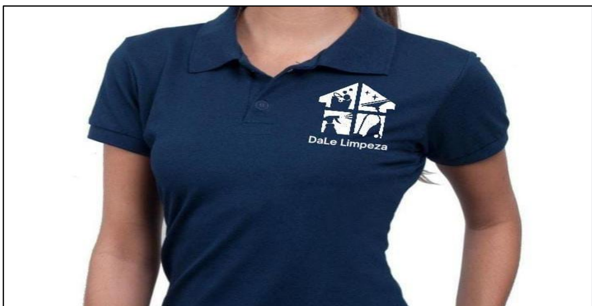
Figura 8