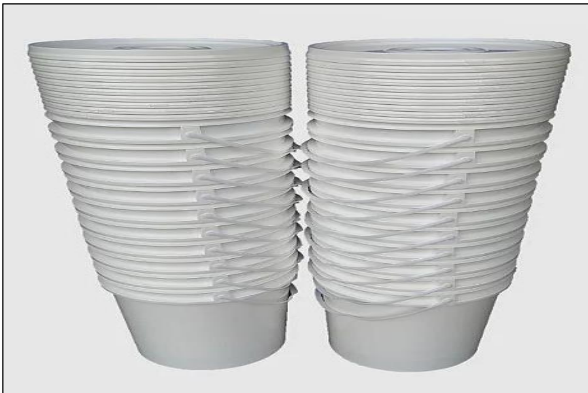
Figura 6