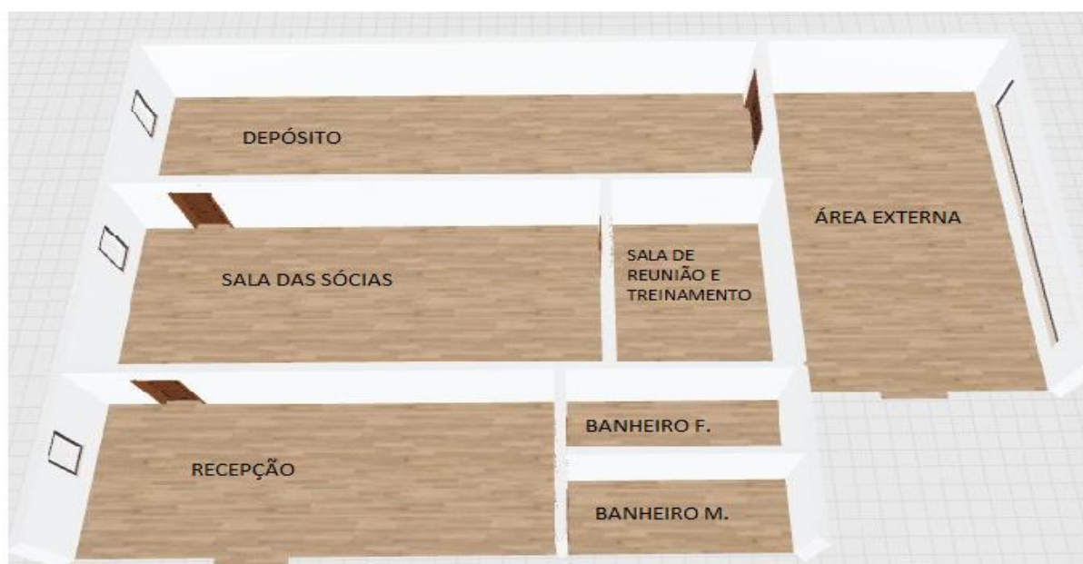
Figura 1:

A entrada principal será para a recepção dos nossos clientes, levando em consideração o conforto deles, serão colocados poltronas, bebedouro e um coffe space, lixeira, e dois banheiros. A segunda sala será reservada para as sócias, realizarem as suas respectivas tarefas, e neste espaço ficarão as mesas de escritório