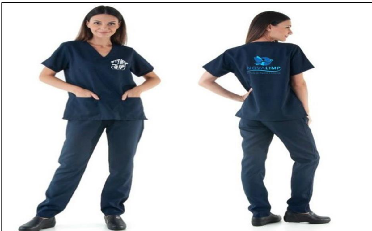
Figura 7 Fonte: Acervo dos Autores (EBT UNIFORMES)